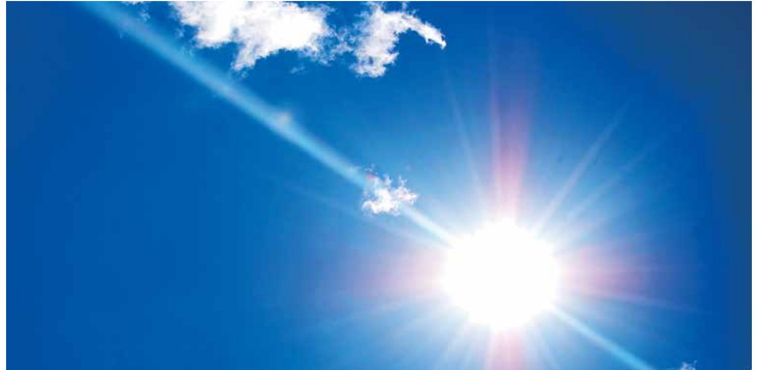
Huidkanker veroorzaakt door zonlicht komt het vaakst voor

De crèmes blijken nu net zo effectief als de moderne technologie, en ook niet onbelangrijk: minder duur. Uiteindelijk kwam imiquimod als beste ‘uit de test’. Reden om toch voor de