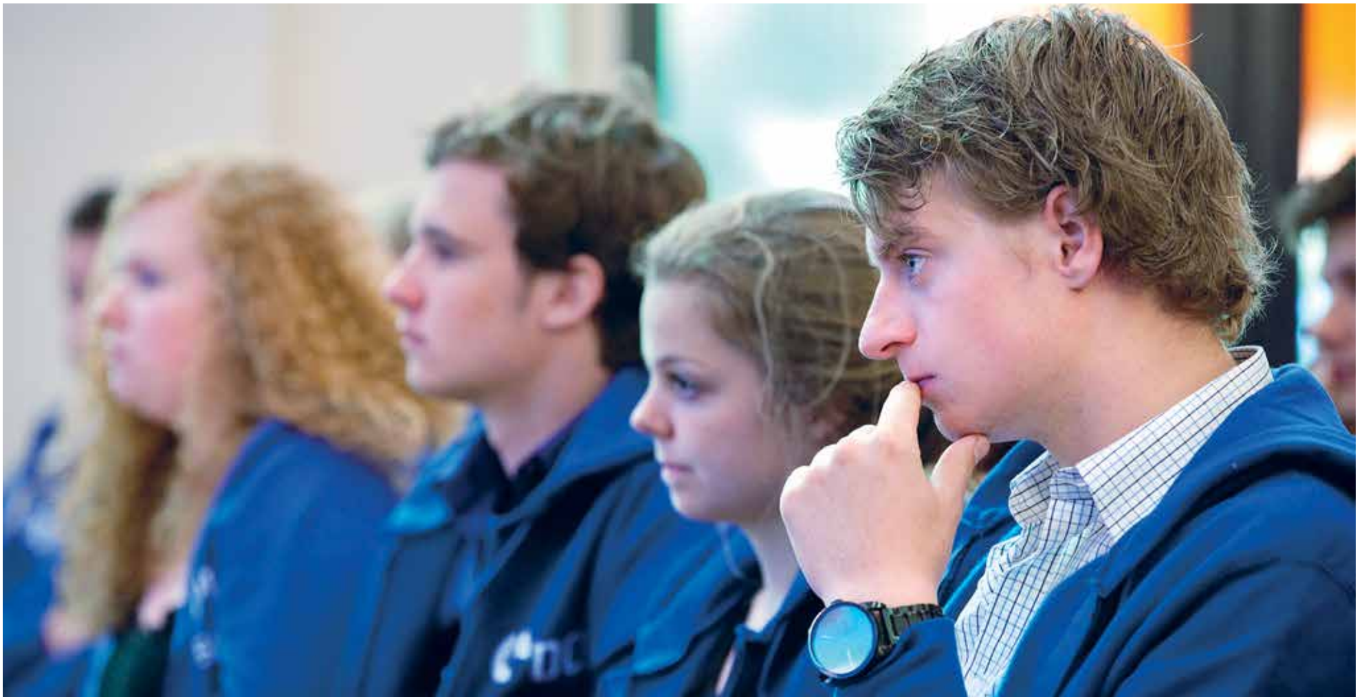
DOPE members, in blue, listening to other election candidates

Onafhankelijk weekblad van de Universiteit Maastricht | Redactieadres: Postbus 616 6200 MD Maastricht | Jaargang 33 | 16 mei 2013