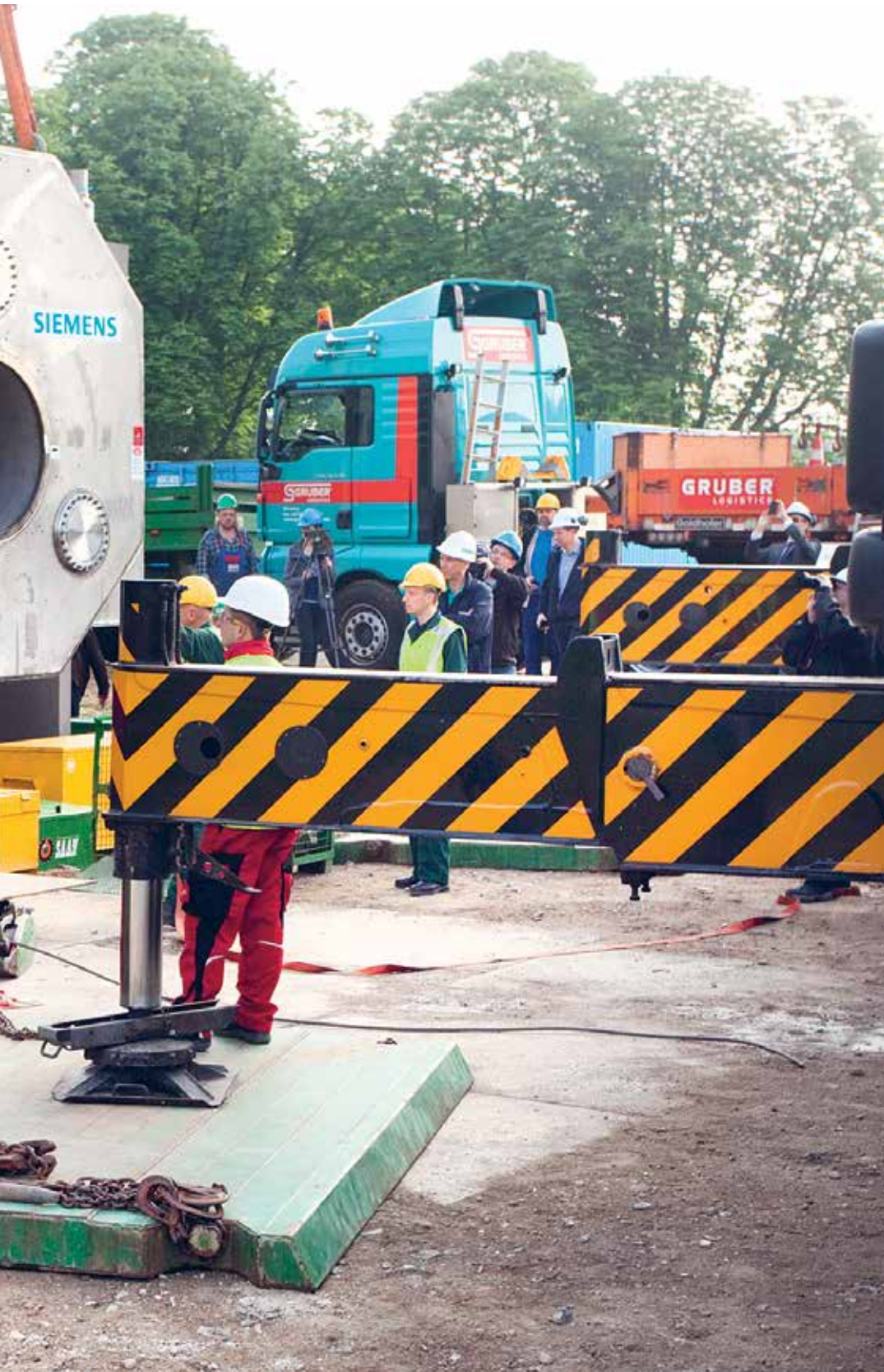
In de ochtend van 3 mei wordt de top-of-the-bill 9.4T MRI-scanner het pand van Brains Unlimited in getakeld

nee zeggen, we trekken niemand voor, maar ze snappen het wel hoor."