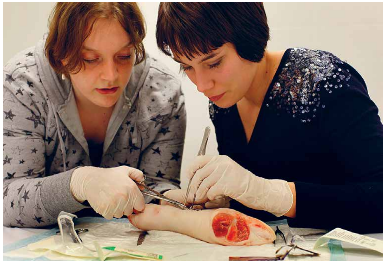
Studenten geneeskunde oefenen in het skillslab

"Verbazingwekkend." Zo bestempelt de leiding van de Maastrichtse opleiding geneeskunde het jongste advies van het Capaciteitsorgaan aan de minister van Volksgezondheid om vanaf 2015 landelijk 10 procent minder eerstejaars geneeskunde toe te laten. "Vorig jaar moesten we er nog 200 extra aannemen."