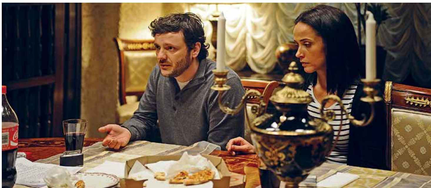
Still uit Child's Pose

- De kurk waar Child's Pose op drijft is het sterke scenario van Razvan Radulescu, die op heel knappe wijze een weinig opbeurende dissectie van Roemeense klassenjustitie en corruptie weet te verweven met een psychologisch drama over verstikkende familiebanden.