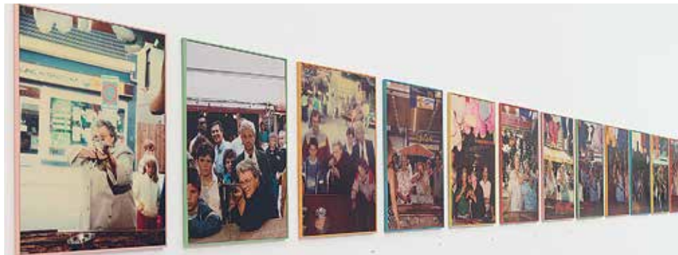
Hall overview exhibition Self Unself: Design Academy Eindhoven in the Van Abbemuseum