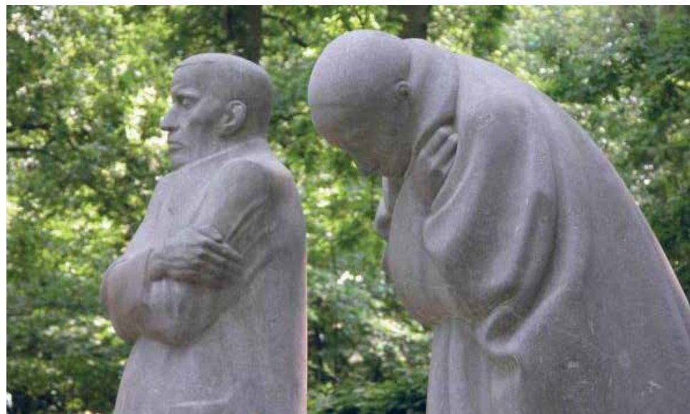
The Grieving Parents

Leroy became interested in the artist's life and also discovered her drawings. "Simple pencil drawings, but brilliant. Her husband was a GP with a social conscience in a poor part of Germany. It was the end of the nineteenth century, the time of Marxism. She sketched the strikes, the hunger, and the poverty. But also