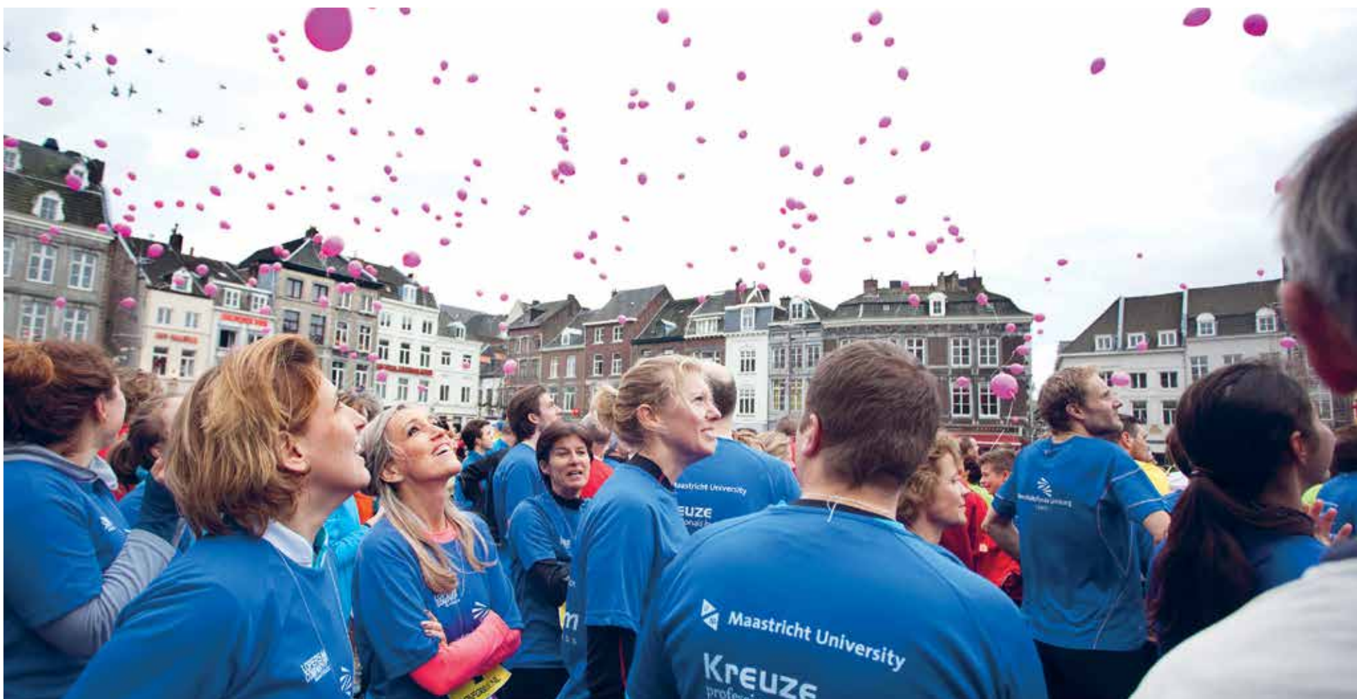
180 UM-ers liepen afgelopen weekend mee met 'Zweit veur Leid'. Zie pagina 3

Onafhankelijk weekblad van de Universiteit Maastricht | Redactieadres: Postbus 616 6200 MD Maastricht | Jaargang 34 | 9 januari 2014