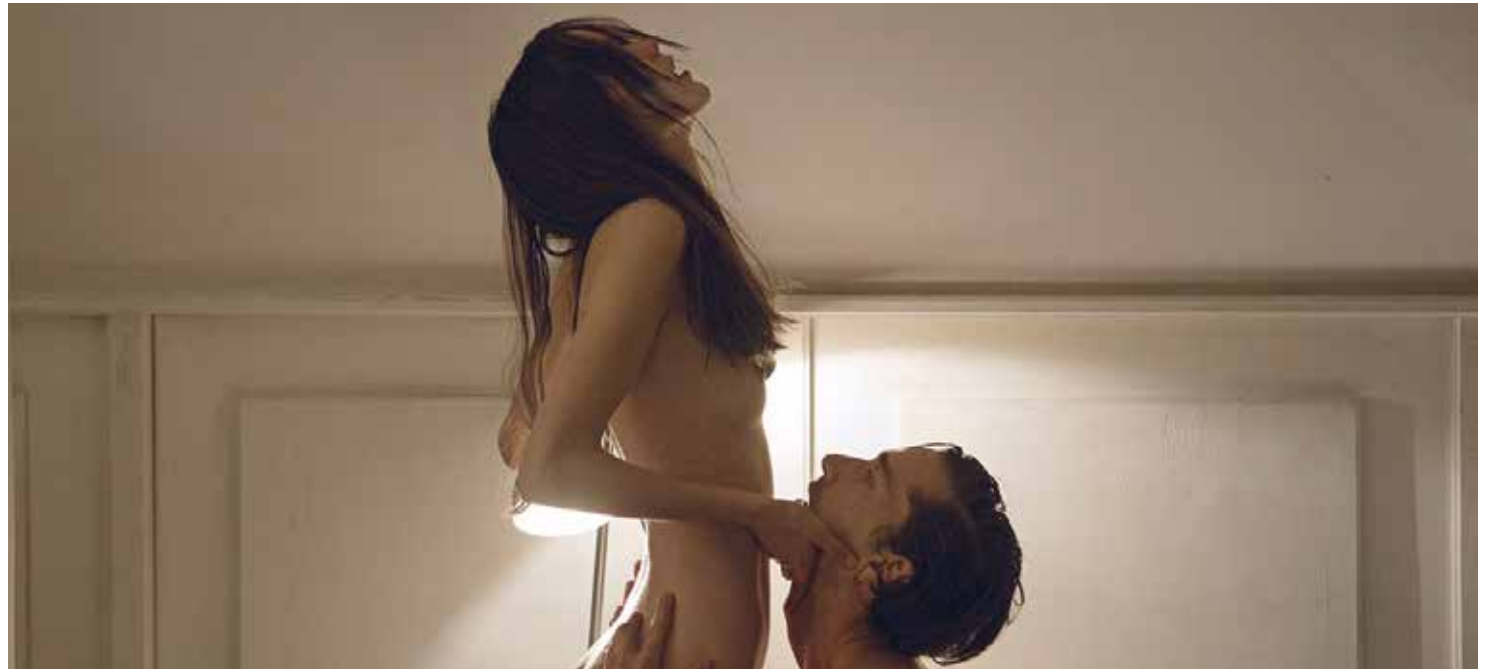
Still uit Nymph()maniac I + II

speelse en geestige terzijdes over cakevorkjes, de polyfonie van Bach, vliegvisseren en de nobele kunst van het achteruit inparkeren. En nooit geweten dat je mensen psychologisch kunt duiden door te letten op de volgorde waarin ze hun nagels knippen.