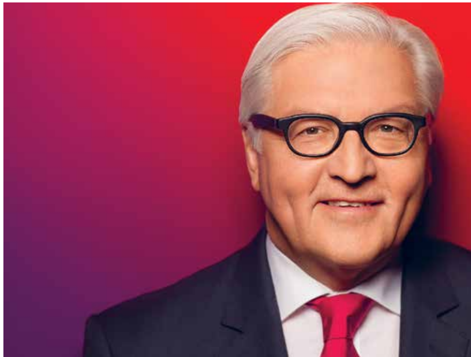
Frank-Walter Steinmeier

Bundestag than you will in the Dutch parliament. I have followed the discussion in Germany to some extent, and sensible people there are now saying that the permanent link between title and name should be abolished, so that it is no longer in your passport, and that we should go back to a purely academic title.