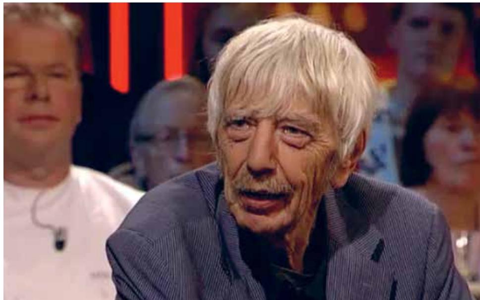
Still uit De Wereld Draait Door