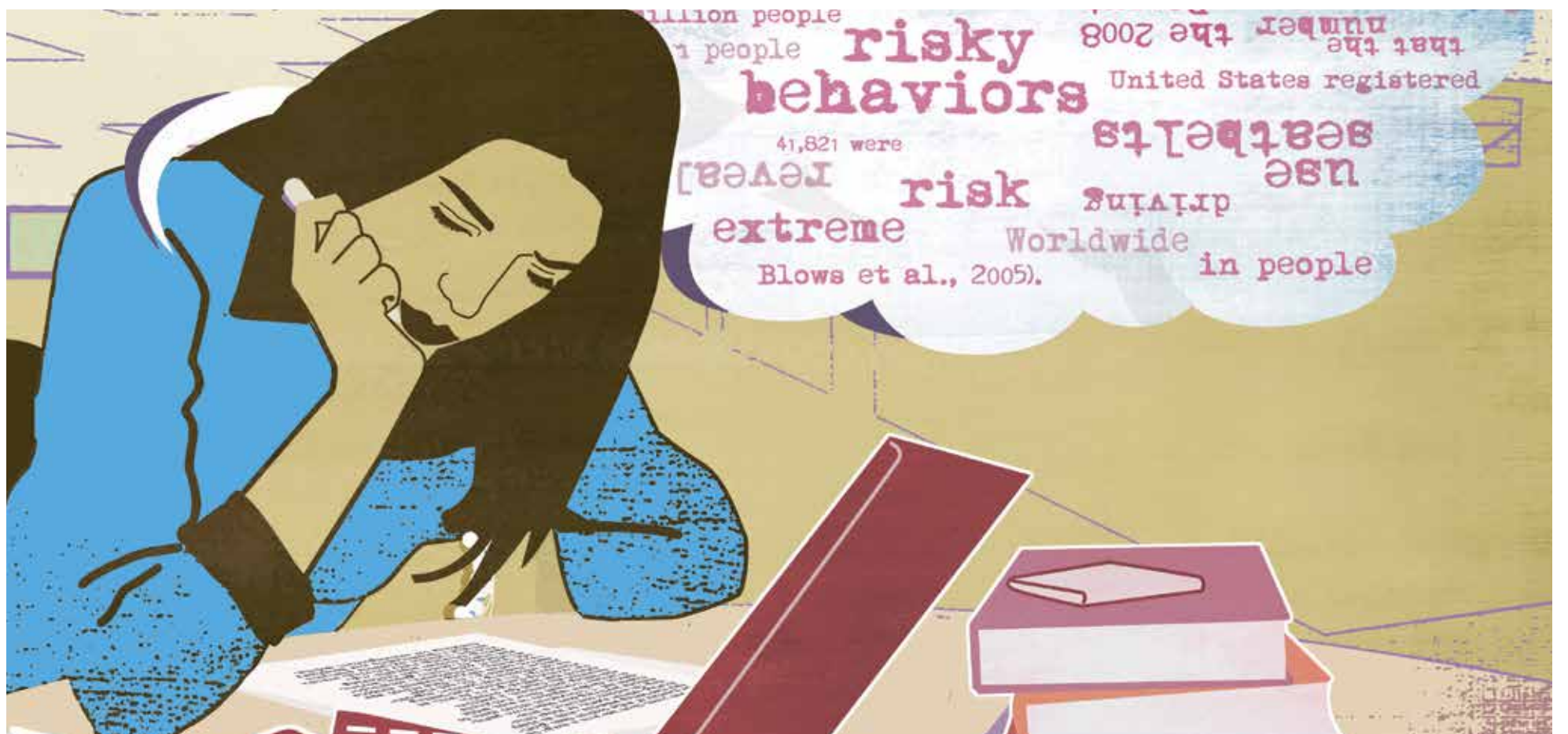
Publiceren in een wetenschappelijk tijdschrift als Nature of The Lancet. Hoe krijg je het voor elkaar? "Schrijf kort en bondig en houd die rode draad in de smiezen". Zie pagina 8-9. Illustratie: Simone Golob

Onafhankelijk weekblad van de Universiteit Maastricht | Redactieadres: Postbus 616 6200 MD Maastricht | Jaargang 34 | 3 oktober 2013