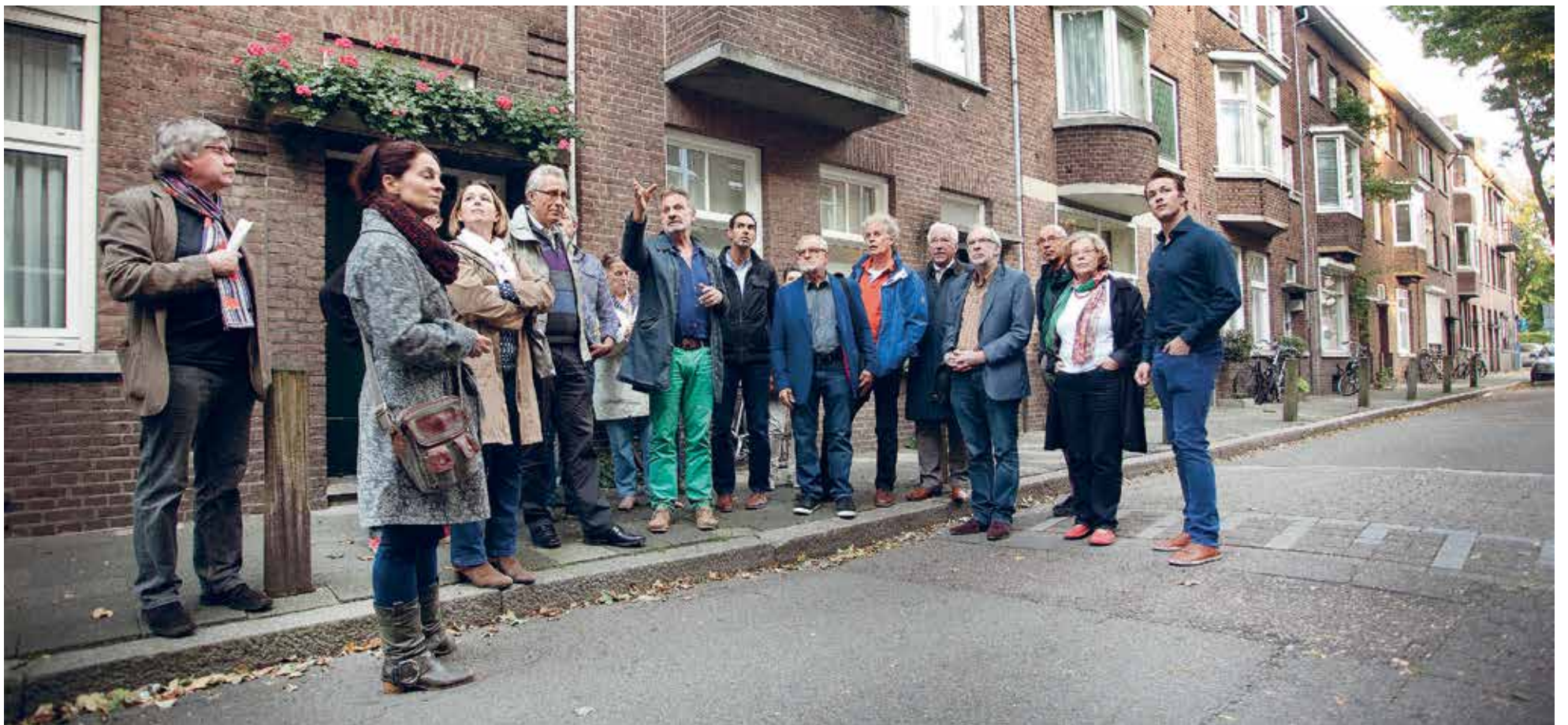
Buurtbewoners hebben gemeenteraadsleden uitgenodigd om de snelle en vaak illegale toename van studentenpanden met eigen ogen te zien