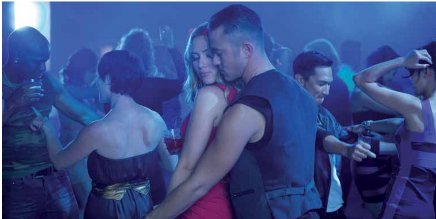
Still uit Don Jon

Een film met de subtiliteit van een pletwals, want: