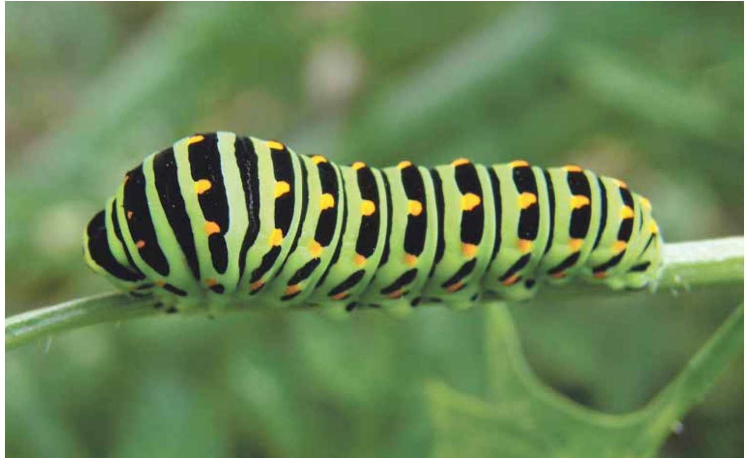
Scientists are trying to build a soft robot that moves like a caterpillar