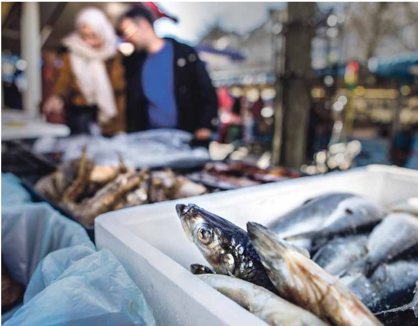
At the Friday fish market

The cornerstone of the Friday market in Maastricht is the fish market. It's a Catholic tradition to eat in moderation on the day of the week on which Jesus was crucified. In practice, this meant people ate fish on Fridays instead of meat – if they could afford to do so, that is. As a result, the demand for fish in the Catholic south of the Netherlands was highest on Fridays. The effects of this can be seen in Maastricht to this day: while there aren't many fish shops in the city, there's a great fish market every Friday. I go there to buy fresh fish almost every week.