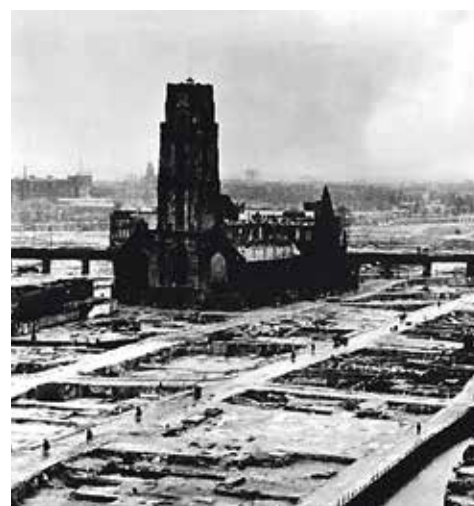
Laurenskerk in Rotterdam na bombardement van mei 1940

De aanval op Rotterdam wordt, zeker in een land zonder oorlogservaring, gezien als een Duitse misdaad: het bombarderen van open steden. Een paar jaar daarvoor was dat begonnen met het onverhoeds door Duitse vliegtuigen vernietigen van de stad Guernica tijdens de Spaanse burgeroorlog. Toen