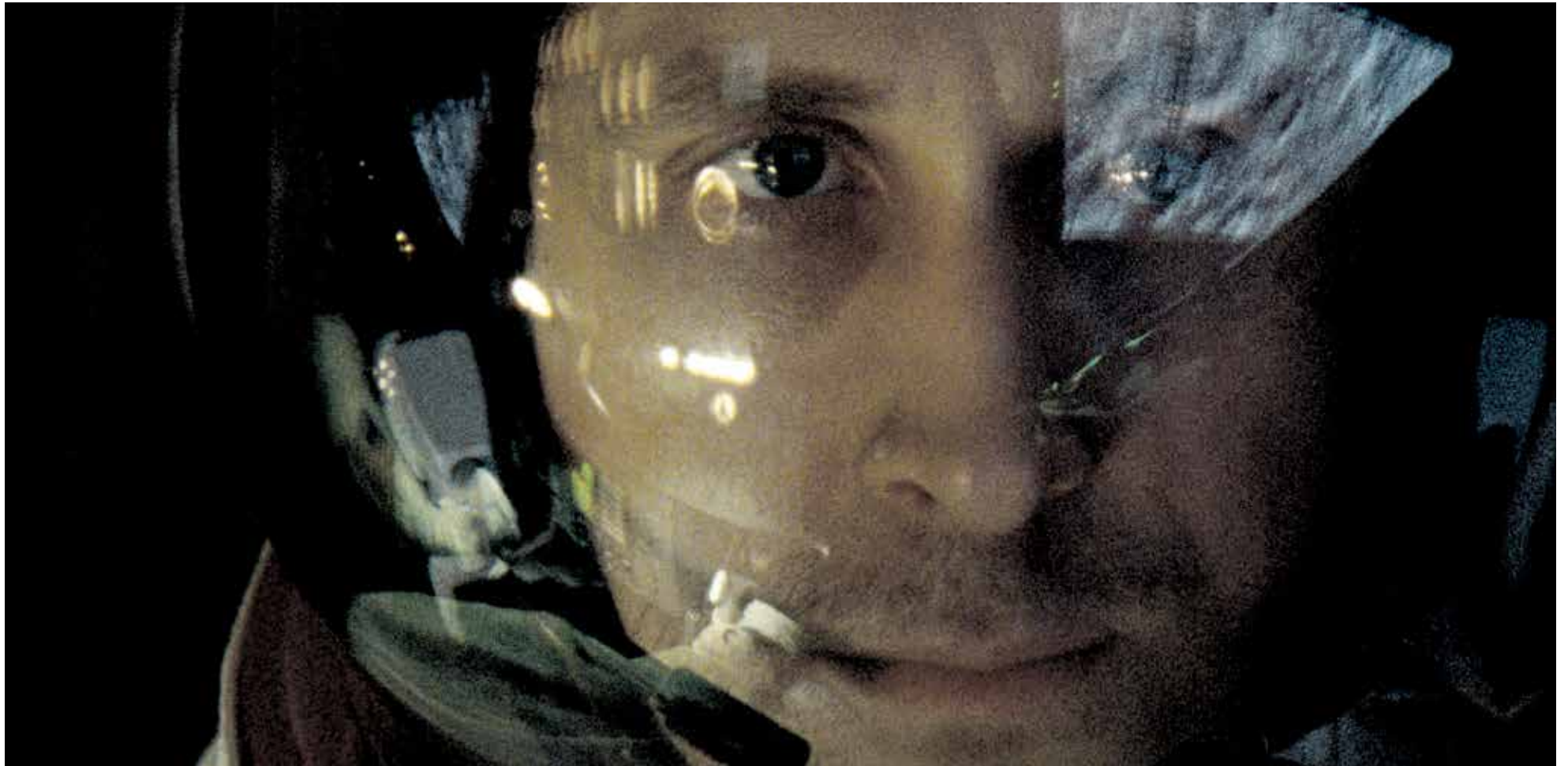
Still uit First Man

Verhaal: In First Man volgen we astronaut Neil Armstrong (Ryan Gosling) naar het moment suprême dat hij als eerste voet op de maan zet. Maar tegelijkertijd wordt duidelijk welke zware wissel de ruimtereis trekt op het leven van zijn gezin.