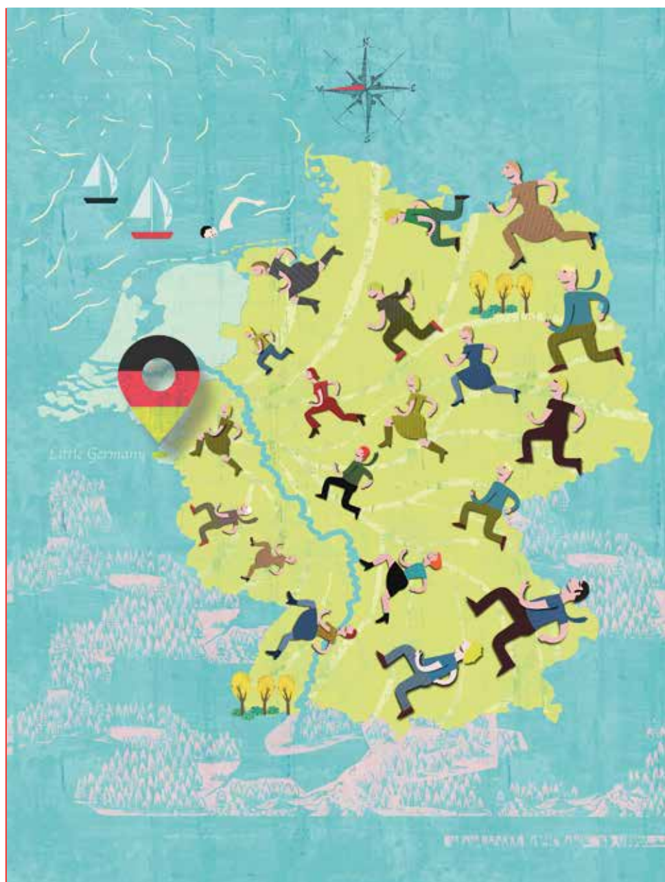
Illustration: Simone Golob