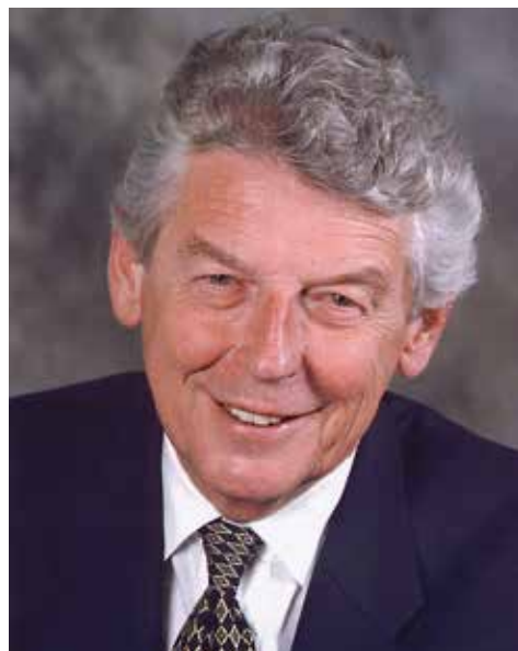
Wim Kok

Kok bedoelde met zijn befaamde oproep aan zijn partij om “de ideologische veren af te schudden” niet in de eerste plaats dat de sociaaldemocratie zijn uitgangspunten moest