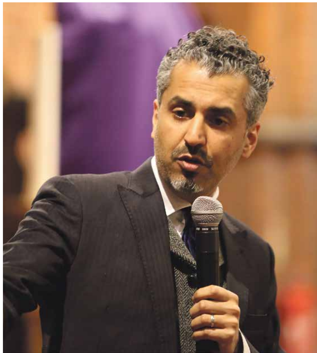
Maajid Nawaz

At the age of sixteen, the British-Pakistani Maajid Nawaz joined Hizb ut Tahrir, a world-wide Islamist organisation that aims at establishing a caliphate. Nawaz becomes a leader, but eventually ends up in an Egyptian jail. After spending four years in prison, he changes course, distances himself from Hizb ut Tahrir, and turns against Islamism.