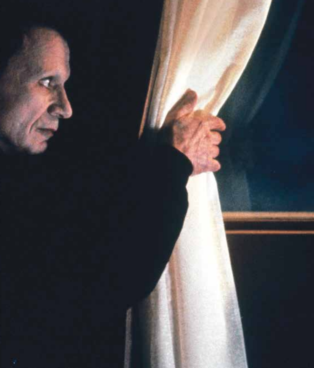
Still uit de film Lost Highway

Verrassend, gezien zijn verontrustende, nachtmerrie-achtige films.