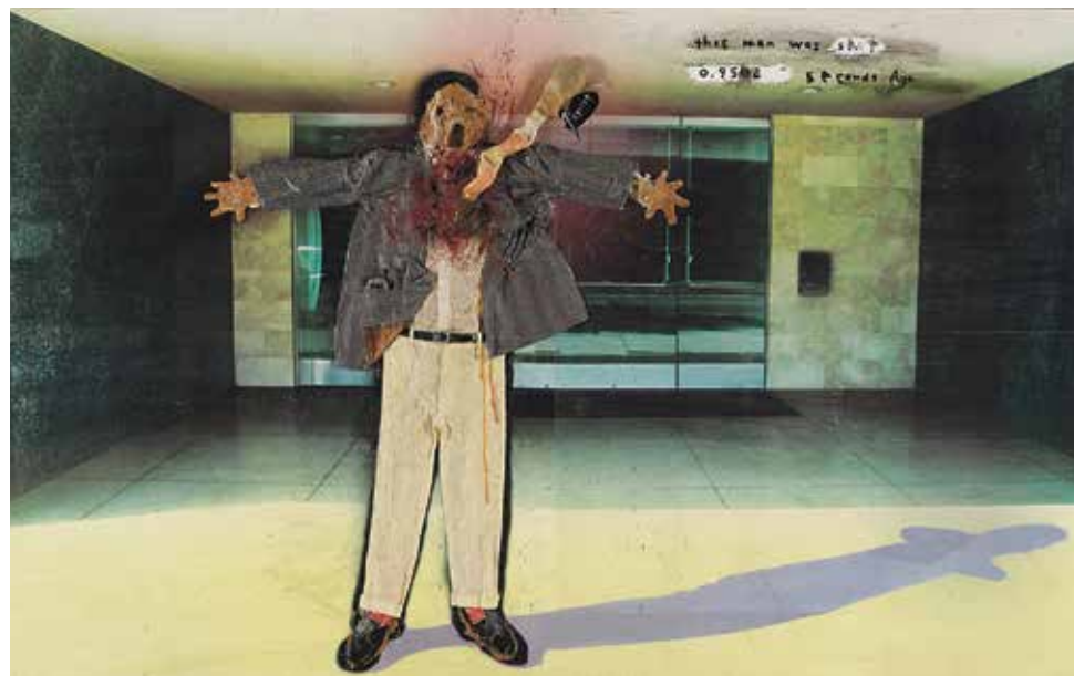
Titel: This man was shot 0.9502 seconds ago (2004)

“Ik ben een keer of drie bij hem thuis geweest in Los Angeles. Een zachtvaardig en innemend mens, een en al vrolijkheid en zonnenschijn.”