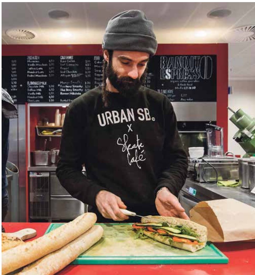
Banditos in Randwijck

Het lijkt evident dat een universiteit mensa's nodig heeft, maar dat is het niet. Een belangrijk onderdeel van een gezonde levensstijl is gedoseerde dagelijkse beweging, en een wandelingetje van het instituut naar een eetgelegenheid in de buurt past daar uitstekend in. Dus eten in het eigen gebouw is weliswaar gemakkelijk, maar niet noodzakelijk goed voor je.