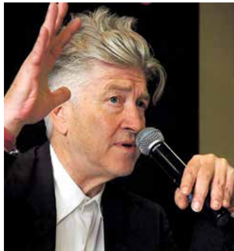
David Lynch