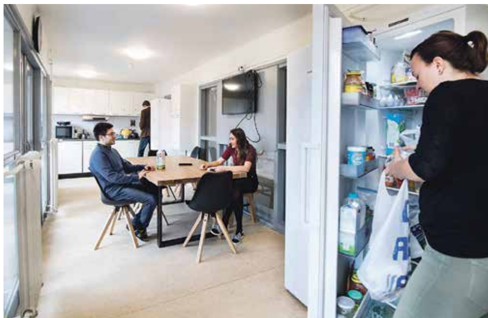
Kitchen/common room for 27 students

Not only are there fewer reports from students, says Maurice Evers, department head of Student housing at Maastricht University, there are also fewer complaints from the neighbours. There is 24-hour security on the premises at Brouwersweg: one person makes the rounds and two keep watch from the main building of the Guesthouse using cameras on the grounds. “Of course this doesn’t prevent all problems, but it helps. We even received compliments during our last neighbourhood information evening.” There is a winter party planned for students and