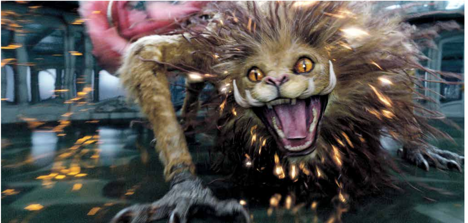
Still uit Fantastic Beasts: The Crimes of Grindelwald

Verhaal: Fantastic Beasts: The Crimes of Grindelwald is een vervolg op Fantastic Beasts and Where to Find Them - beide gebaseerd op boeken van J.K. Rowling. In deel 2 nemen de tovenaars Newt Scavenger, Tina Goldstein en haar zus Queenie en de mens Jakob Kowalski het op tegen de magiër Grindelwald (Johnny Depp). Deze is erop uit om een oorlog tussen mensen en magiërs te ontlokken.