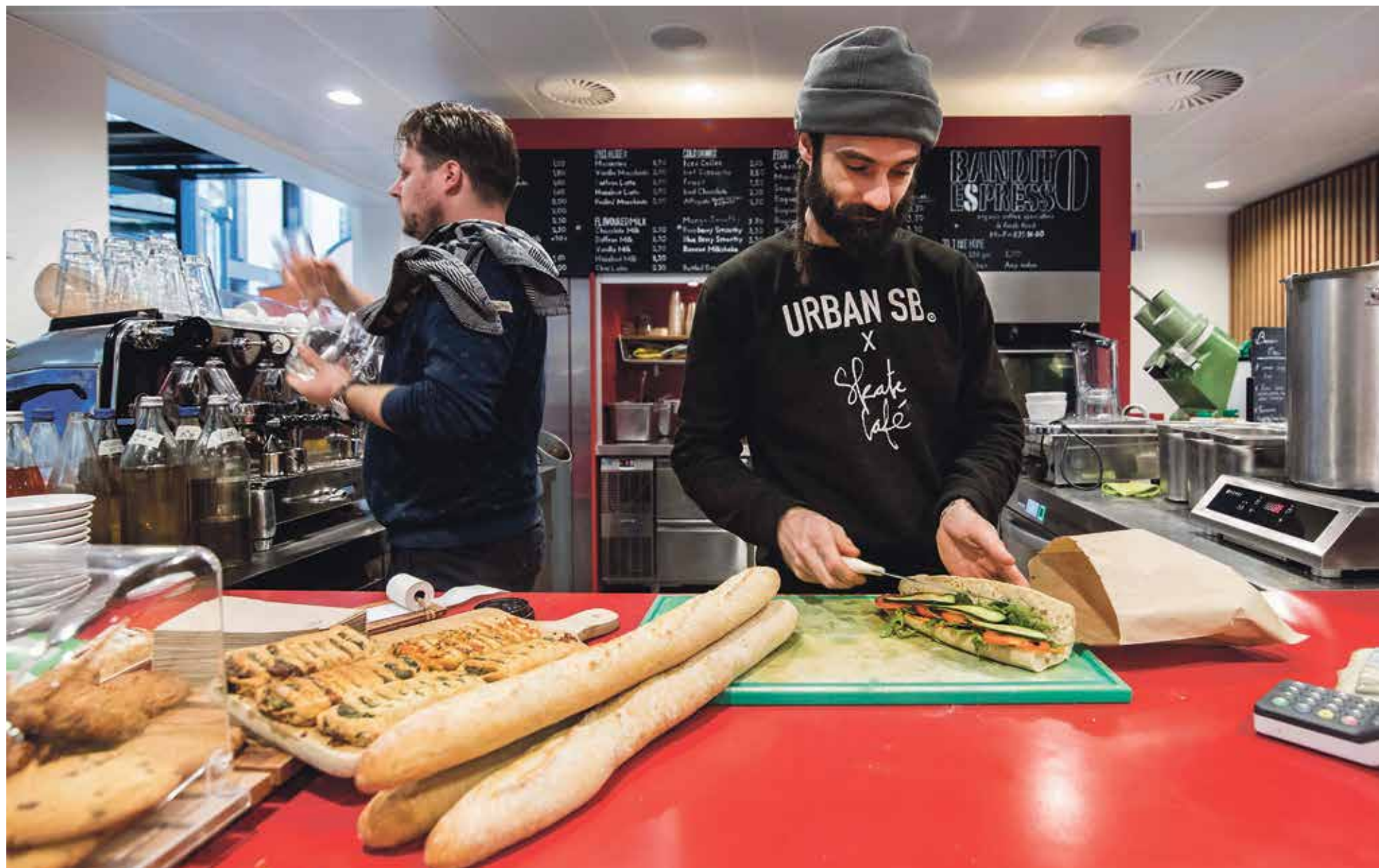
Banditos in Randwyck