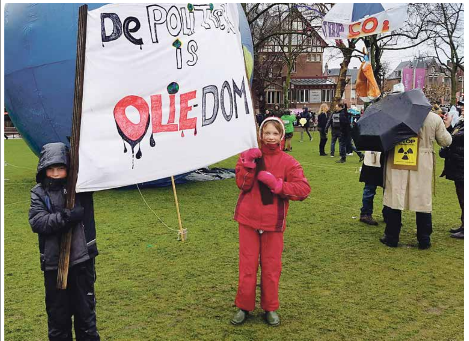
"Politics is as dumb as an ox", demonstrating in Amsterdam last Sunday

After Brussels, Berlin and Amsterdam, the climate march has come to Maastricht. On Friday 15 March the protesters will start their march on the Vrijthof at 11.00 hrs.