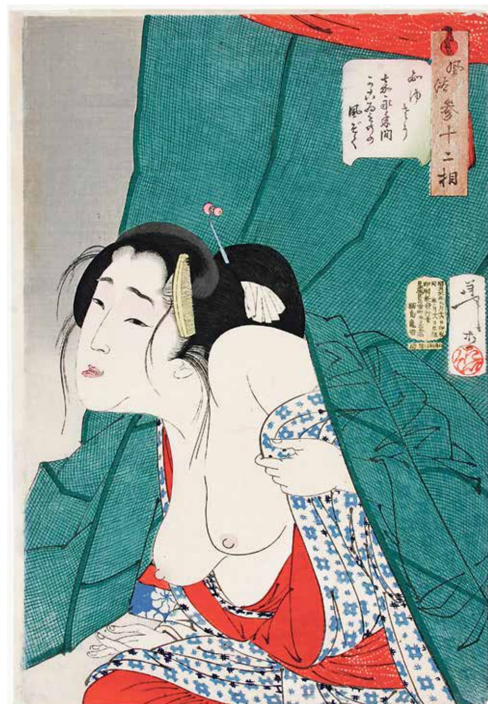
Yoshitoshi, T. Looking Itchy: The Appearance of a Kept Woman of the Kaei Era . c. 1888. Centre Céramique