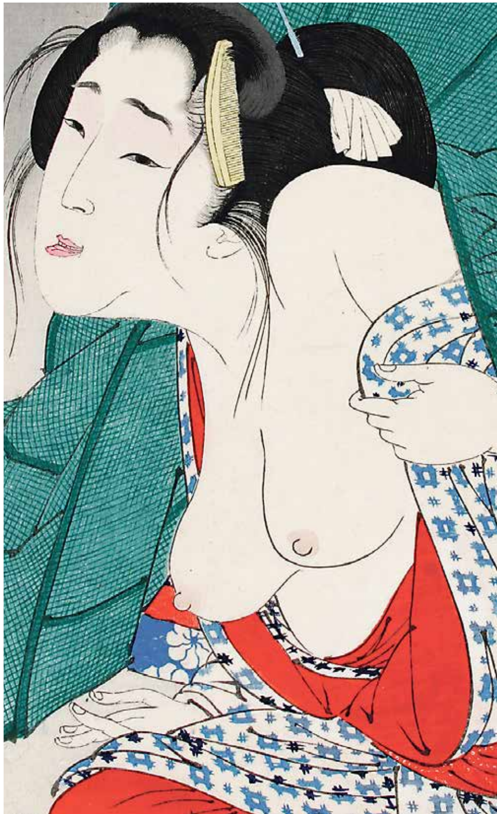
Seksuele voorlichting en het taboe daarop: expo tijdens de Maastricht Antiquarian Book and Print Fair. Zie pagina 11. Yoshitoshi, T. Looking Itchy, Centre Céramique

docent humane biologie, was bezig aan zijn tweede termijn als voorzitter en werd vorig jaar maart herbenoemd voor een periode van twee jaar. Hij was als ‘externe’ voorzitter aangesteld en dus geen lid van de U-raad.