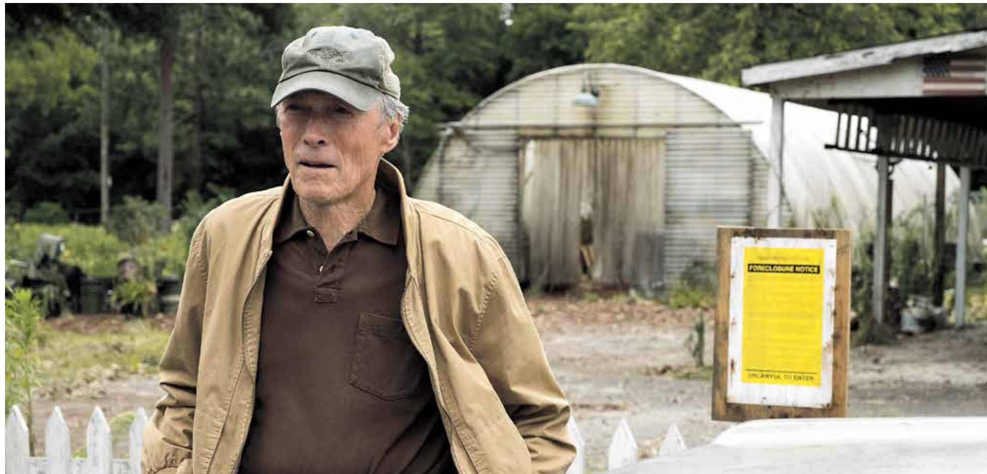
Still uit The Mule

Inhoud: De oude Earl Stone (Clint Eastwood) heeft zijn vrouw (Dianne Wiest) en zijn dochter Iris (Alison Eastwood) behoorlijk verwaarloosd. Hij was vooral bezig met het kweken van daglelies. Zijn vrouw is van hem gescheiden en zijn dochter praat al twaalf jaar niet meer met hem, omdat hij verstek heeft laten gaan op haar huwelijk. Als zijn kwekerij over de kop gaat, kan Earl flink wat geld verdienen als koerier voor een drugskartel. Met dat geld probeert hij zijn fouten uit het verleden te herstellen, al merkt hij al snel dat de drugshandel een gevaarlijke zaak blijft.