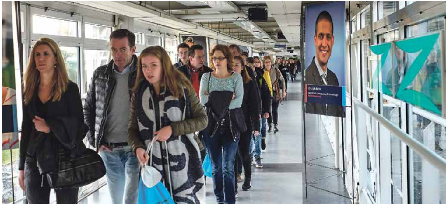
Studenten bezoeken open dagen om een indruk van de opleidingen te krijgen. De Keuzegids maakt jaarlijks een ranking

De Universiteit Maastricht is volgens de Keuzegids Masters 2019 samen met de Rijksuniversiteit Groningen de beste algemene Nederlandse universiteit. Acht Maastrichtse studies kregen het predicaat topopleiding. De master Learning and Development in Organisations van de School of Business and Economics behoort zelfs tot de vijf beste opleidingen van Nederland met een 9,1 als rapportcijfer. Health Education and Promotion scoort het slechtste van alle Maastrichtse masters.