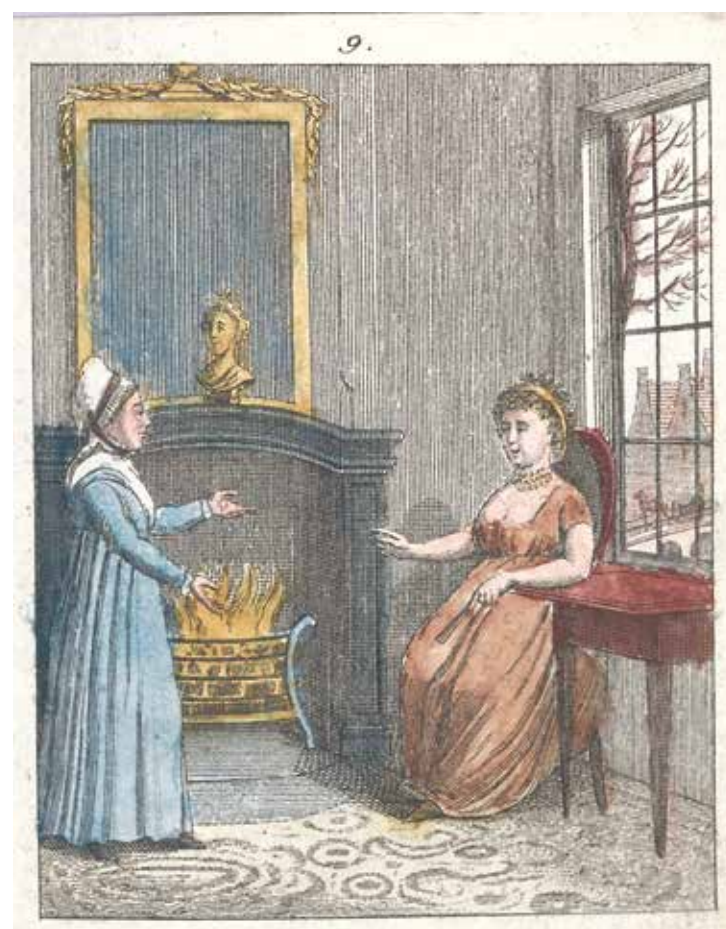
Coosje en Betje: F. van Aken - Deugdrijke Voorbeelden en Zedelijke Gesprekken voor de Jeugd, Tweede Stukje . 1801. Centre Céramique

Maastricht Antiquarian Book and Print Fair, 15 t/m 17 maart, vrijdag: 14.00-19.00, zaterdag: 10.00-18.00, zondag: 10.00-17.00 uur, Sint Janskerk