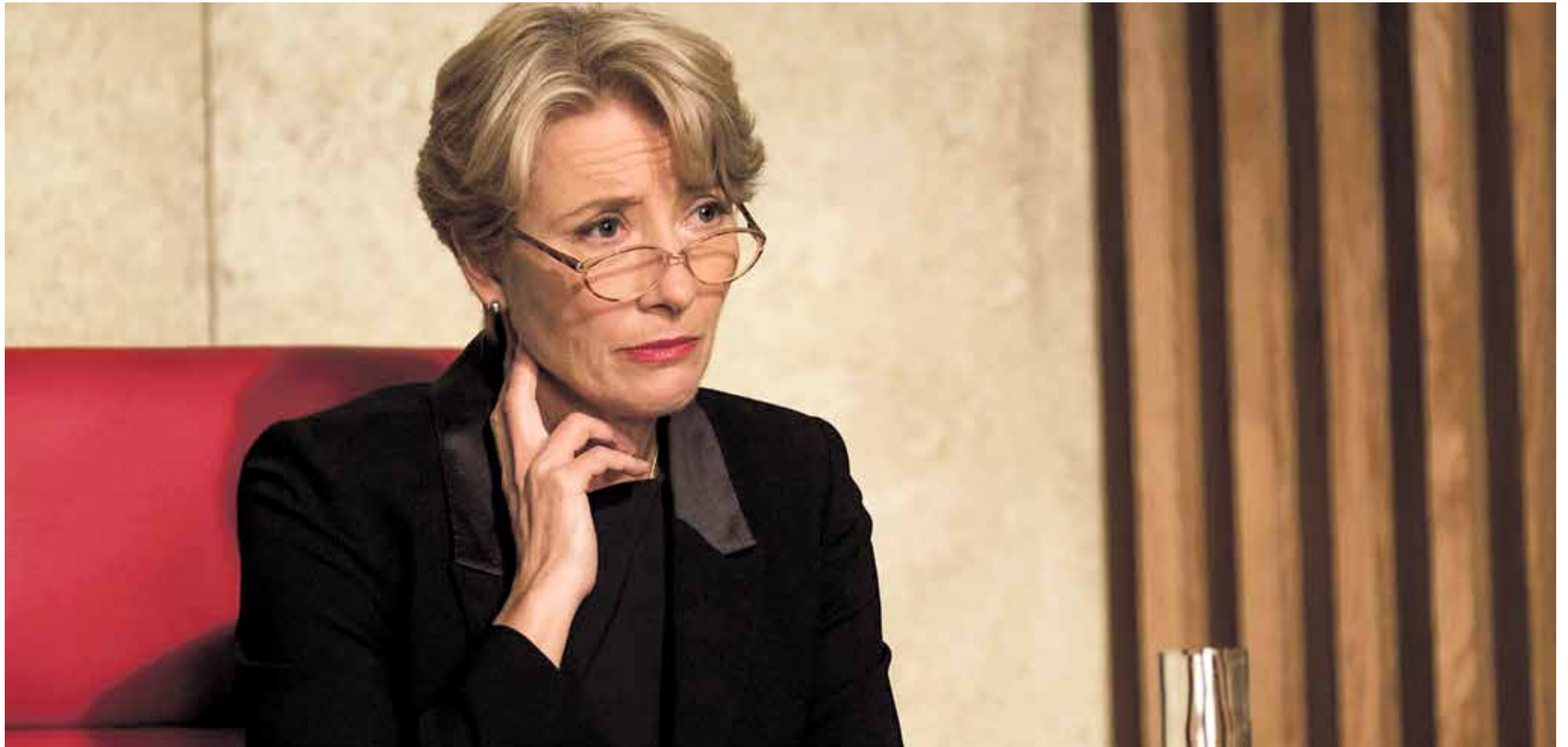
Still uit The Children Act

Verhaal: The Children Act is de tweede boekverfilming van Ian McEwan - na On Chesil Beach - die dit jaar in de Nederlandse theaters te zien is. Emma Thompson speelt rechter Fiona Maye die een uitspraak moet doen in de zaak van de minderjarige Adam Henry (Fionn Whitehead), die aan leukemie lijdt. Mag er wel of geen bloedtransfusie worden gegeven, nu Adams ouders dit op religieuze gronden weigeren. Ondertussen brokkelt het huwelijk van Fiona met haar man Jack (Stanley Tucci) steeds verder af.