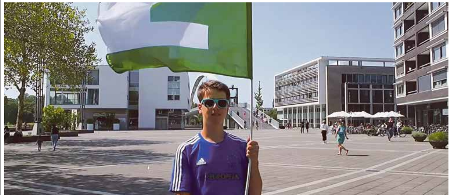
Still from the Treaty, ciao! youtube video