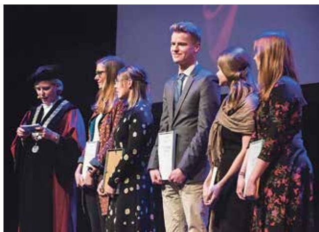
Five of the 9 master's Student Prize winners

A total of 26 students, from various study programmes, received a prize for their theses last Tuesday. The (17) bachelor's students did so in the morning in the auditorium on the Minderbroedersberg, the master's students in the afternoon during the foundation day celebrations in the Vrijthof Theatre. Observant spoke to two of them.