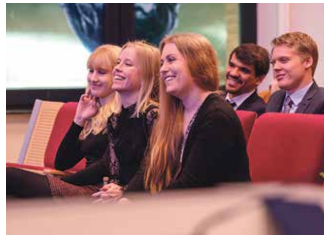
Five of the 17 bachelor's Student Prize winners