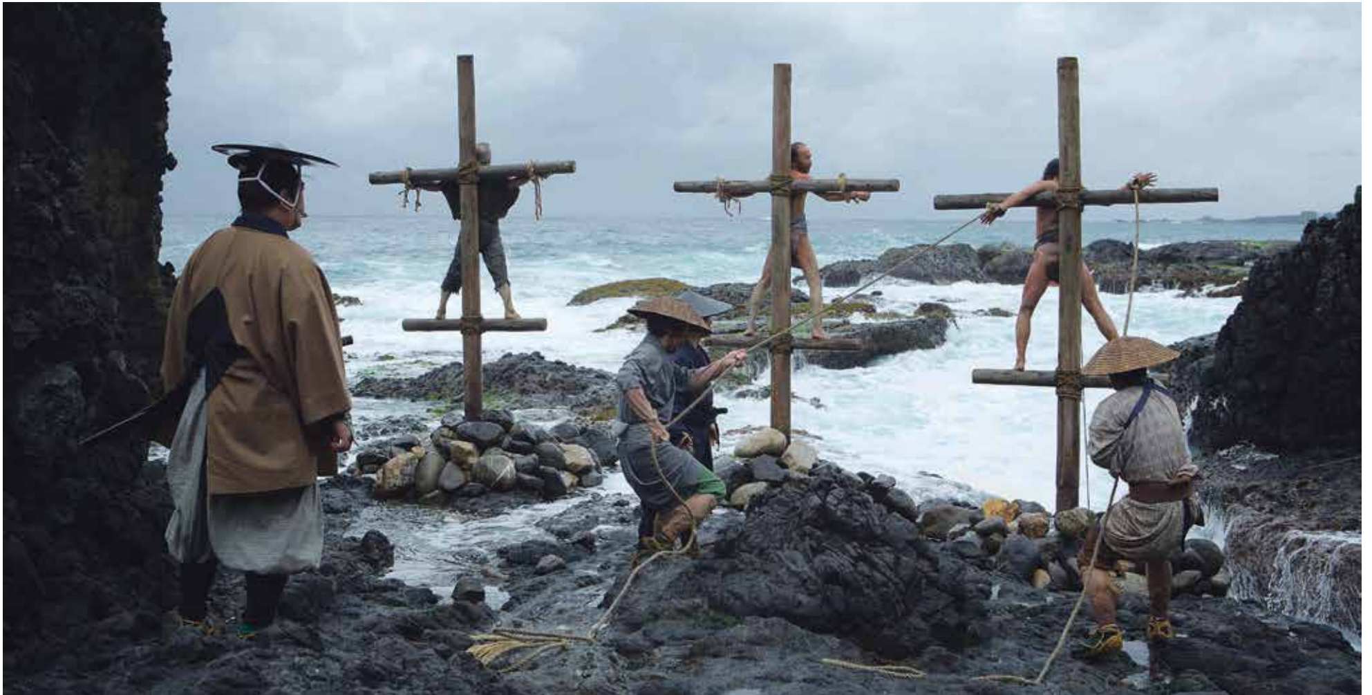
Still uit Silence

Het verhaal: Japan, 1637. In een tijd dat Christenen gruwelijk worden vervolgd, verdwijnt de priester Ferreira (Liam Neeson). De twee Jezuïetenpaters Rodriguez (Andrew Garfield) en Garupe (Adam Driver) besluiten om hem te zoeken en het Christendom verder te verspreiden. Tijdens die zoektocht wordt hun geloof behoorlijk op de proef gesteld.