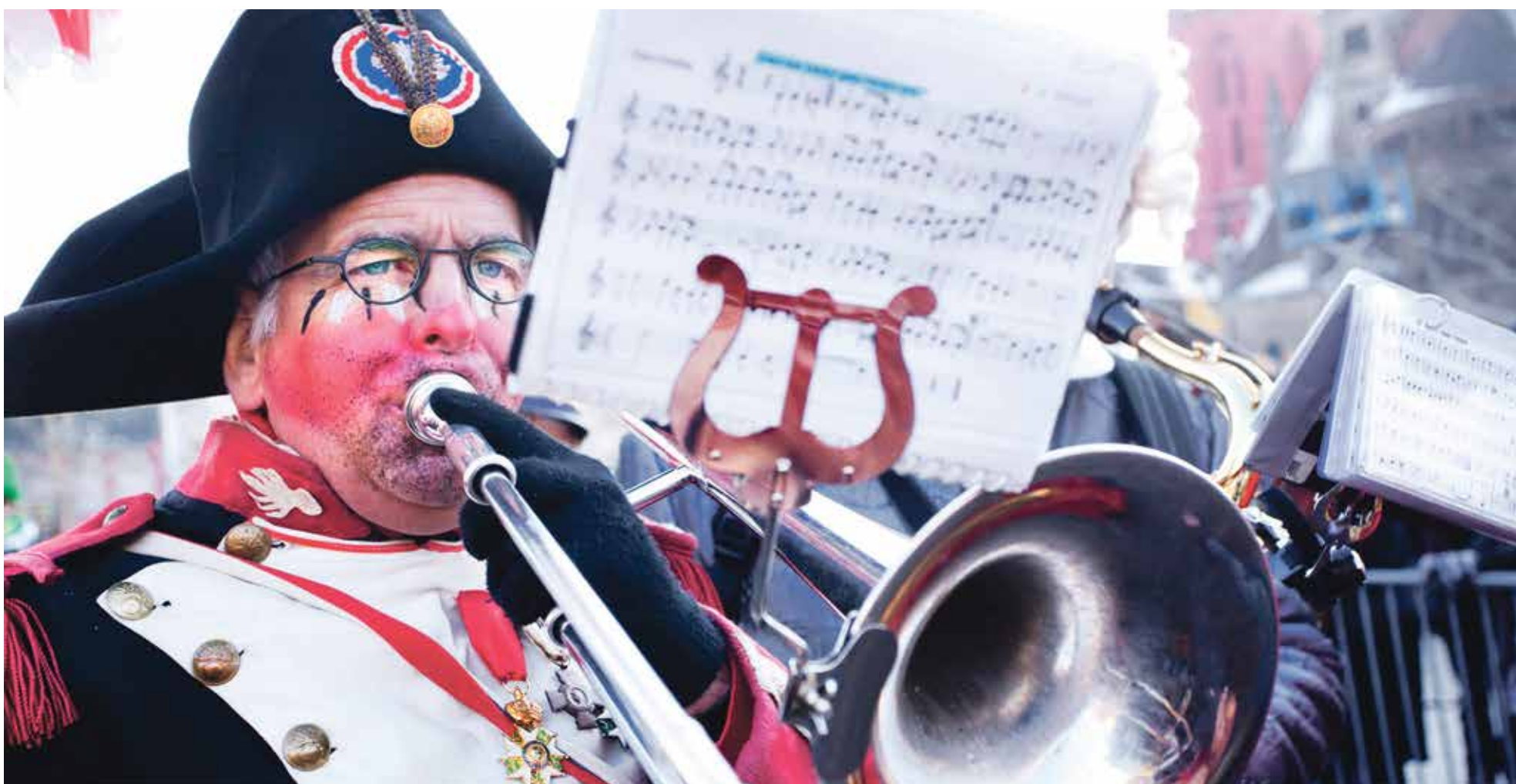
Fijne carnaval!

Onafhankelijk weekblad van de Universiteit Maastricht | Redactieadres: Postbus 616 6200 MD Maastricht | Jaargang 37 | 23 februari 2017