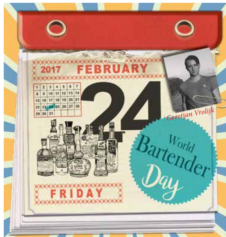
Illustration: Simone Golob

How you do that? "It starts with the music, we take care of that ourselves. Furthermore, we are always friendly and have a good time with each other. We dance, hand out free shots every now and again, and once in a while we have a beer ourselves. It is all about making contact with the crowd. That is easy for us: 90 per cent of our