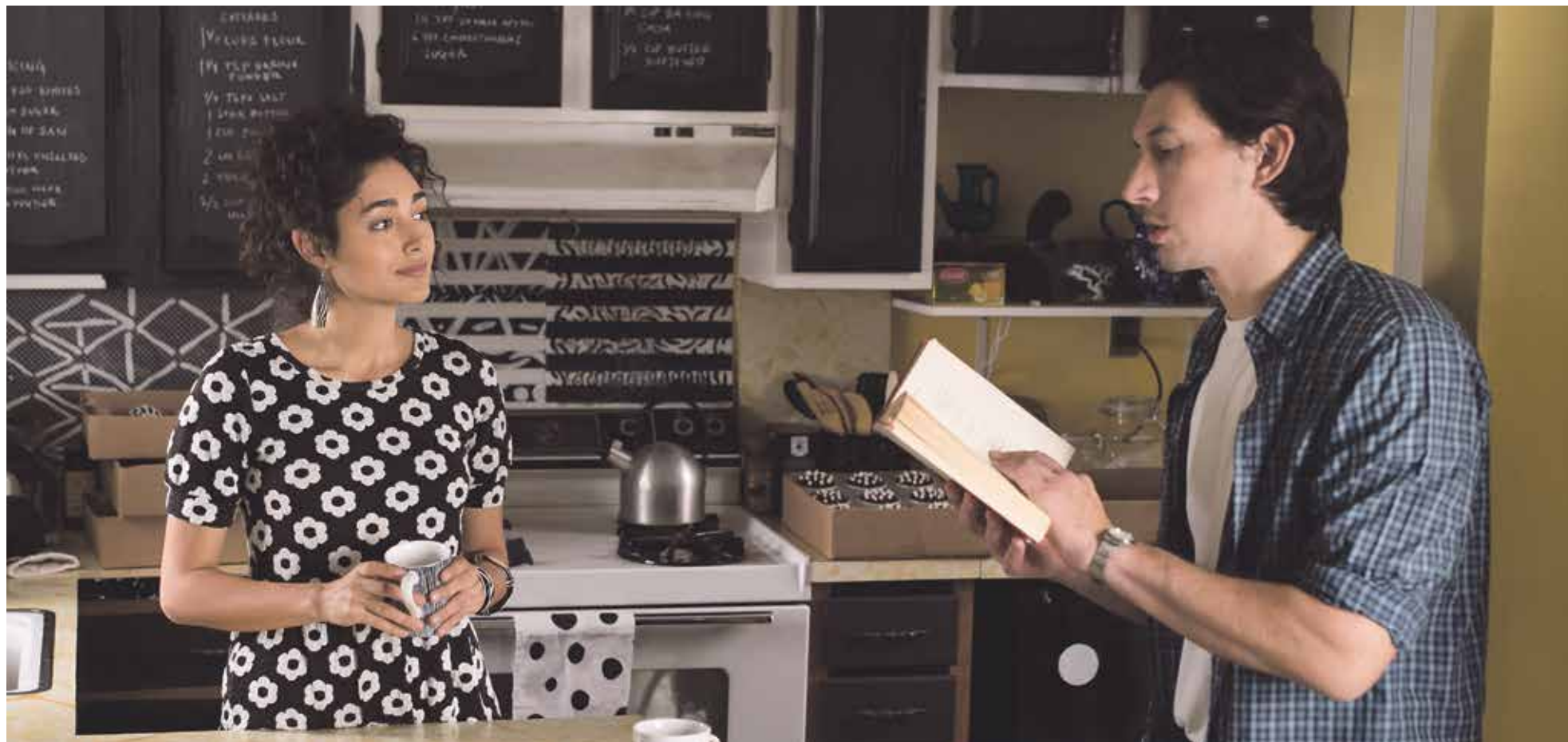
Still uit Paterson

Het verhaal: Paterson (Adam Driver) is buschauffeur in het stadje Paterson, New Jersey. Elke dag voltrekt zijn leven zich in dezelfde routine. Hij wordt wakker naast zijn mooie vrouw Laura (Golshifteh Farahani), gaat naar zijn werk, bestuurt de bus, gaat naar huis, laat 's avonds de Engelse bulldog Marvin (Nellie) uit, gaat naar een bar waar hij een glas bier drinkt en keert terug naar huis. Maar eigenlijk is Paterson een dichter.