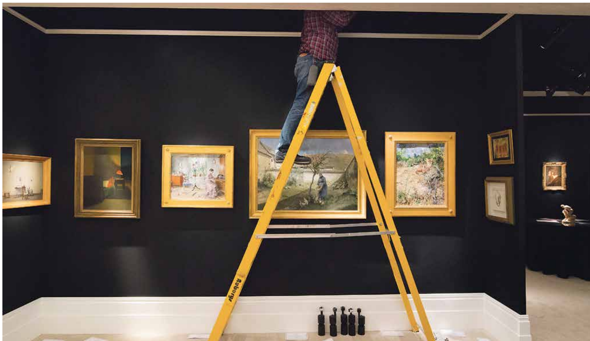
De Tefaf opent op vrijdag 10 maart de deuren. Al weken van tevoren beginnen de voorbereidingen van deze prestigieuze kunstbeurs. Dat betekent dat de UM voor haar tentamens moet uitwijken naar andere locaties. Wat vinden studenten van de alternatieven? Wat kost het de faculteiten: een student die een tentamen maakt? En wordt het niet tijd voor een eigen tentamenzaal? Zie pagina 8-9.

Onafhankelijk weekblad van de Universiteit Maastricht | Redactieadres: Postbus 616 6200 MD Maastricht | Jaargang 37 | 9 maart 2017