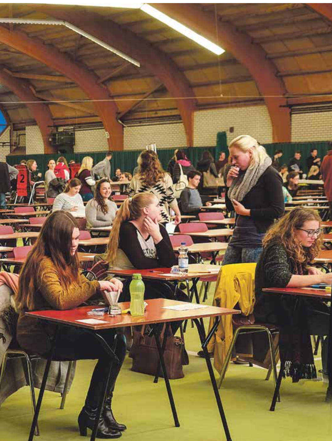
Tennishal in Pellikaan