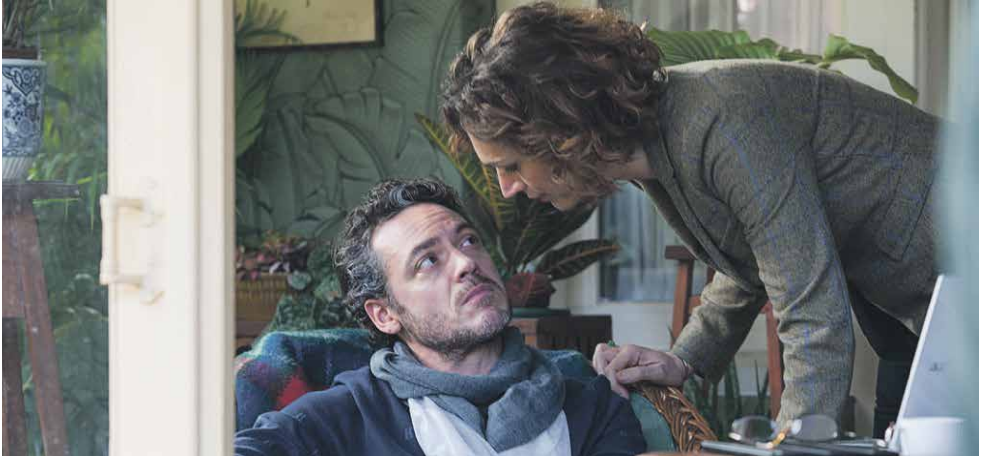
Still uit De held

Het verhaal: Het oorlogsverleden van Sara's vader (Hans Croiset) blijkt anders te zijn dan hij altijd beweerd heeft. Dat verleden zal ook Sara (Monic Hendrickx) en haar gezin op een zeer onaangename manier treffen als er iemand blijkt te zijn die nog een appeltje te schillen heeft met Sara's vader.