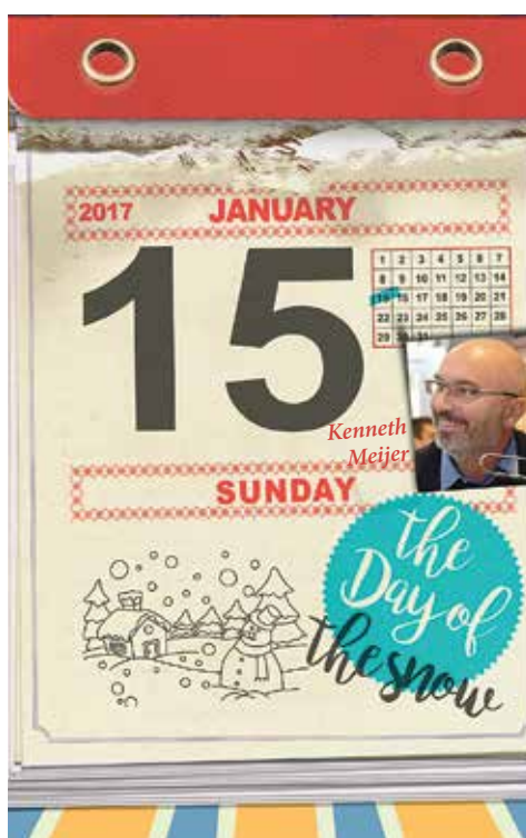
Illustration: Simone Golob

Fortunately, our bodies learn quickly. "During our investigation, we put people on a treadmill that we can set to go in various directions and turn in three different ways. In this way, we disrupt their walking process to see how they react. In the beginning, they lose their balance, but as time goes on, they adapt. Something changes in their system – we don't know exactly what – that enables them to cope with the disruption better."