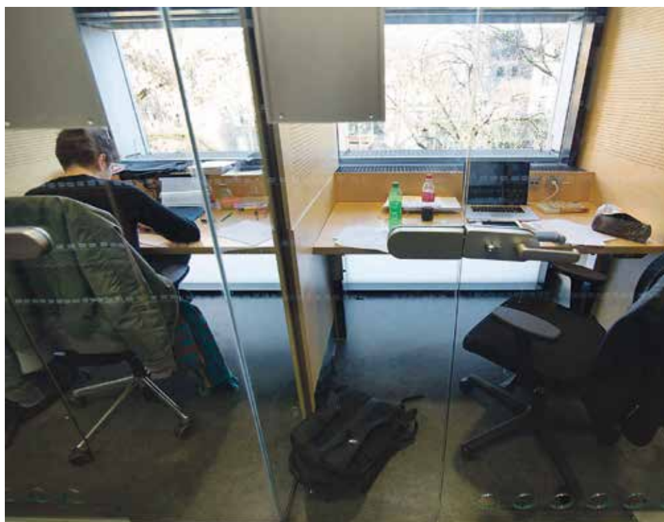
Unnecessarily keeping seats in the workspaces reserved, is the greatest annoyance for approximately a quarter

Observant approached students in the library on the Grote Looiersstraat and in Randwyck. What did that show? Students don't only visit the library just before exams; the majority of the one hundred students questioned go to the University Library at least once a week. Almost half of the respondents are irritated by fellow visitors' behaviour during one out of three visits. Eight per cent – mainly students visiting the Grote Looiersstraat – indicated that they become extremely annoyed during every visit. The survey showed that noisy fellow students are by far the greatest problem (57 per cent). Ingrid Wijk, director of the University Library: "At the inner-city location, we have introduced a colour system for every room, based on a suggestion from students. Red means silence. Orange means working, but talking is allowed (but no telephone calls). Green indicates a group setting with tables where discussions may take place. Three weeks before the exams, we change the colours and the focus is more on self-study and so more quietness." Unnecessarily keeping workspaces reserved irritates approximately a quarter. An irritation that is twice as common in the city centre. Wijk refers to the so-called break discs (that can be used to indicate when you left and when you will be back) that are used in Randwyck. They have been abolished in the city centre, "because some people abused them and there was a fuss if