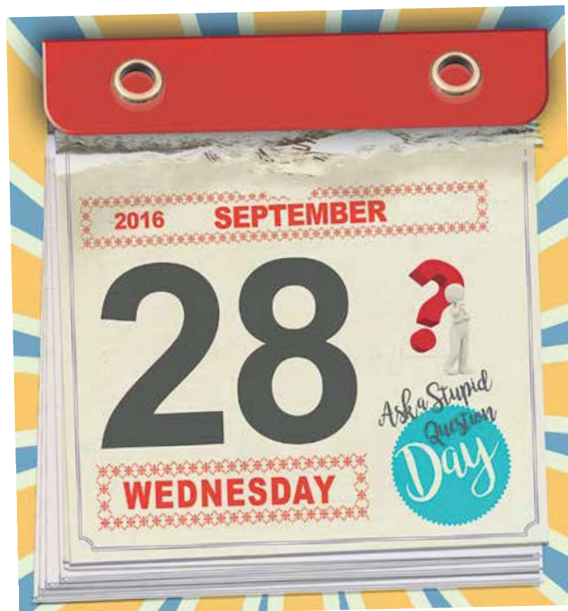
Illustration: Simone Golob

In the category of strange questions: "Did you find my tooth?" The person in question appeared to have lost a denture with an artificial tooth. Another striking one: "Have you got any tampons?" and "Do you have a concrete shears?". The latter was asked by someone (hopefully the owner) who wanted to cut