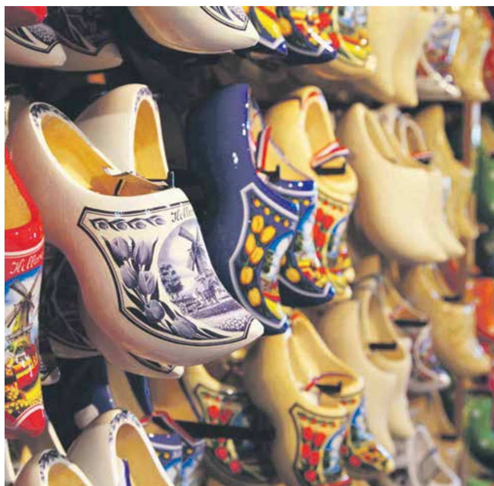
How to 'be' Dutch? Greg Shapiro wrote a book about it, see page 7