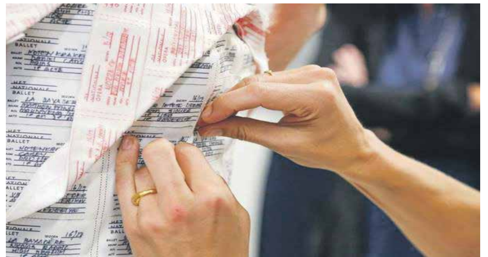
De laatste hand wordt gelegd aan de jurk van Bussemaker

Studenten van de Amsterdamse Meesteropleiding Coupeur hebben dit jaar de Prinsjesdag-outfit van minister Bussemaker in elkaar gezet. De jurk en hoed zijn geïnspireerd door kledinglabels aan de kostuums van operazangers en balletdansers.