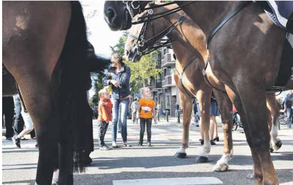
Children watching the 'Prinsjesdag' parade in The Hague

Science was not mentioned either, or at most in the form of innovation: "The consequences of climate change require substantial investments and innovations in sustainable energy sources, such as wind, water and sunlight." The government appears to see the need for major investments in energy, sustainability, accessibility and education, but prefers not to contribute too much itself: "The