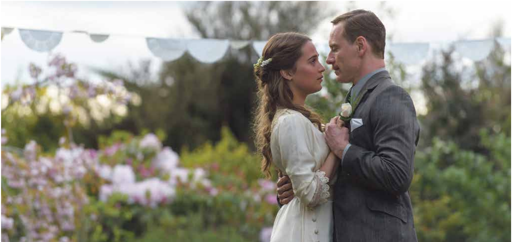
Still uit The Light between Oceans

Na de verschrikkingen van WO I trekt Tom Sherbourne (Michael Fassbender) zich samen met zijn pasgetrouwde vrouw Isabel (Alicia Vikander) terug als vuurtorenwachter op een verlaten eiland. Het enige dat hun prille geluk overschaduwet, is het gemis aan kinderen. En dan spoelt er een bootje aan met daarin een dode man en een nog levende zuigeling. Hoewel het tweetal beseft dat er ergens nog een moeder moet zijn, besluiten ze de baby te houden. Het blijkt een noodlottige beslissing.