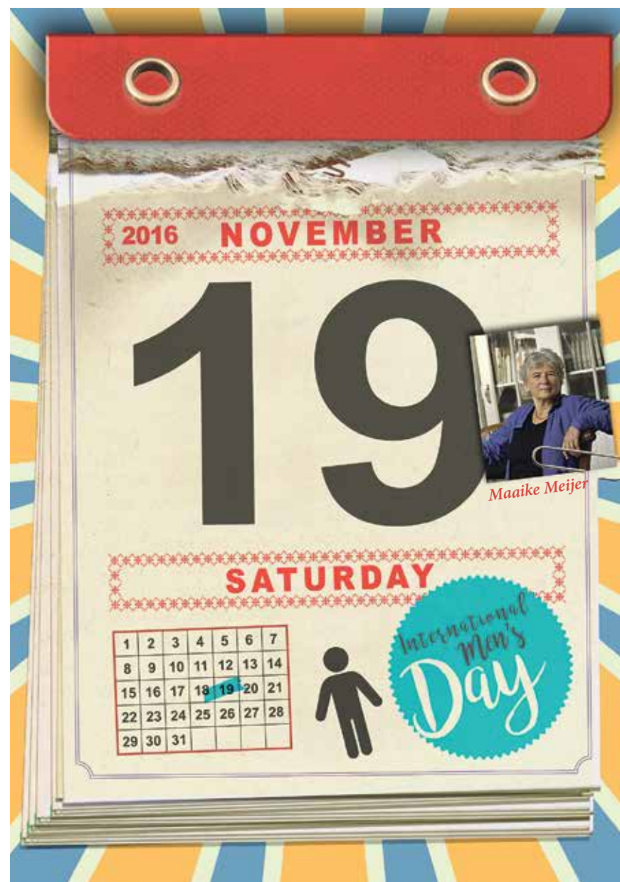
Illustration: Simone Golob

"I wouldn't go as far as to say that society is more feminine today," Meijer continues. "I think that it is more a case of gender roles having become less compelling. That makes everyone more free. I don't think that because of that, men these days are going through a collective identity crisis. Donald Trump's sexism, for example, is a constrained reaction by a group of men who feel threatened. It's unpleasant, but nothing more than a spasm. I think that men feel threatened more often in life; they think that they have to prove themselves. Because boys distance themselves sooner from their mothers more quickly than girls, and because fathers in the past were absent more often – something that is fortunately becoming less matter-of-course – boys usually