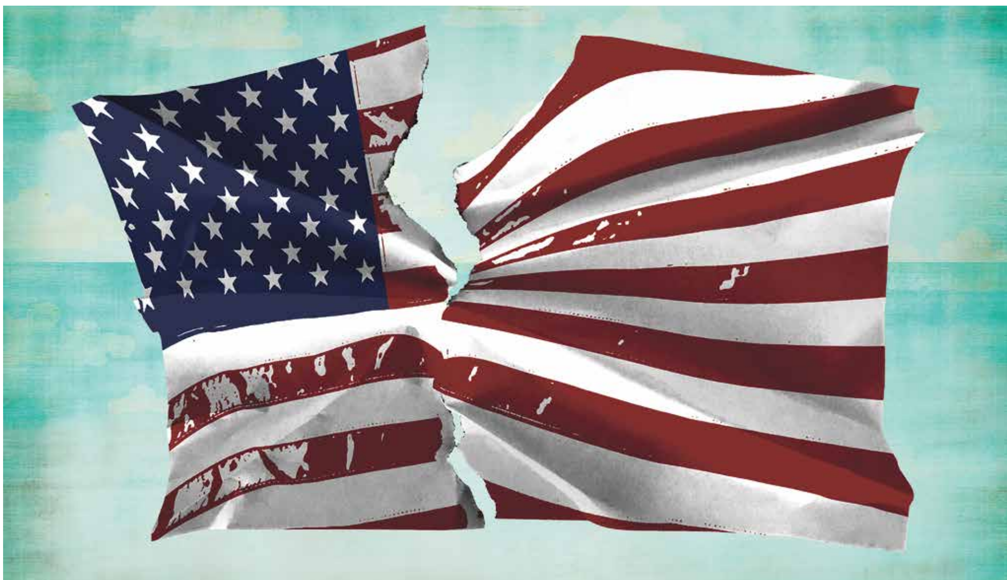
Illustration: Simone Golob

Onafhankelijk weekblad van de Universiteit Maastricht | Redactieadres: Postbus 616 6200 MD Maastricht | Jaargang 37 | 10 november 2016