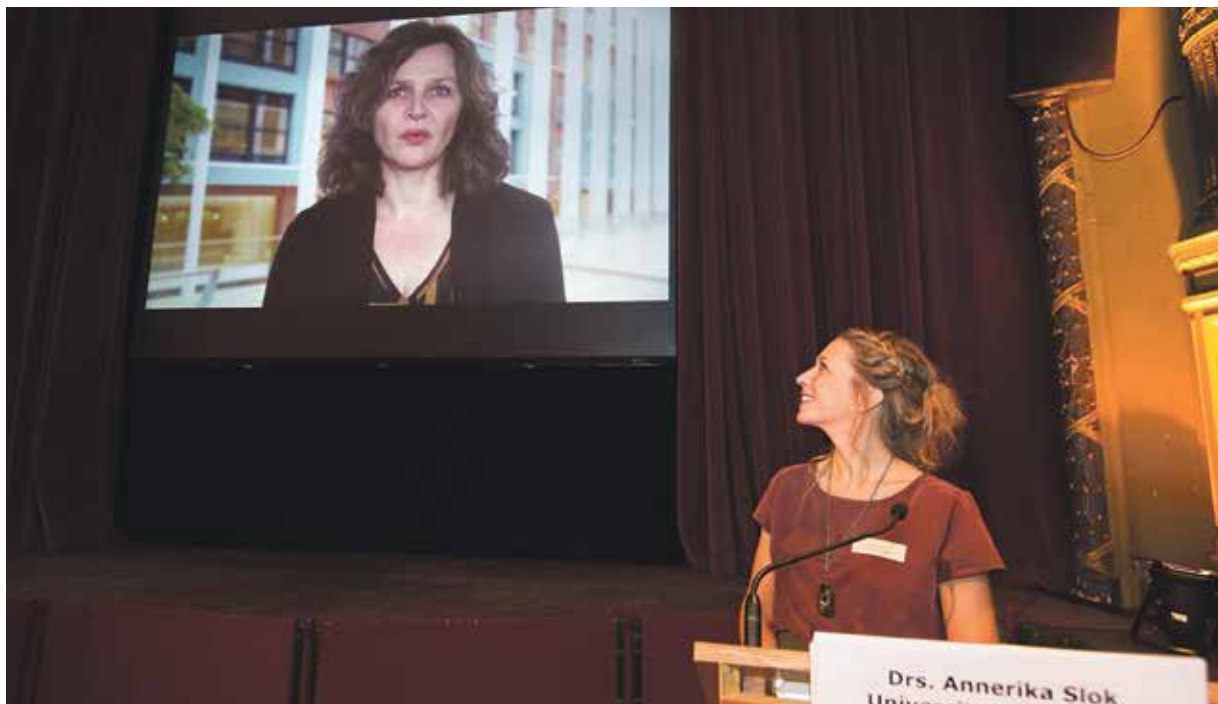
Minister Edith Schippers en promovenda Annerika Slok

Als voorafgaand aan de verdediging van je proefschrift een symposium op poten wordt gezet, dan is er op zijn minst iets speciaals aan de hand. Zeker als ook nog de oud-minister van Volksgezondheid, Ab Klink, komt opdraven en de huidige minister Edith Schippers van te voren een videoboodschap inspreekt.