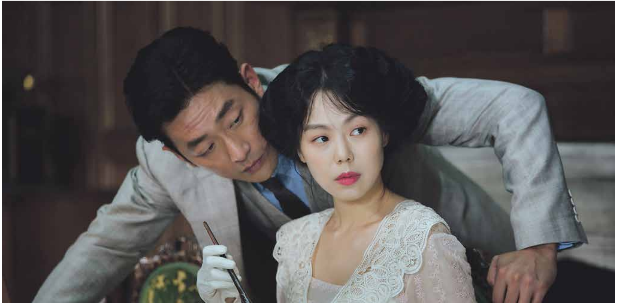
Still uit The Handmaidens

Het verhaal: Korea, de jaren dertig van de vorige eeuw. De jonge Sookee (Kim Tae-ri) is aangenaam als dienstmeisje door Hideko (Kim Min-hee), een Japanse erfgename die al jarenlang onder de knoet gehouden wordt door een perverse oom (Jo Jin-woong) die met haar wil trouwen. Ook het dienstmeisje heeft snode plannen met haar bazin: zij speelt onder één hoedje met een meesteroplichter die van plan is om Hideko tot een huwelijk te verleiden. Maar dan blijken Sookee en Hideko zich seksueel tot elkaar aangetrokken te voelen, en dreigt het hele plan in duigen te vallen.