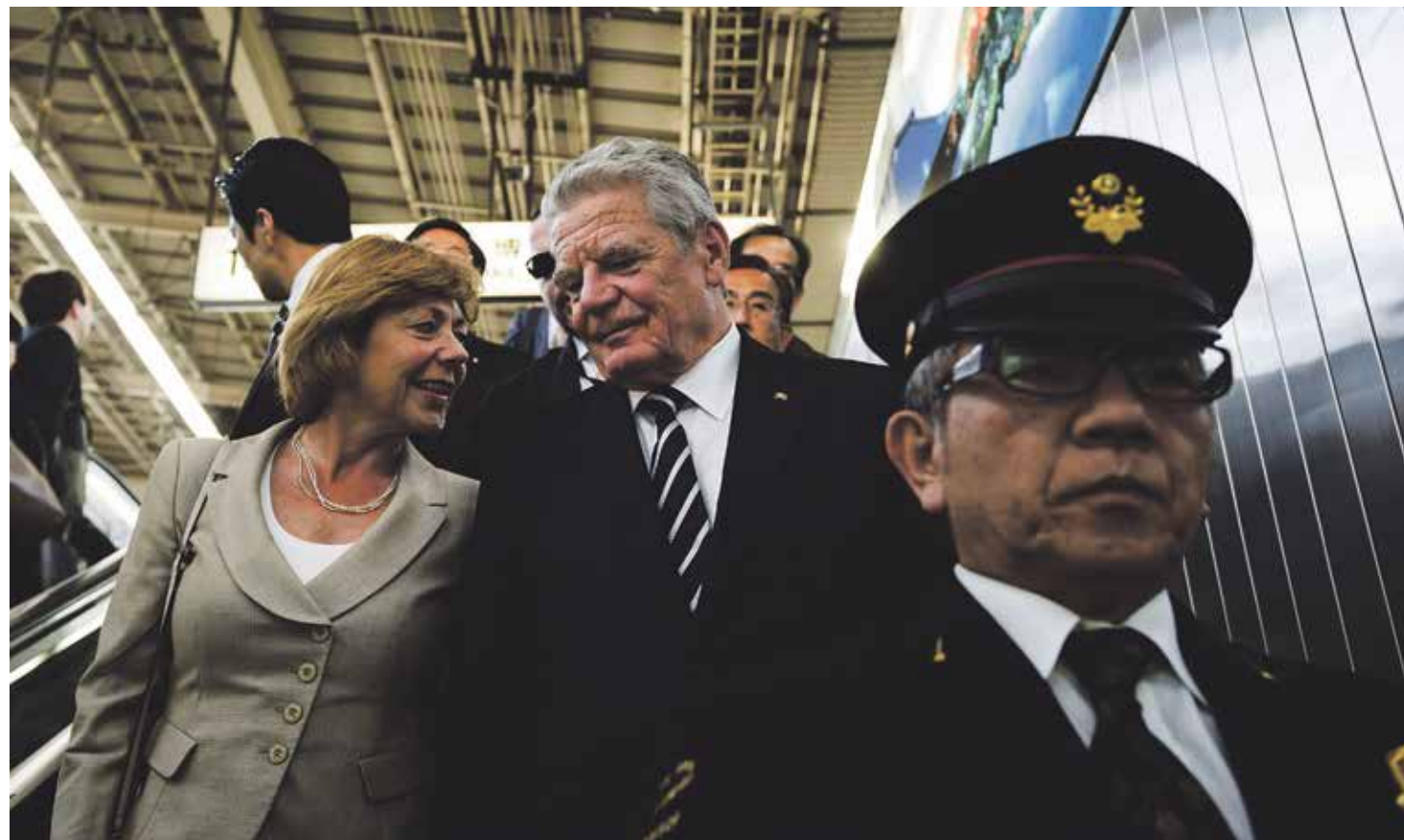
Joachim Gauck and Daniela Schadt

For the Gauck family, the experience was a watershed. From then on it was the family against the system. "We are the decent people, not them", Gauck describes how he felt at the time. Naturally,