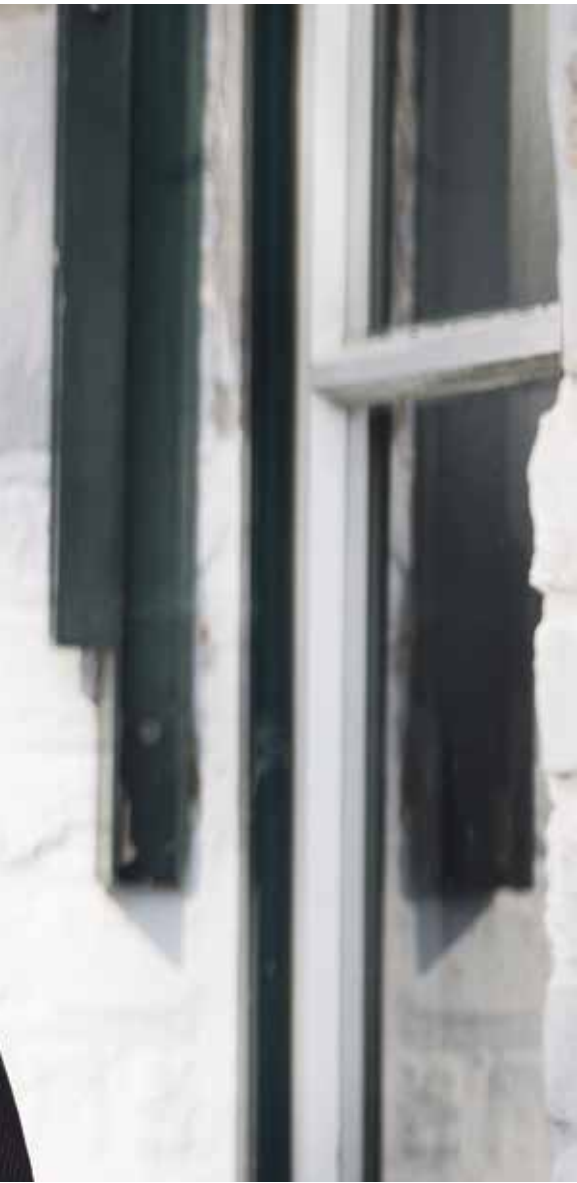
erden van het UCM zijn legendarisch