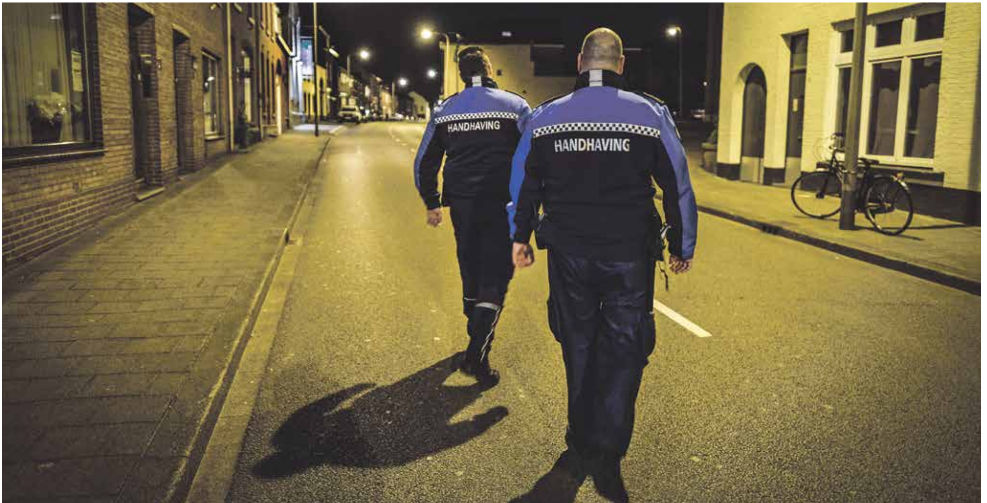
Two special investigators are on patrol on a street in Heer to reduce noise disturbance

Onafhankelijk weekblad van de Universiteit Maastricht | Redactieadres: Postbus 616 6200 MD Maastricht | Jaargang 37 | 30 maart 2017