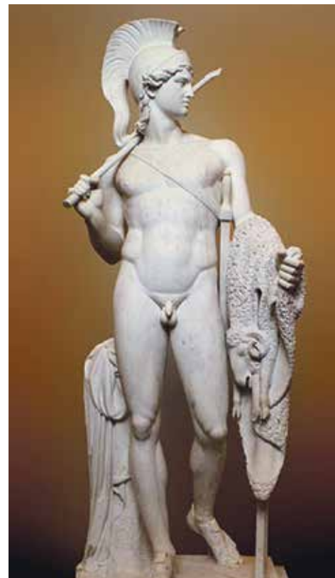
Jason en het Gulden Vlies

serie bloedstollende avonturen met buitenissige creaturen, variërend van sexy moordenaressen tot krijsende Harpijen die met hun welgemikte uitwerpselen ieders eten bezoedelen, komt Jason bij het felbegeerde object en zijn monsterlijke bewaker. Daar legt hij bijna alsnog het loodje, maar gelukkig valt hij in de smaak bij de plaatselijke koningsdochter, Medea genaamd. Ze is een tovenaars en zo verzot op Jason dat ze in ruil voor een huwelijk bereid is om alles en iedereen, desnoods haar eigen familieleden, uit de weg te ruimen. Om maar met Jason en het Vlies te kunnen ontsnappen, hakt ze zelfs haar broertje in stukken. Later, in Griekenland, eindigt ook de koning van Iolkos door haar toedoen in mootjes. Hierop moeten Jason en Medea vluchten. Als een soort Bonnie and Clyde zwerft het stel langs de Griekse stadstaten. Inmiddels heeft Jason zijn carrière doelen verlegd naar het koningschap van Korinthe. Dat kan hij krijgen door prinses Creüsa te huwen en dus zet hij Medea aan de kant. Dat is niet alleen ondankbaar van hem, maar ook onverstandig. Hij is echter zo verblind door zijn nietsontziende ambitie dat hij geen gevaar ziet en pas bij zinnen komt als Medea zowel Creüsa en haar vader alsook Jason's en Medea's beide zoontjes heeft vermoord.