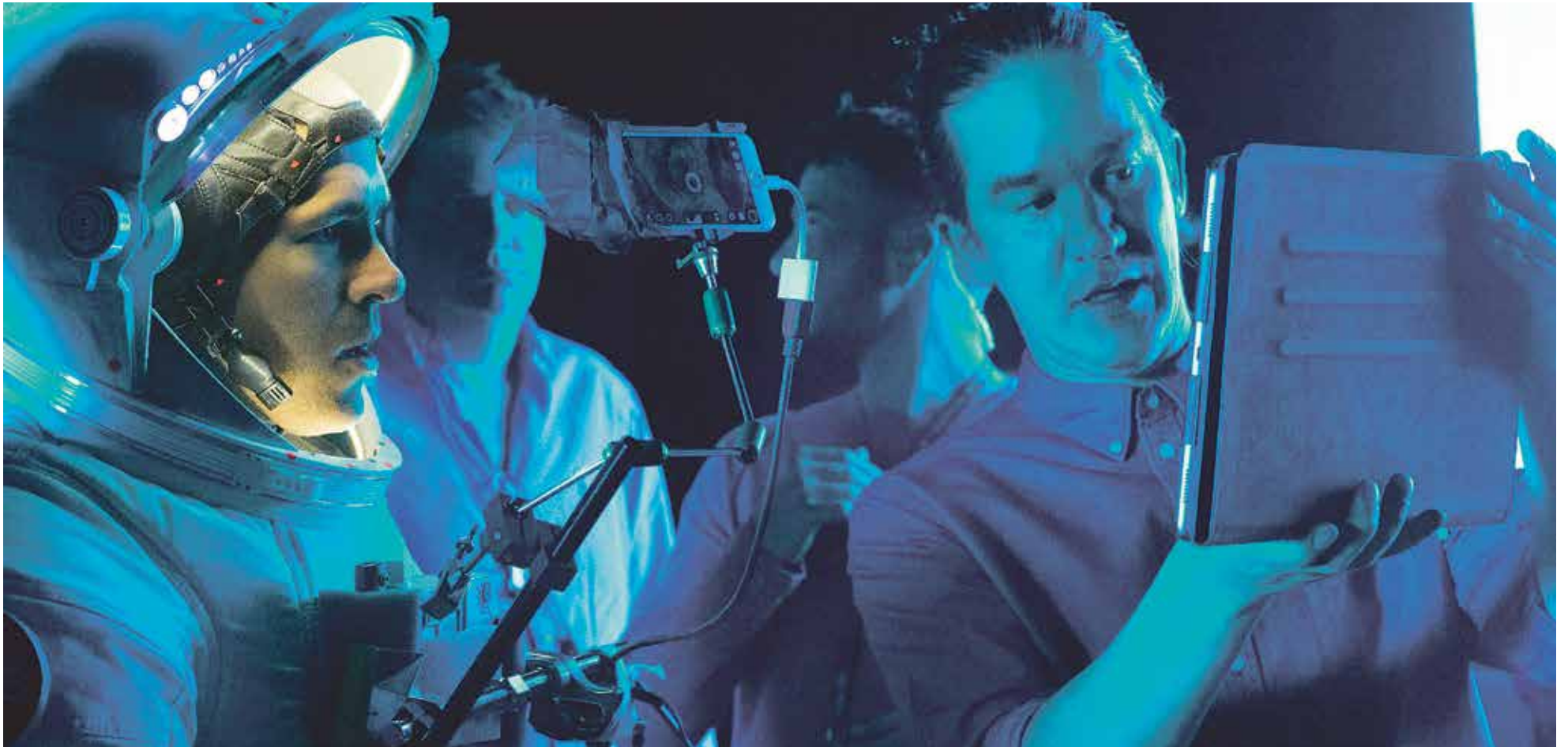
Still uit Life

Het verhaal: Op een internationaal ruimtestation onderzoeken zes astronauten grondmonsters van Mars. Daar blijkt leven in te zitten. De bemanning is aanvankelijk laaiend enthousiast, totdat blijkt dat het ruimtewezen naast intelligent vooral ook dodelijk is.