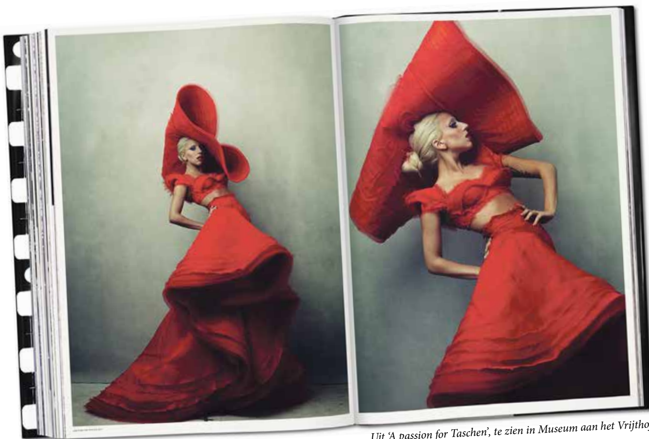
Uit 'A passion for Taschen', te zien in Museum aan het Vrijthof

Van de glijbaan in het Bonnefantenmuseum, playbacken als Elvis of dansen op nachtelijke natuurgeluiden. Het kan allemaal tijdens de Maastrichtse Museumnacht op vrijdag 7 april. Dertien kunstinstellingen openen hun deuren gedurende de avond. Na 1.00 uur kunnen de bezoekers naar de Muziekgieterij voor de afterparty. "Het is een kans om Maastricht beter te leren kennen, te ontdekken wat hier allemaal te doen is. En om te laten zien dat musea geen saaie stille