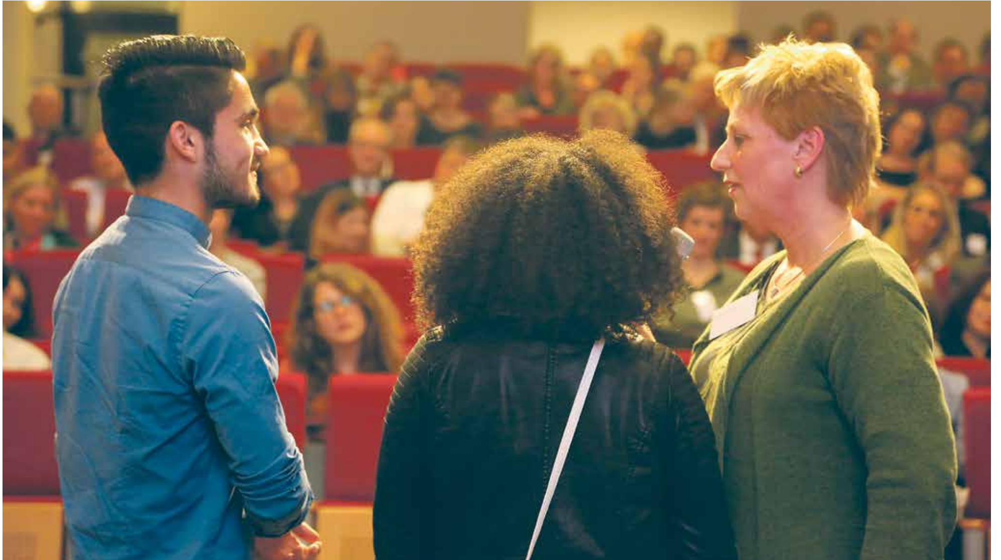
De internationale schakelklas stelt zich voor

Hoeveel van de vierhonderd inburgeraars bij ROC Leeuwenborgh kunnen niet lezen en schrijven? Hoe lang duurt het inburgeringstraject van laagopgeleide vluchtelingen voordat ze examen mogen doen?* In de aula van de Minderbroedersberg verzamelden zich maandagavond verschillende organisaties uit de regio die gezamenlijk werken aan de integratie van vluchtelingen. Wat hebben zij tot nu toe bereikt?