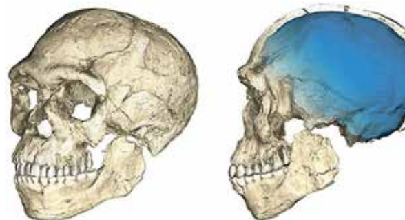
Homo sapiens schedel Marokko