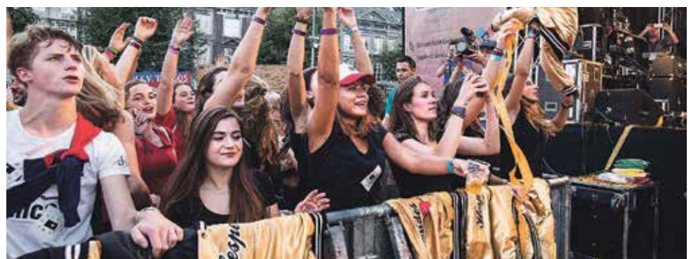
Students at the opening of the Inkom last year