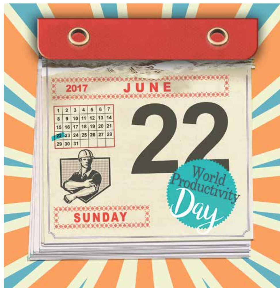
Illustration: Simone Golob

2. Avoid social media. It is not so much the distraction of Instagram, WhatsApp and Facebook that is detrimental to your concentration, it is the jealousy that they cause. "Some of my friends have already finished. They are now all sitting around drinking beer, that really sucks."