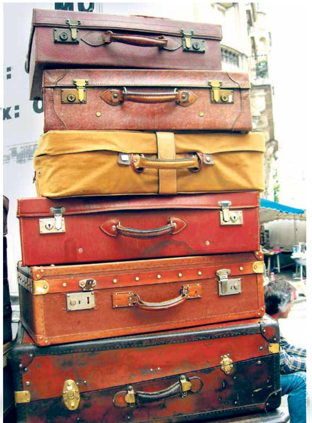
Have a nice holiday, travel light!

Overigens betekent invoering van dit principe een forse breuk met het verleden. Geen enkele eerdere collegevoorzitter had benoemd kunnen