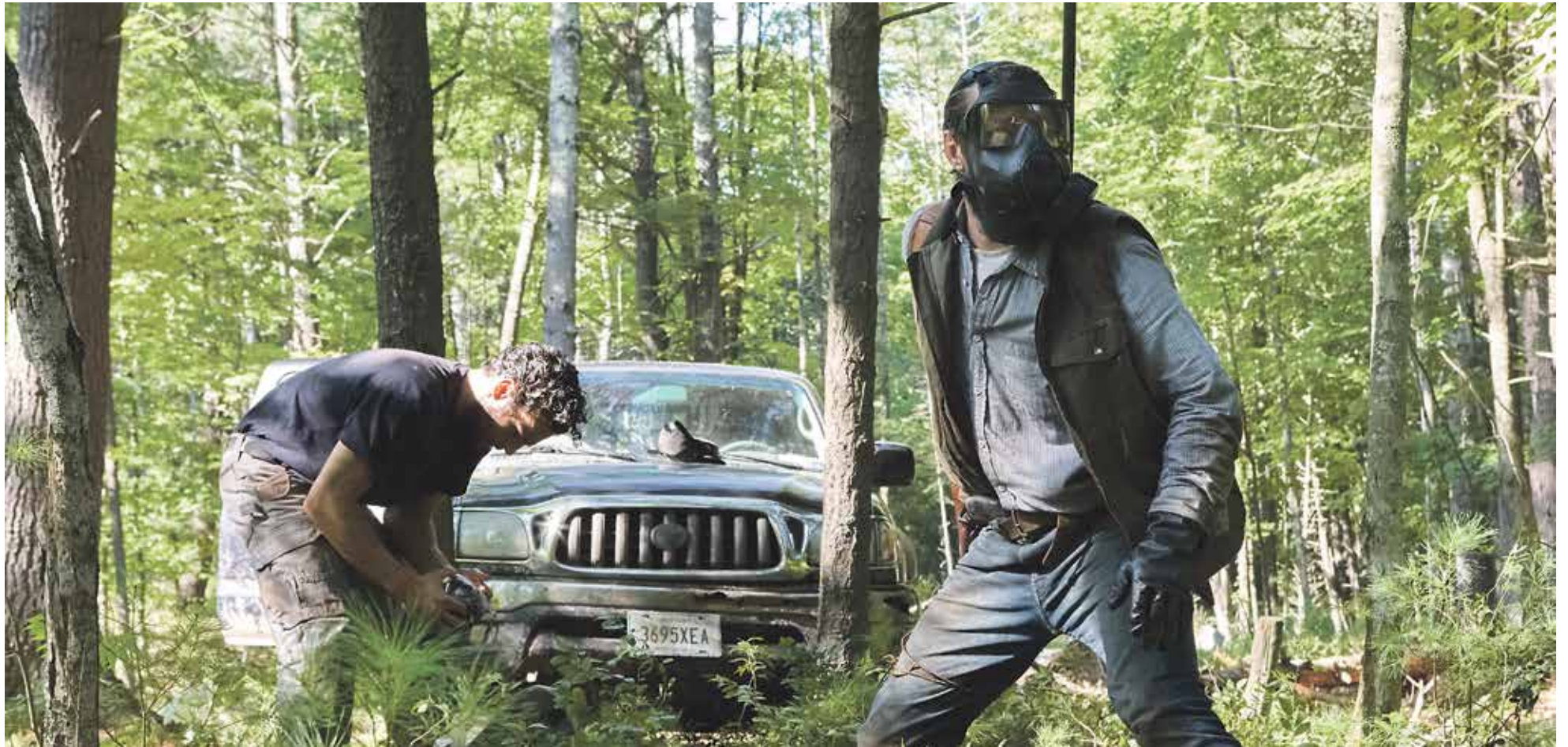
Still uit It Comes At Night

Het verhaal: Paul (Joel Edgerton) heeft zich met zijn vrouw Sarah (Carmen Ejogo) en hun 17-jarige zoon Travis (Kelvin Harrison Jr.) verschanst in een volledig met plastic afgeplakte hut ergens in de Amerikaanse bossen. Buiten heeft zich een ramp voltrokken en bedreigt een dodelijk virus de mensheid. Hun toch al precarie situatie wordt nog onzekerder als zich 's nachts een indringer aandient. Deze Will (Christopher Abbott) claimt op zoek te zijn naar water en voedsel voor zijn vrouw Kim (Riley Keough) en hun zoontje Andrew. Paul besluit het gezin onderdak te bieden, maar kan hij deze vreemdelingen vertrouwen?