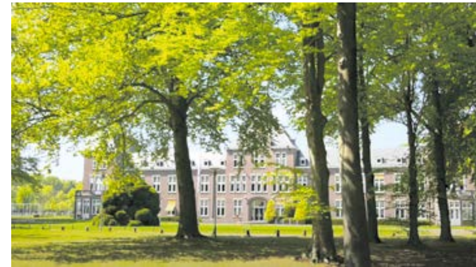
GGZ