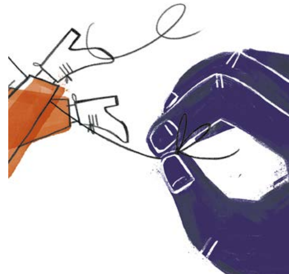
Illustratie: Janneke Swinkels

Ook aan de UM loopt een onderzoek. Na de eerste verkenningen van de ombudsfunctionaris heeft het college van bestuur een extern bureau in de arm genomen, zegt woordvoerder Koen Augustijn. Het bureau, Bing, gespecialiseerd in integriteitskwesties, zal onder meer interviews houden met mensen die in de afgelopen jaren met Marcelis hebben samengewerkt.