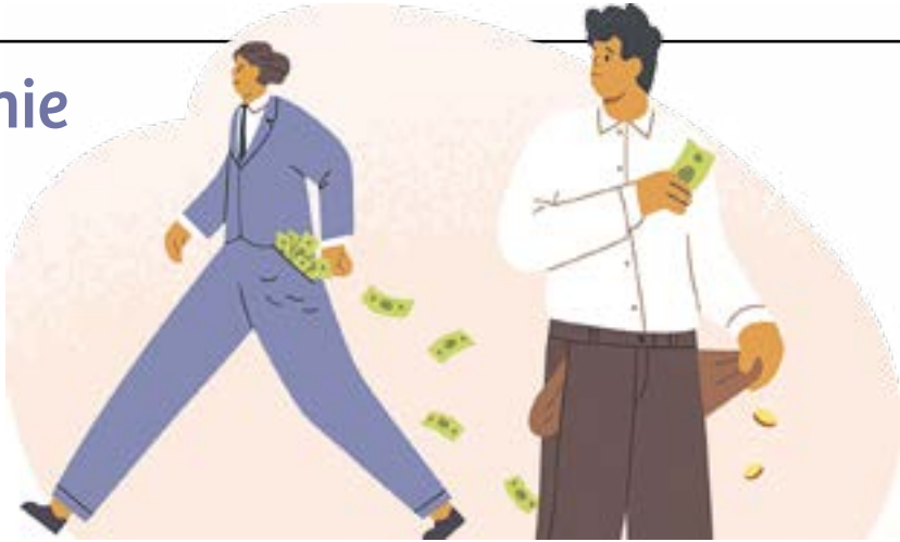
Illustratie: GoodStudio, Shutterstock

Er zijn collega's die vóór hun dienst bij de UM eerst de krant rondbrengen of in de weekenden elders een centje bijverdienen.