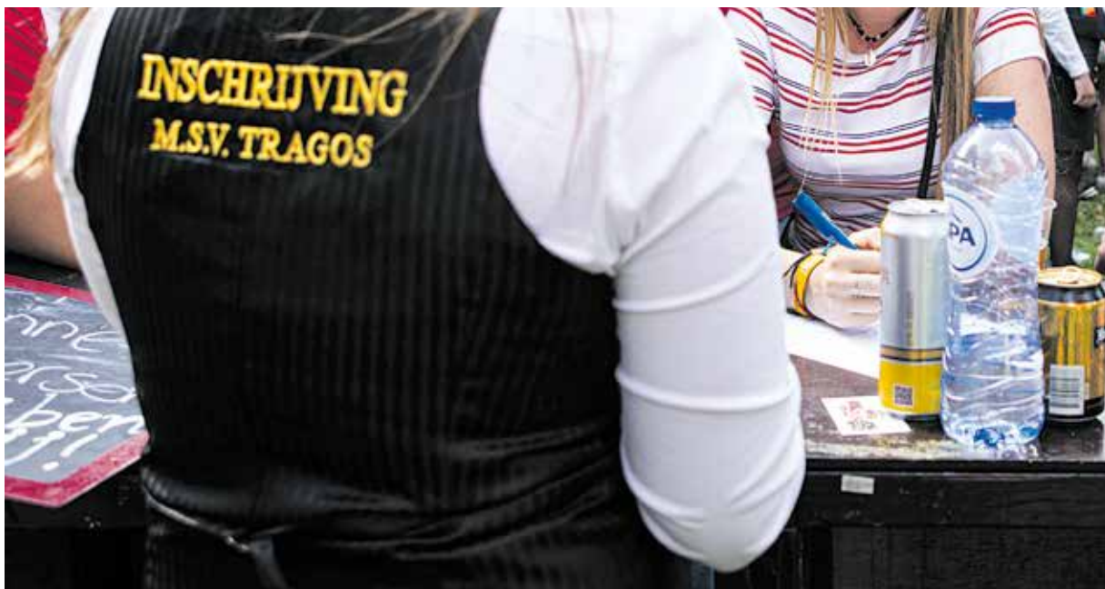
De inschrijftafel van Tragos tijdens de INKOM 2019