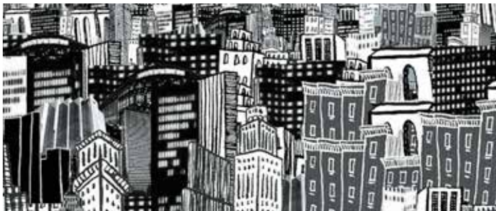
Illustratie: Simone Golob

in opleiding, zou de man andere artsen hebben gemobiliseerd om Marcelis zwart te maken. “Dit onfris gedrag raakt aan wat we ook wel stalking noemen”, zegt Van Os.