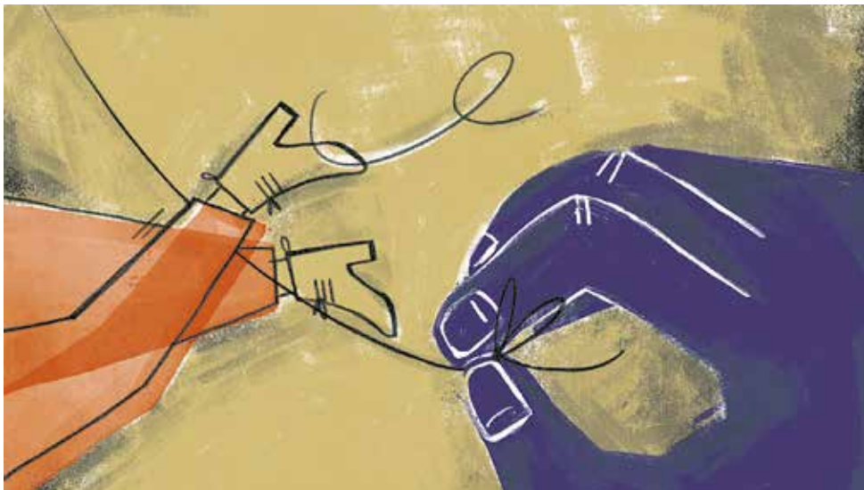
Illustratie: Janneke Swinkels

UM-hoogleraar psychiatrie en opleider Machteld Marcelis kwam afgelopen weken onder vuur te liggen nadat huidige en voormalige artsen in opleiding een klacht tegen haar hadden ingediend over