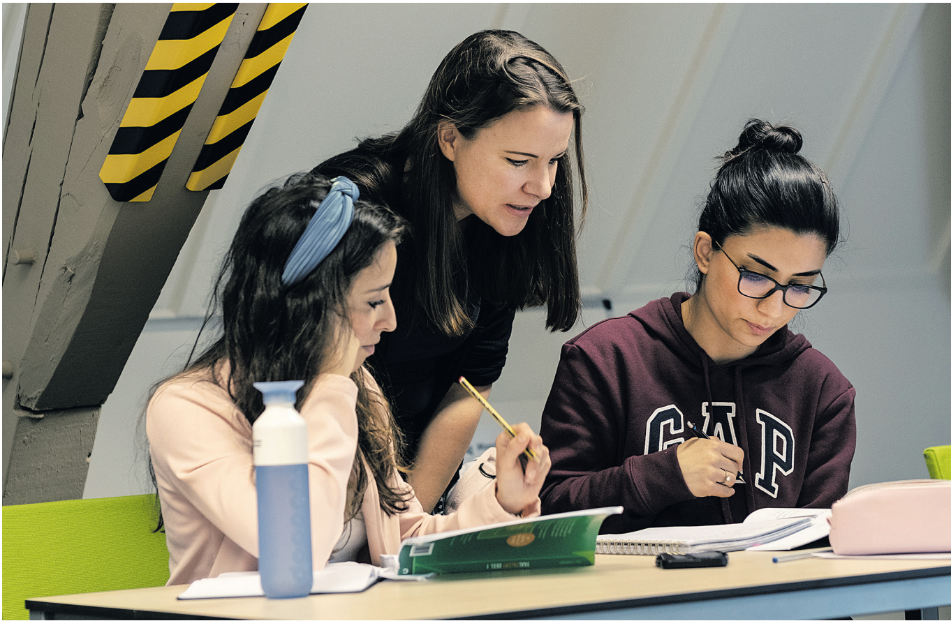
Studenten tijdens de Nederlandse les bij het UM-Talencentrum