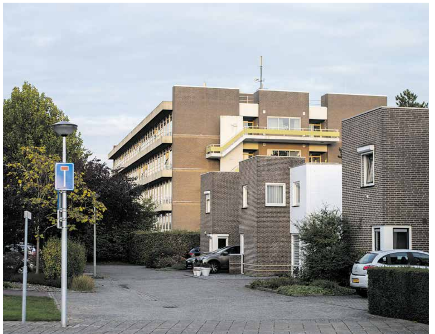
De huizen vlak bij het M-gebouw (het achterste gebouw) op de Annadalcampus

In het mailsysteem reageert Xior dat er niets is veranderd aan de apparatuur en dat ze pas iets gaan doen "als er een apparaat kapot is en dat is nu niet het geval". Observant deed meerdere pogingen om Xior zelf te spreken, maar tot nu toe zonder resultaat. YM