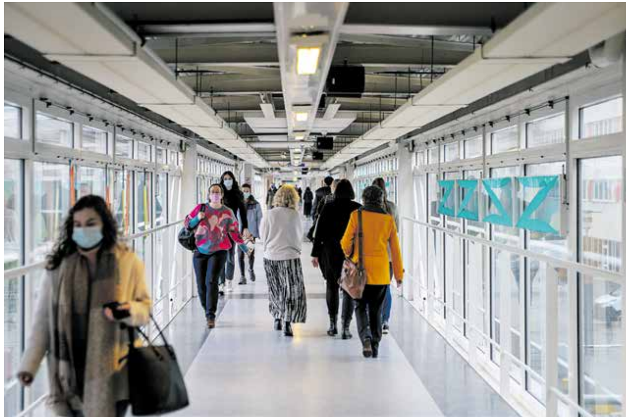
Randwyck in januari 2022

gebouwen looproutes, wordt het dragen van een mondkapje verplicht voor degene die rondloopt, krijgt iedereen het advies om zich preventief te testen, en is thuiswerken weer het advies. Daarnaast zal online-onderwijs waar nodig weer zijn intrede doen (en telt online-deelname nu wel mee in de aanwezigheidsplicht), al blijft 'in person-teaching' het uitgangspunt.