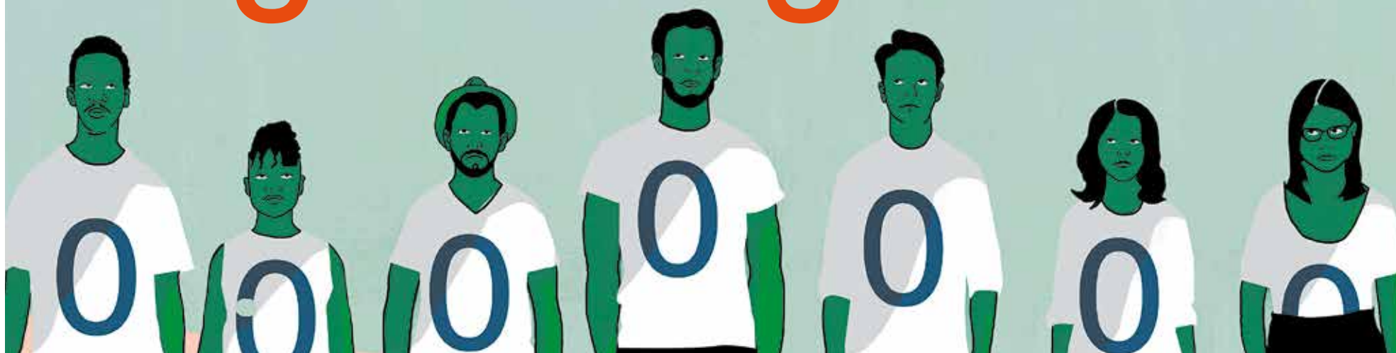
Illustratie: Simone Golob

Een student blikt terug op de ontgroening bij Circumflex in 2016. De vernederingen, het slaapgebrek, honger. En bovenal het geschreeuw: “Op slechts drie centimeter afstand van je oor of met z’n tienden tegelijk: ‘Je bent niets’, ‘je bent niks’, ‘niemand vindt jou aardig hier’, ‘je bent een slechte nul’. En het erge is dat je het ook nog gaat geloven.” P5-6