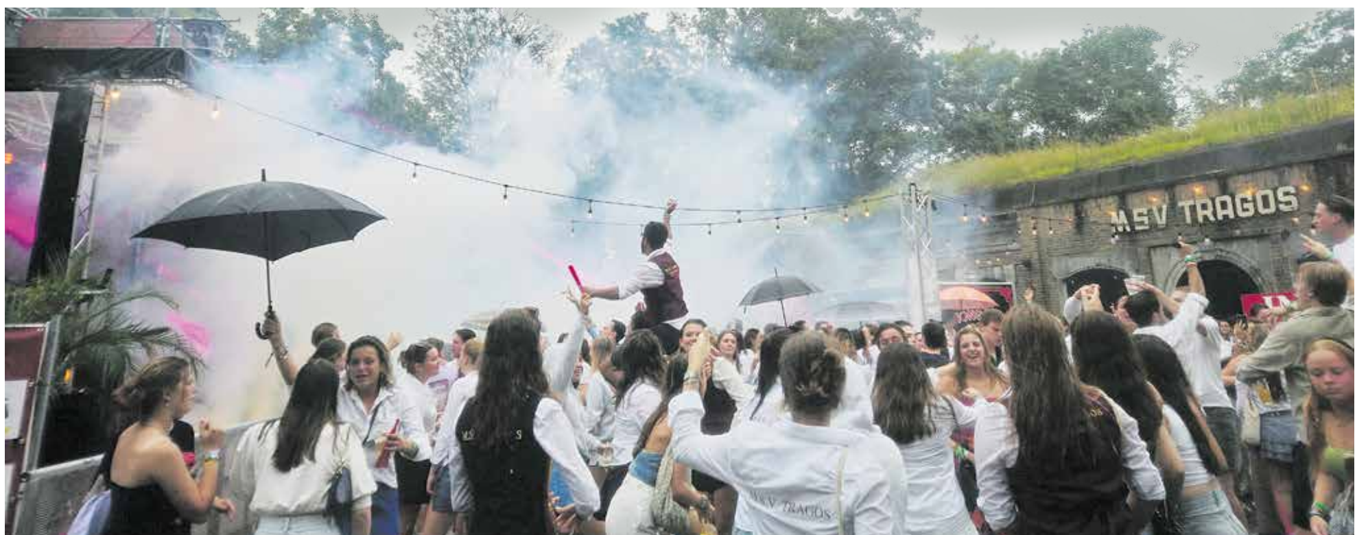
Feest bij Tragos in augustus 2023