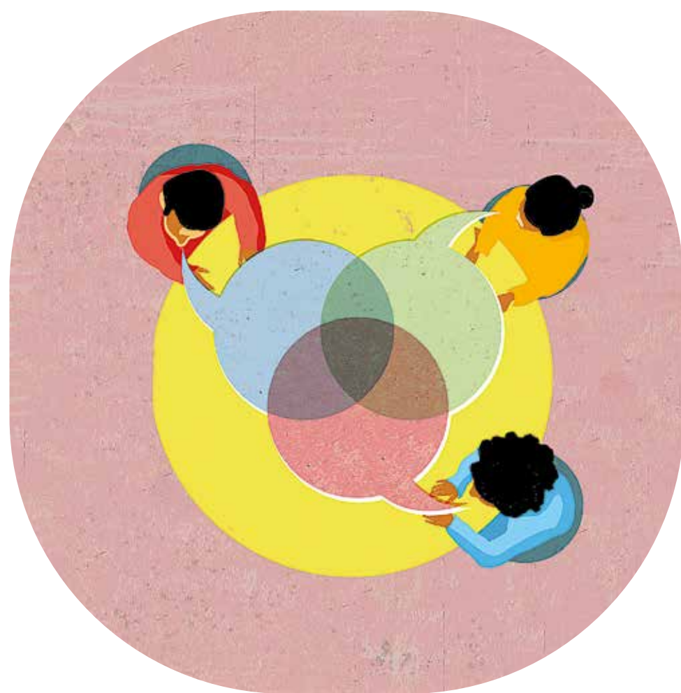
Illustratie: Simone Golob

Hoe kun je garanderen dat het nieuwe dialoogcentrum van de Universiteit Maastricht een "veilige plek" is om je mening te delen?