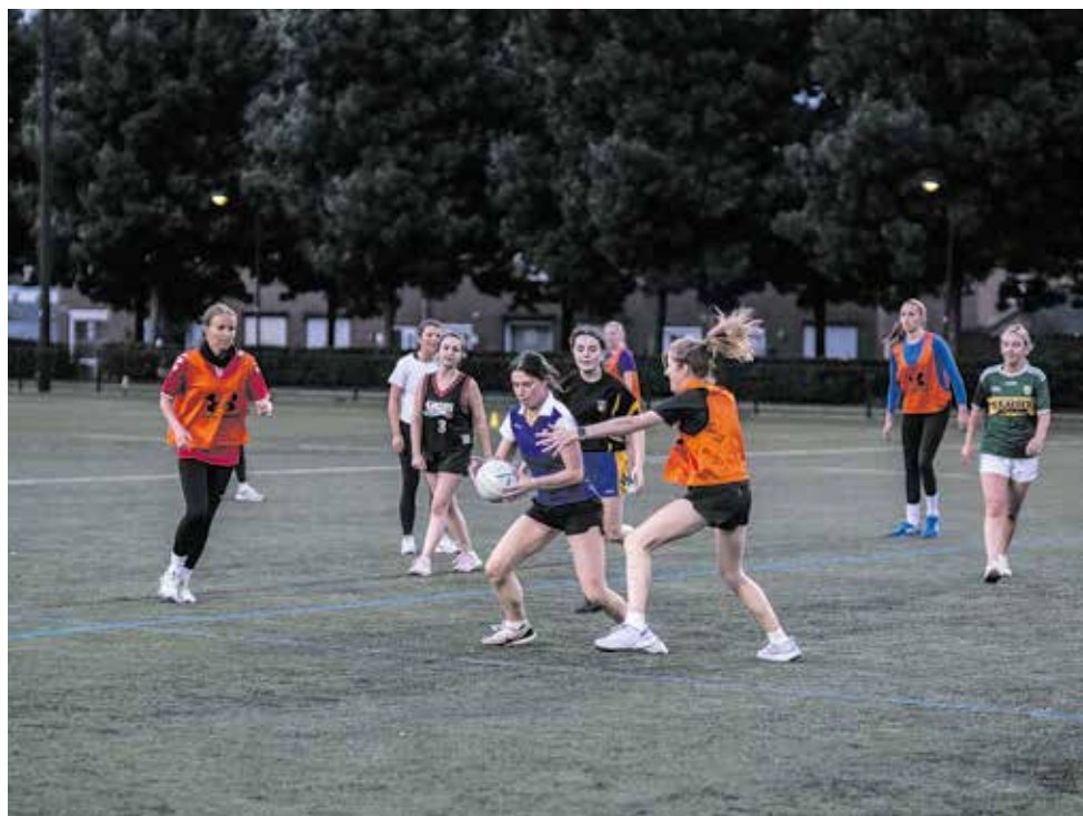
Maastricht Gaels

“Dames, snel een rondje rennen. Eigenlijk moeten jullie er eentje extra lopen”, grijnst trainer Tony Bass tegen een groepje laatkomers. De rest is al samen met de heren begonnen aan de warming up.