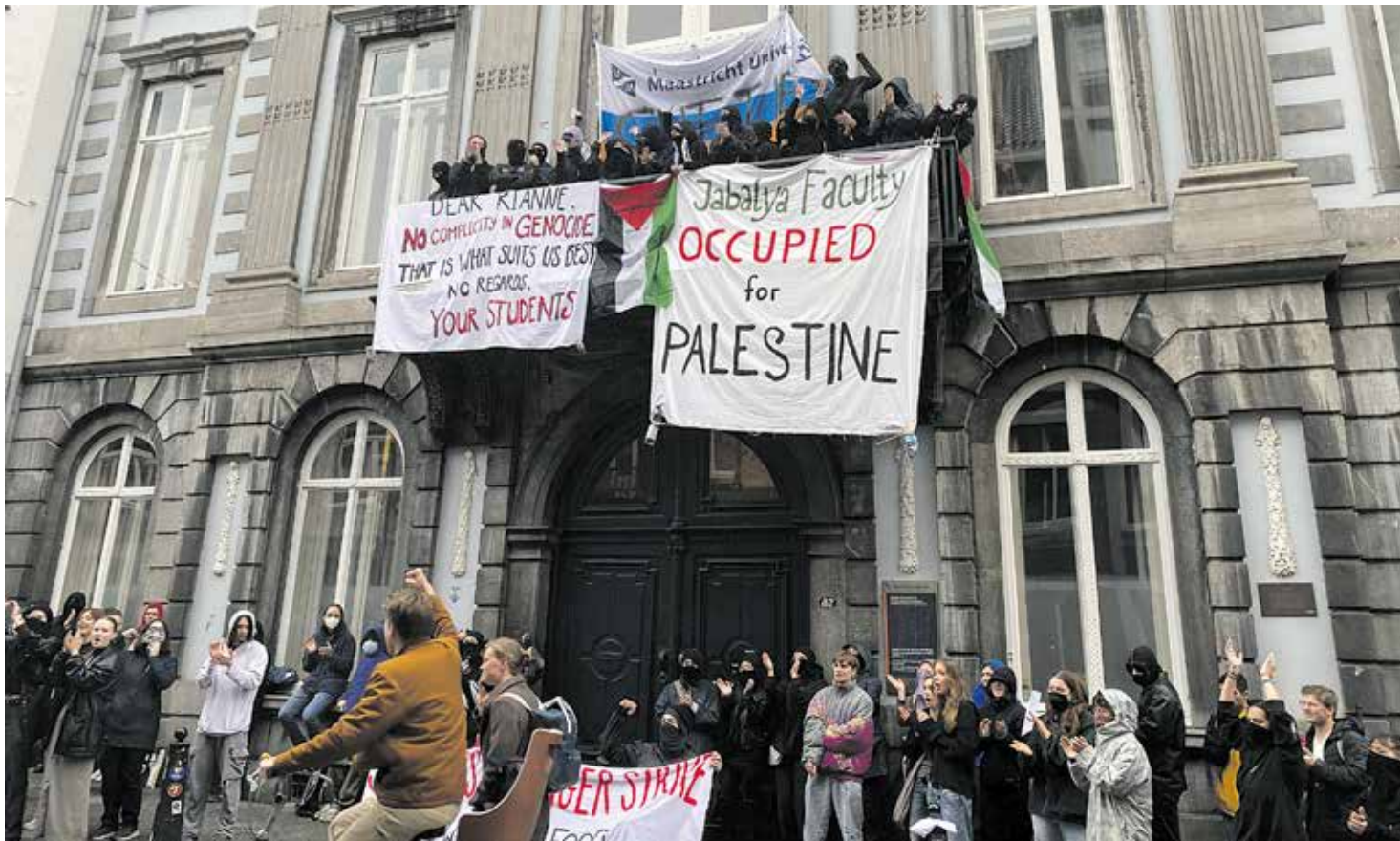
Een voorbijganger moedigt woensdag de protesterende studenten aan