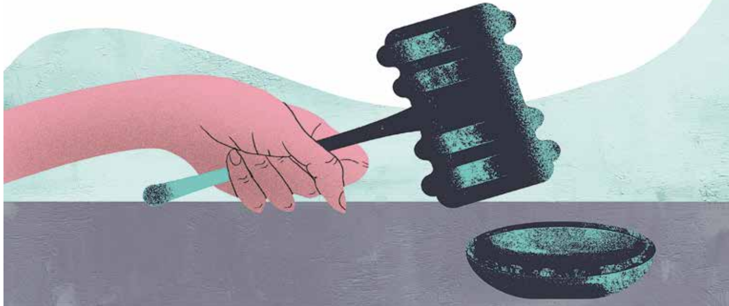
Illustratie: Simone Golob

In juni staat de verdeling van de bestuursmaanden op de agenda van de universiteitsraad. Als studentenvereniging Tragos daarvoor in aanmerking komt, zullen de leden van studentenpartij NovUM niet akkoord gaan. Dat voornemen hebben ze onlangs op Instagram gedeeld. Ze maken zich grote zorgen over de sociale veiligheid binnen Tragos en wensen meer transparantie over hun verbeterplan.