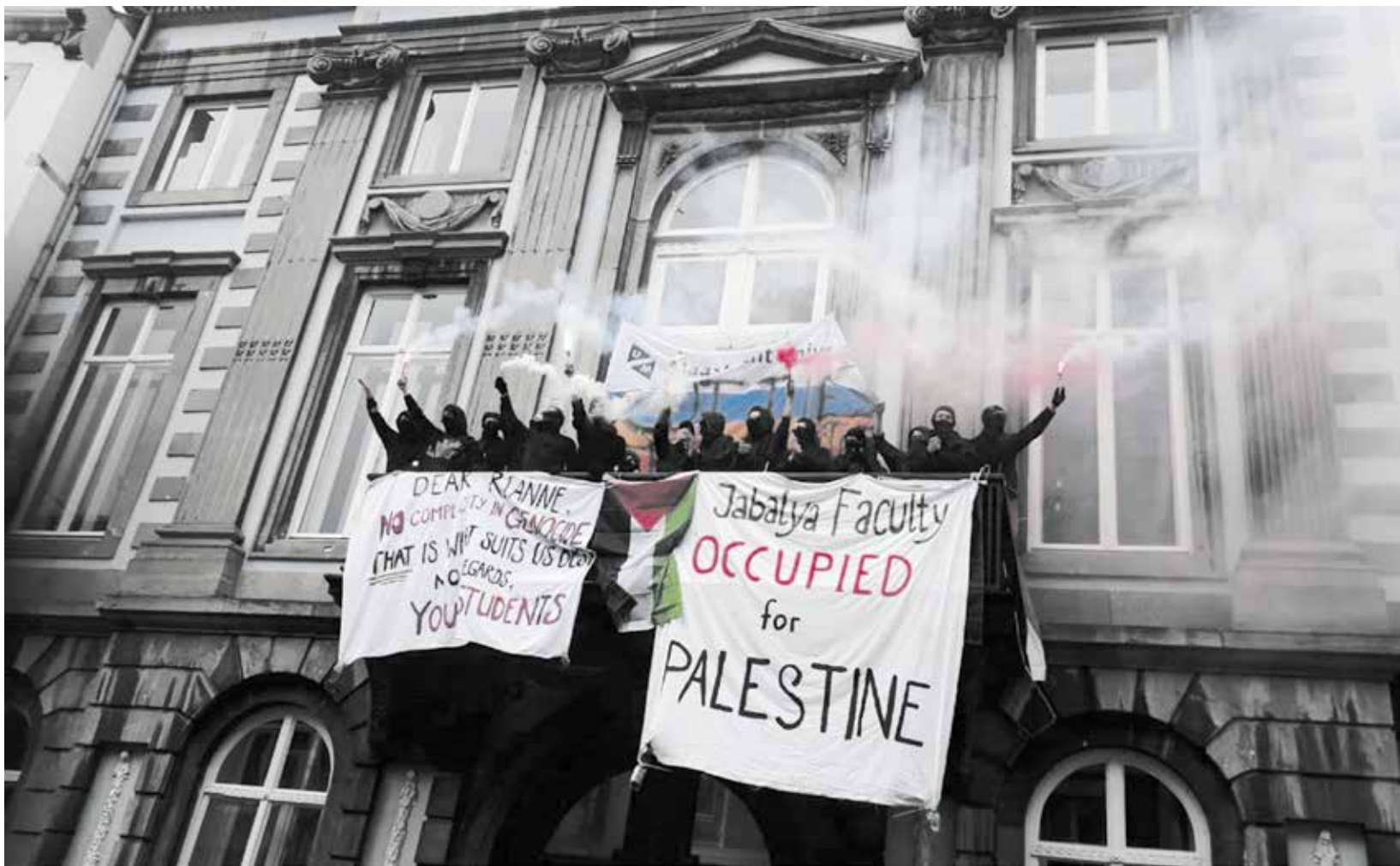
Woensdagmorgen, FASoS-gebouw

Demonstranten voeren de druk op en bezetten universiteitsgebouw