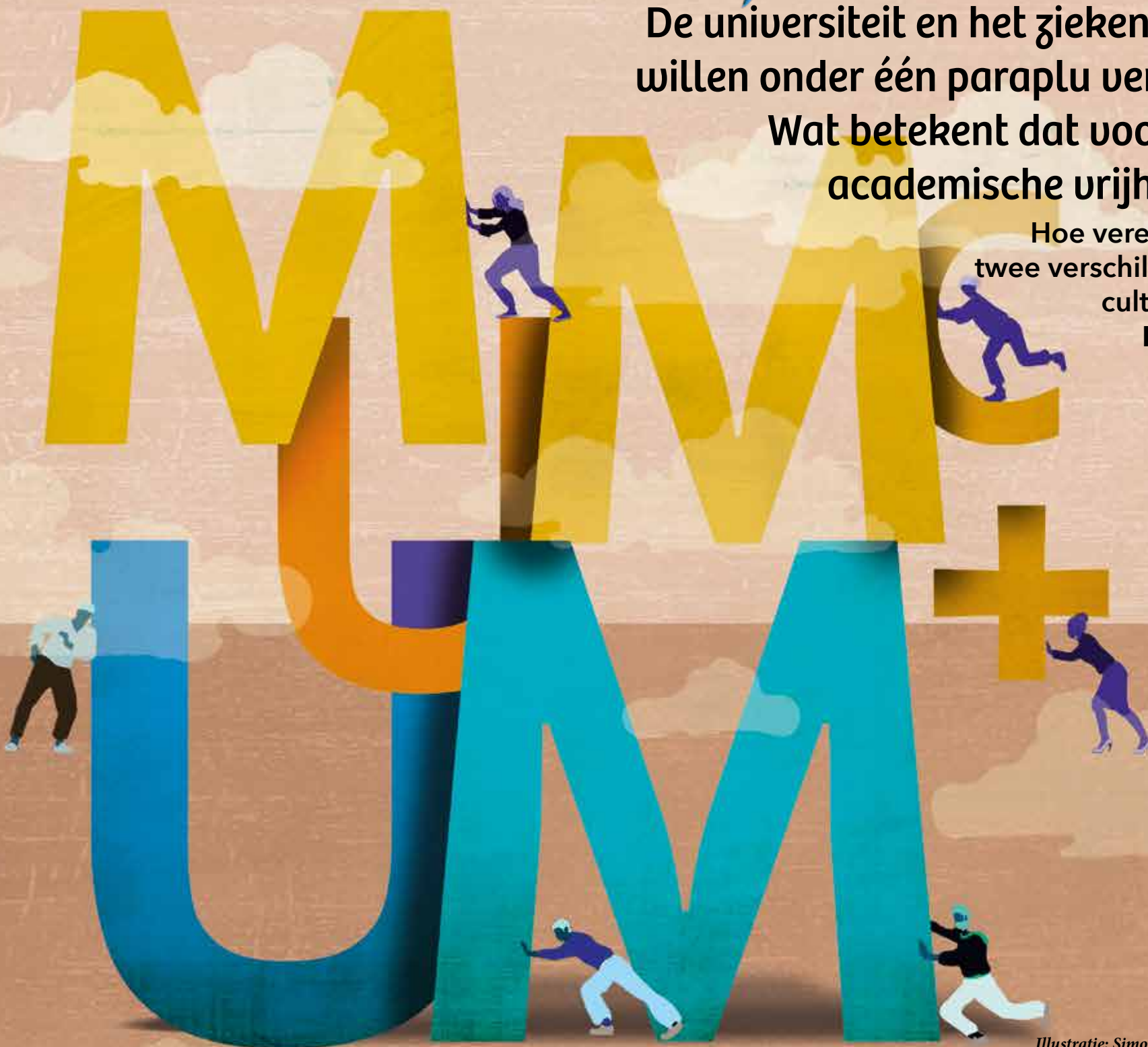
Illustratie: Simone Golob

Een grens is bereikt, meent collegevoorzitter Rianne Letschert