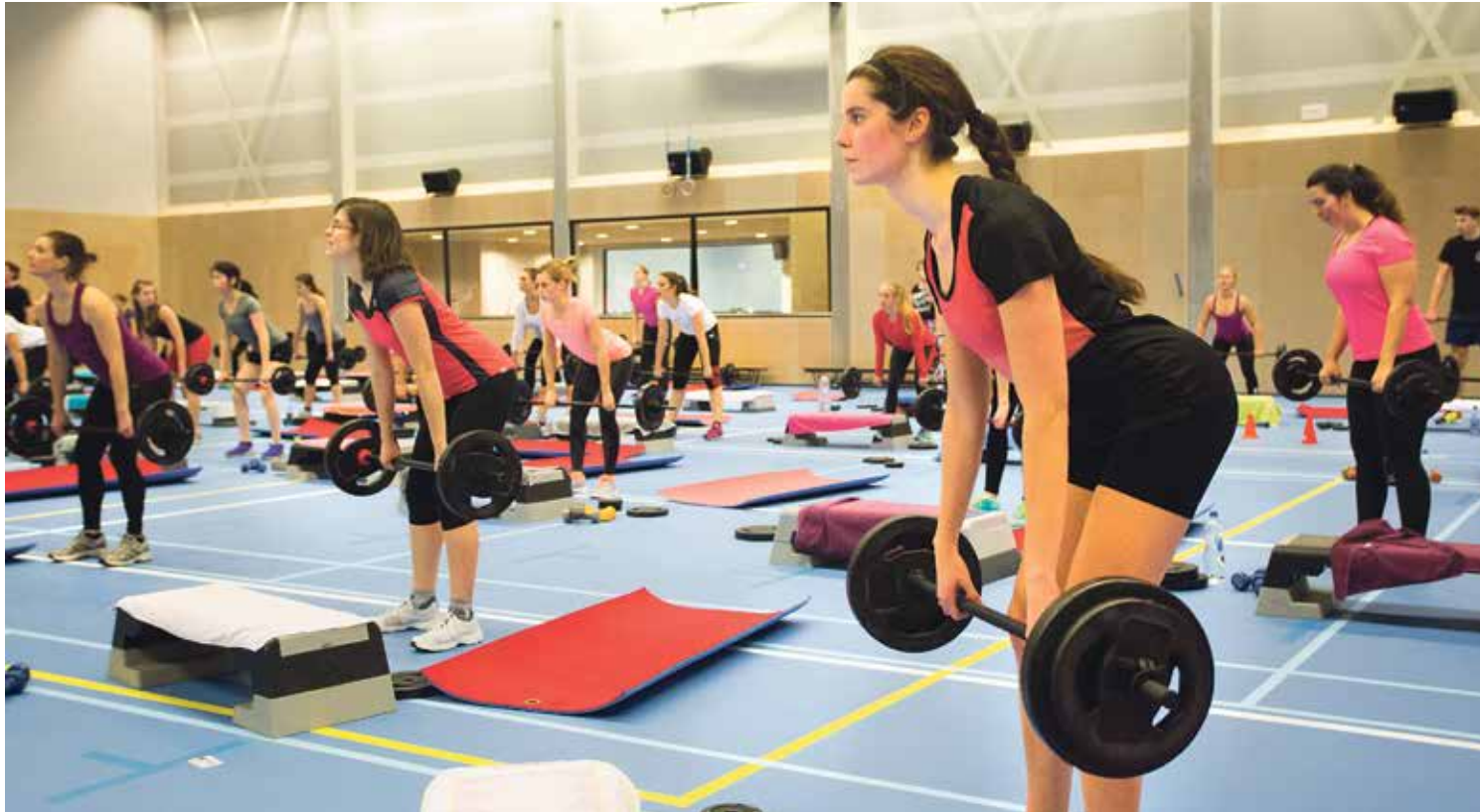
ClubPower in de sporthal

“Feedback wordt slecht gegeven: niet kritisch en vaak onduidelijk en ambigue”, luidt het commentaar van een psychologiestudent in het vrije tekstgedeelte van de enquête. Ook vanuit de faculteit Health, Medicine and Life Sciences klinkt kritiek: “Most of the time we can only see pass/fail on MyUM to see how well we did. The university claims to aim at improving our independent thinking and reasoning, but how can we improve our assignments/academic work if we never get feedback on it?” Bijna de helft van de respondenten is (zeer) ontevreden over de manier waarop resultaten van een toets of paper worden becommentarieerd. De jongste UM Student Monitor werd door 1710 studenten (11,5 procent) ingevuld. Een zeer kleine groep dus, maar wel iets meer dan in academisch jaar 2014-2015. Toen nam slechts 8,4 procent de moeite. De UM stuurt de enquête jaarlijks rond om de tevredenheid onder studenten te polsen. Wat vinden ze van inschrijvingsprocedures voor opleidingen, blokken en tentamens? Is de informatievoorziening op orde, over carrièreperspectieven of bijvoorbeeld masterprogramma’s? En wat vinden ze van de bewegwijzering binnen gebouwen, de hoeveelheid fietsstallingen en de kwaliteit van de mensa’s? Om te beginnen met dat laatste: de universitaire