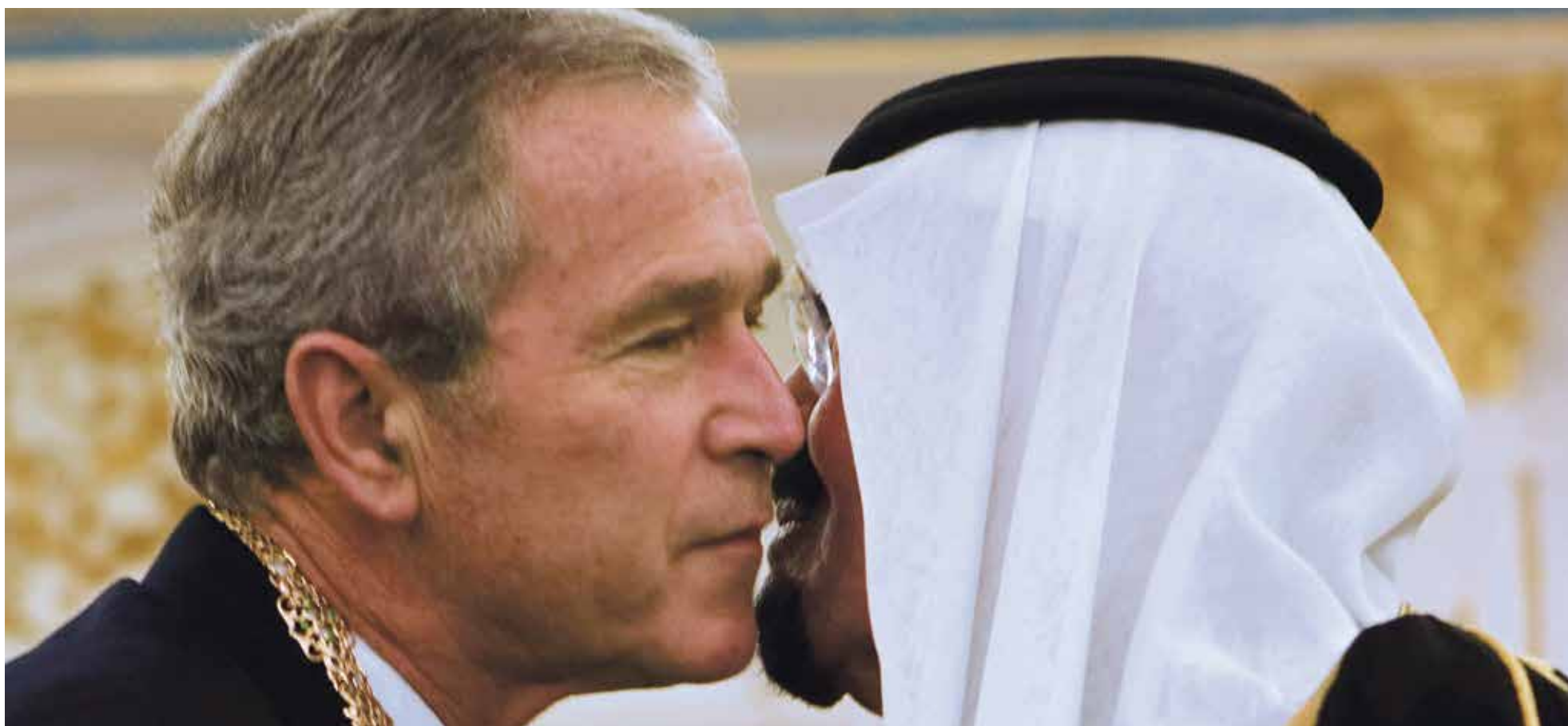
Still uit Shadow World

Het verhaal: In de documentaire Shadow world doen onderzoeksjournalisten, wapenhandelaars, militairen, lobbyisten en andere experts een boekje open over de wereld van de internationale wapenhandel.