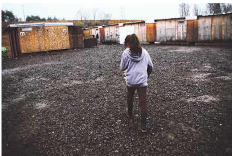
A nine year old Iraqi girl returns to her wooden 'house' in the Dunkirk camp

For more information, go to www.facebook.com/maastrichtgoestocalais