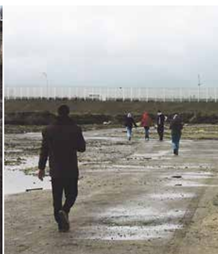
The 'Jungle' in Calais, completely wiped out