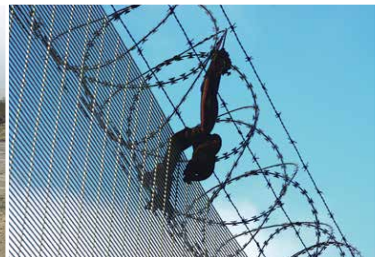
A left behind shawl at the camp in Calais