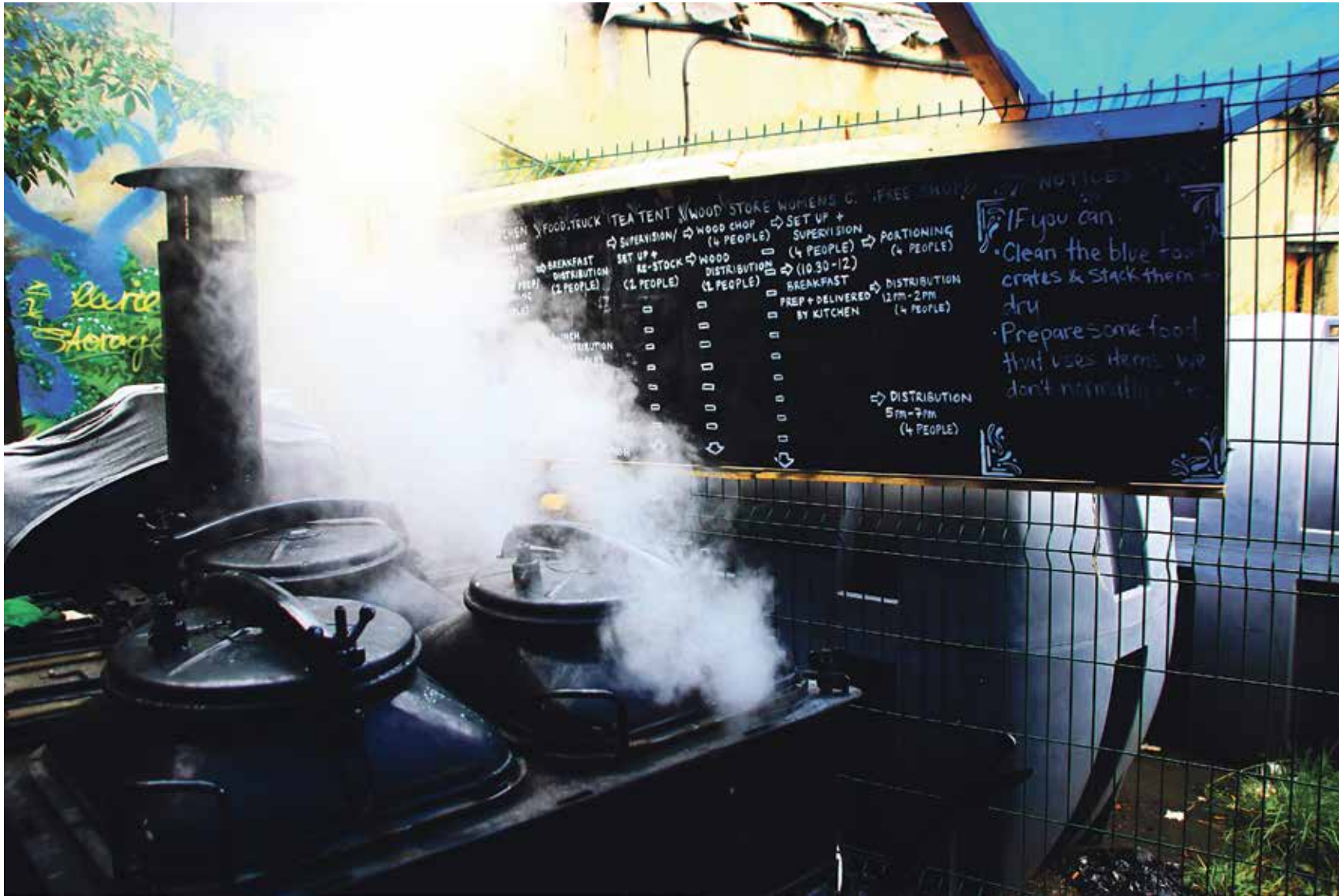
The volunteer kitchen in the refugee camp in Dunkirk, with a water heating machine

Last Thursday four Italian UM students who had raised funds for the refugees headed for the 'Jungle' in Calais and the smaller camp at Dunkirk. Calais has been completely wiped out, says third-year law student Angelica Giombini. "It's as if a tsunami has washed everything away. In the mud you still find left-behind clothes, shampoo and vegetables. As we walked around the area two vans with sixteen police officers immediately came over to check on us."