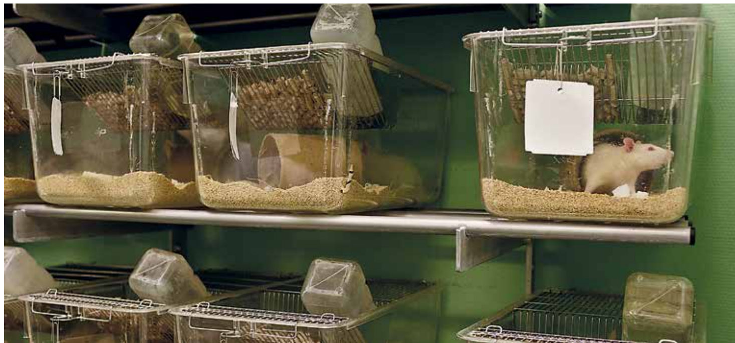
Muizen in Maastrichts dierproeven centrum

Brieven mogen maximaal 300 woorden bevatten. De redactie behoudt zich het recht voor om brieven in te korten of niet te plaatsen. Brieven zonder vermelding van naam en telefoonnummer worden niet geplaatst.