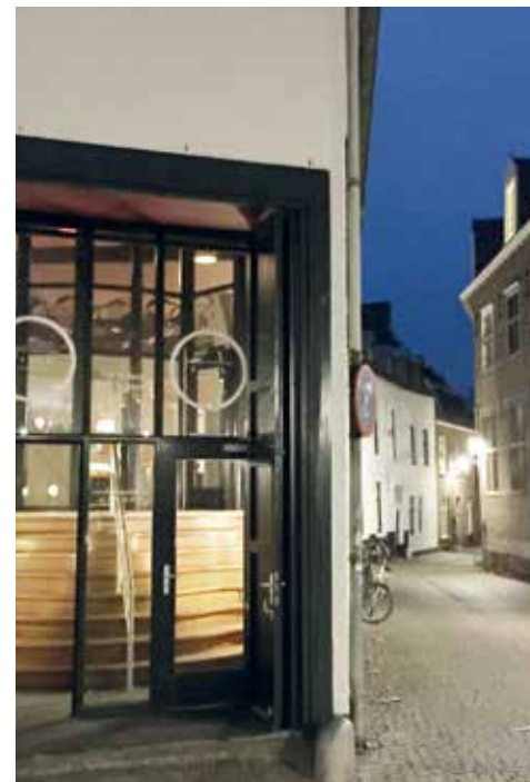
Fresh, Ezelmarkt 15, www.freshmaastricht.com