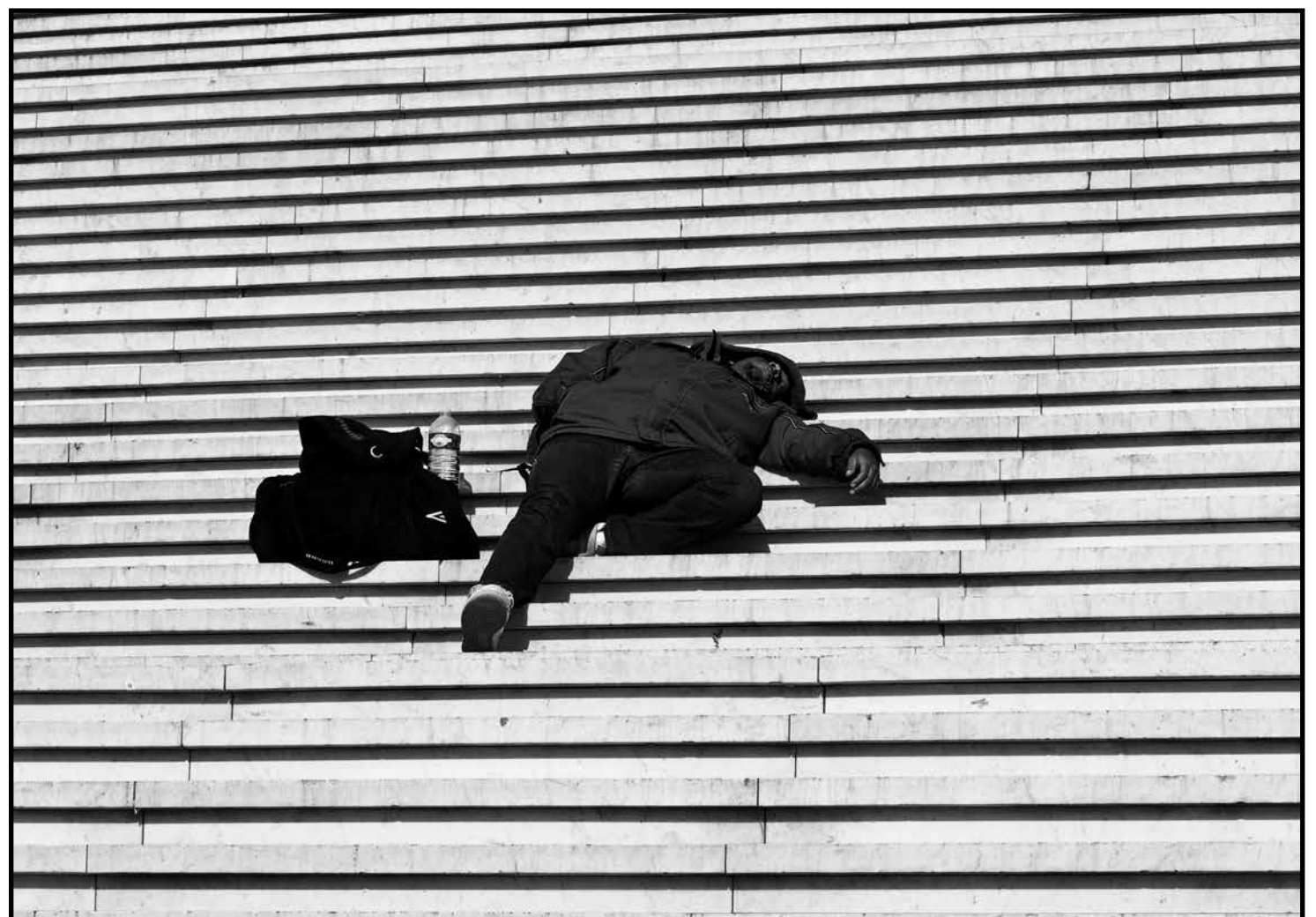
“Patiënten met ernstige psychische aandoeningen worden aan hun lot overgelaten”

De geestelijke gezondheidszorg zit gevangen in een “bureaucratisch, risicomijdend systeem waar niet alleen patiënten maar ook hulpverleners zich niet meer thuis voelen”, zegt Van Os. “Ze raken gedemotiveerd omdat ze zelf niets meer kunnen beslissen. Alles moet en niets mag. De bureaucratie is verstikkend, de overhead peperduur, terwijl hulpverleners aan de lopende band worden ontslagen. Bij GGZ Friesland 250 medewerkers,