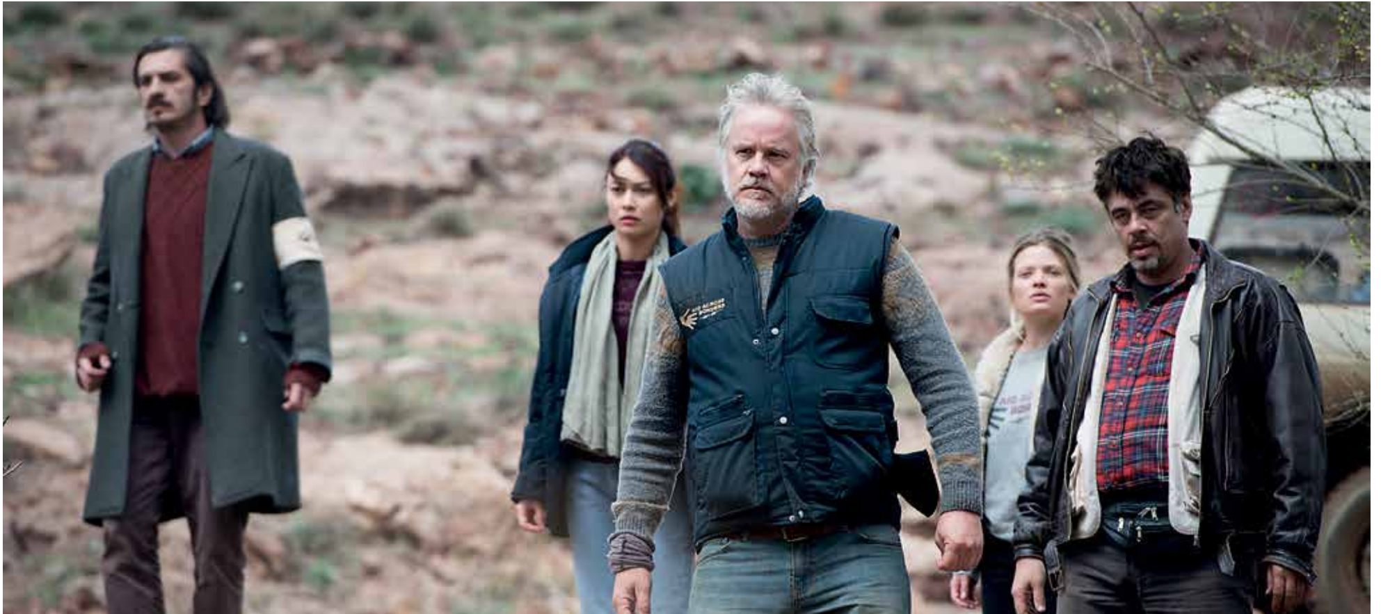
Still uit A perfect day

Het verhaal: Volgt een internationale groep hulpverleners tijdens een allerm minst perfecte dag ergens op de Balkan in 1995. Het team van de ouwe rot Mambrú (Benicio del Toro) is opgezadeld met een ogenschijnlijk eenvoudige opdracht. In een bergdorp is een lijk in een waterput gedumpt. Om te voorkomen dat het drinkwater besmet raakt, moet het lichaam binnen 24 uur opgetakeld worden. De overledene is echter nogal corpulent en bovendien lijkt er nergens een stuk touw te vinden.