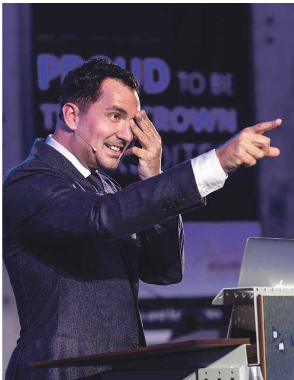
“Ja, ik bedoel jou”, grapte de loensende cabaretier Guido Weijers dinsdagavond tijdens een masterclass ‘geluk’. Zie pagina 3

Bij psychologie (19,5 procent) spelen persoonlijke problemen vaker een rol, omdat sommige studenten de studie kiezen vanwege hun eigen ervaringen met mentale gezondheidszorg. Ook kiezen de psychologen ervoor om twee struikelblokken – methoden en techniek en statistiek – in de eerste twee perioden te geven. “These courses are experienced as difficult, but are highly relevant for a study in psychology (...) FPN wants to make students aware of the statistical parts of their study right from the start; this prevents students from drop-