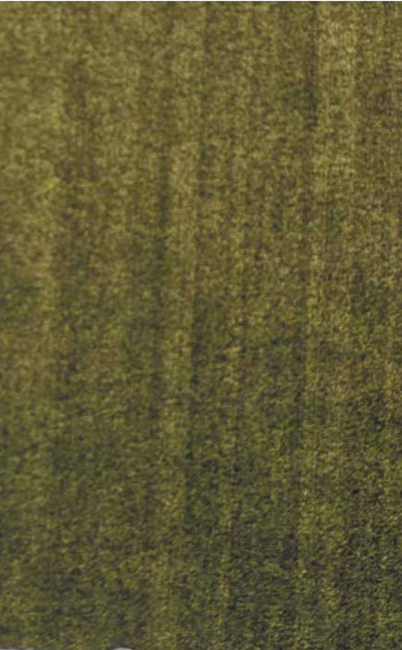
Geert Wilders