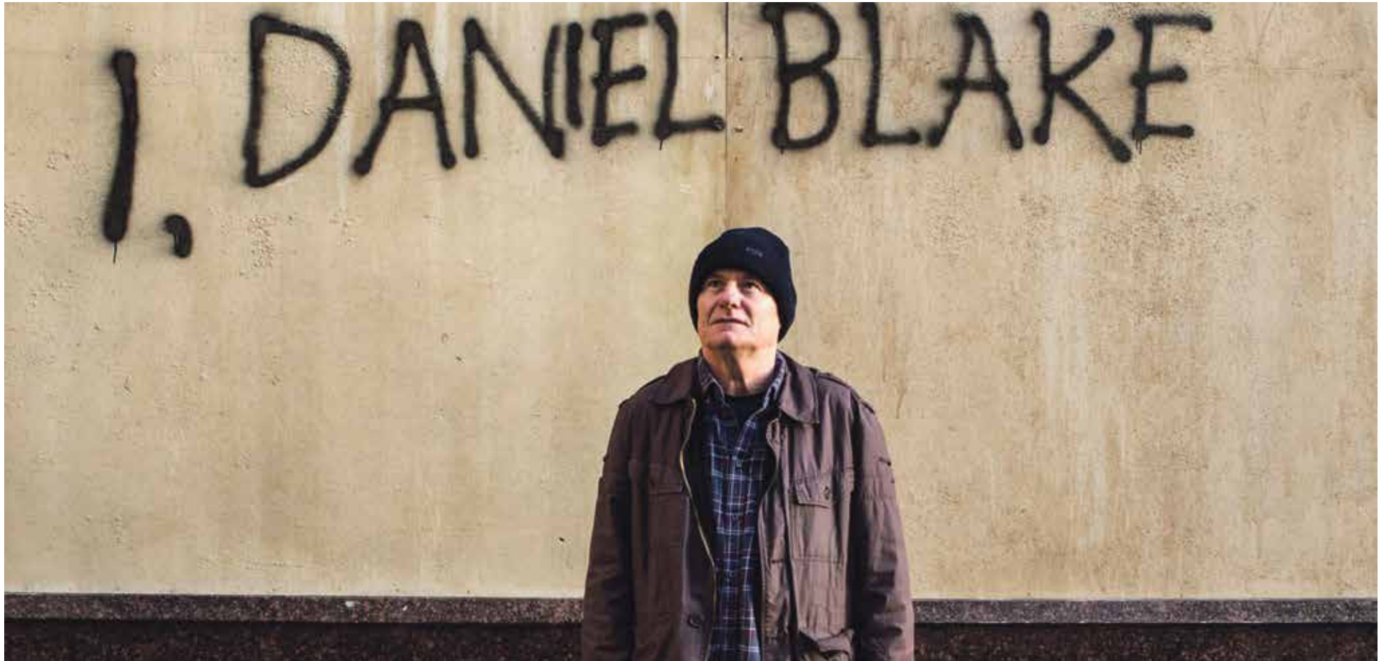
Still uit I, Daniel Blake