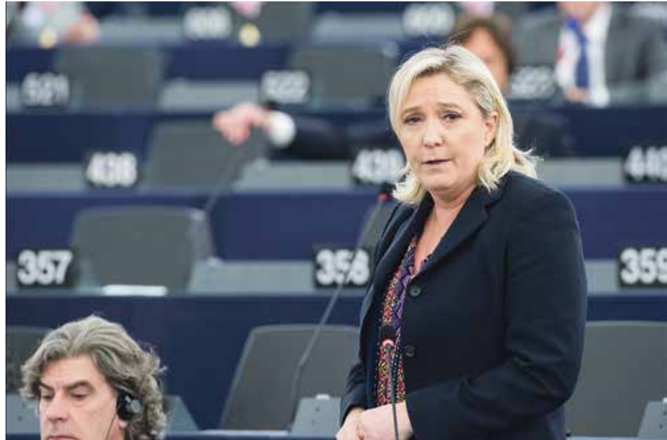
Marine le Pen