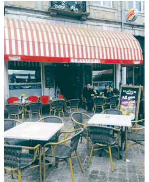
Brasserie Pannenkoeken & Meer, Markt 70