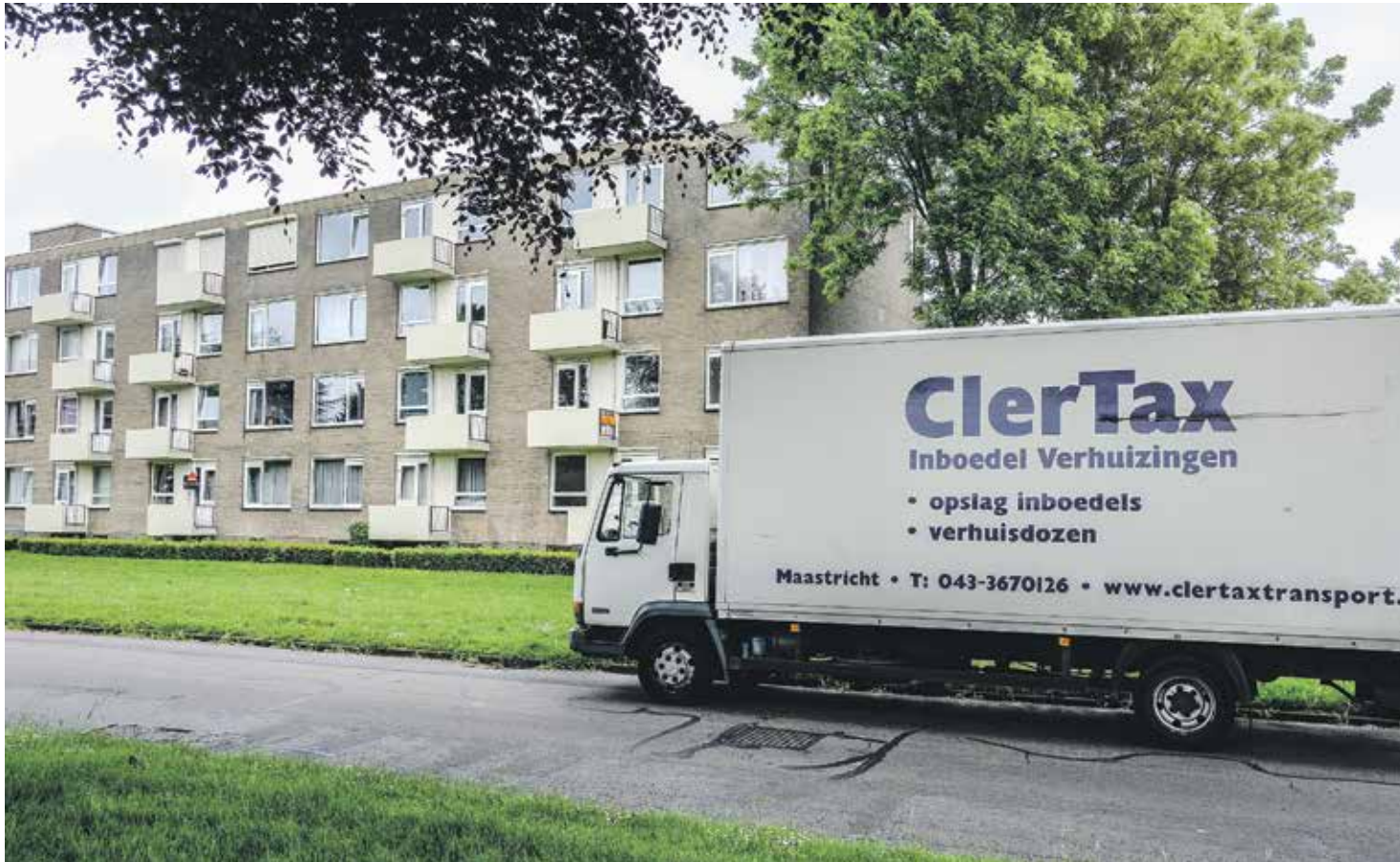
Mensen die al tientallen jaren in de wijk wonen, vertrekken nu vanwege de studenten