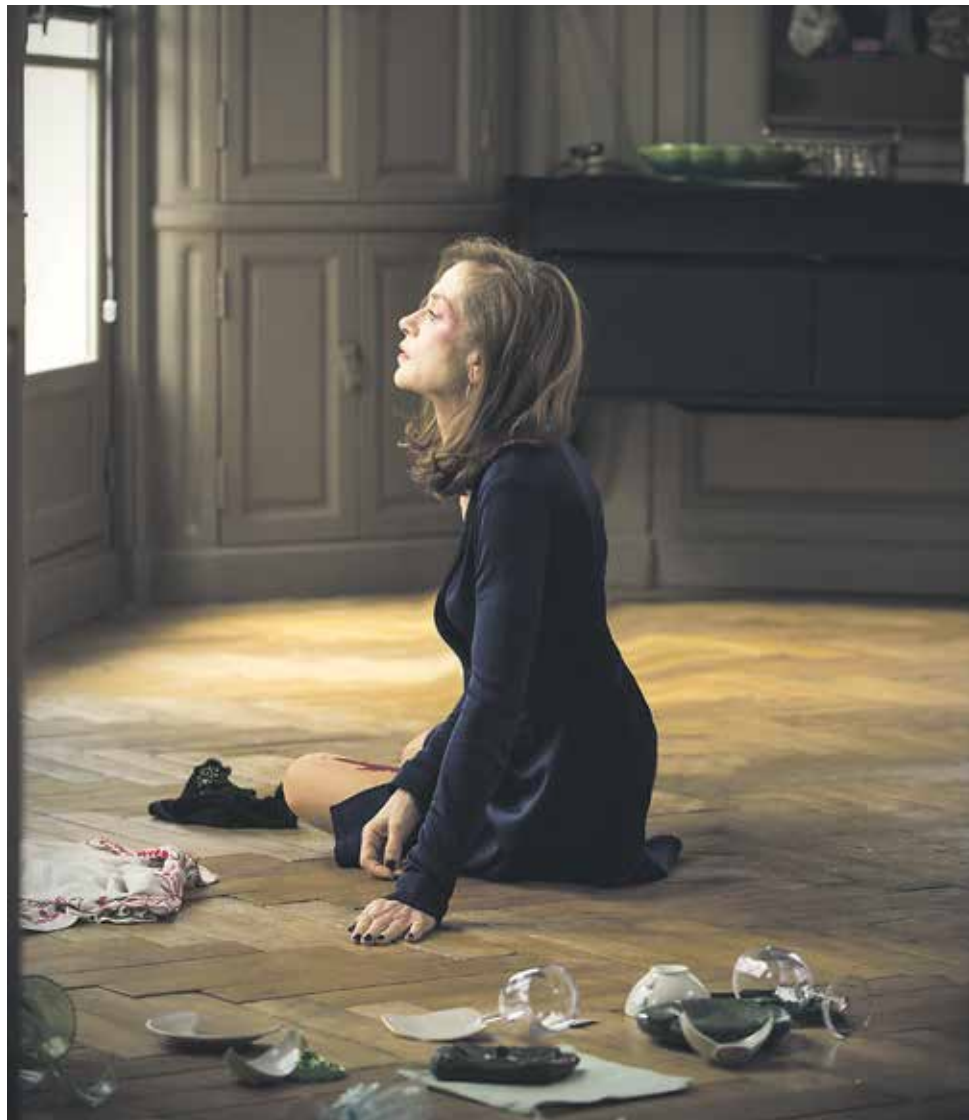
Still uit Elle