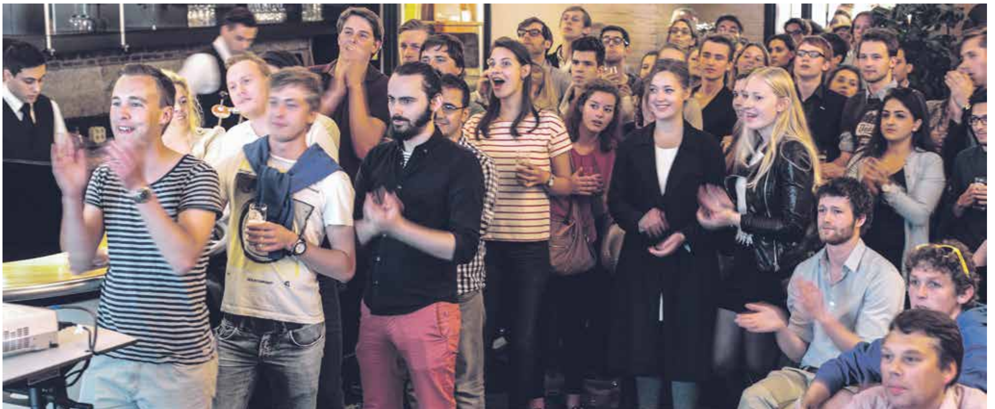
Picture of the presentation of the 2014 election results

Last week, Maastricht University held the 2016/17 elections for its Faculty and University Councils. But standing for election (or simply voting, for that matter) are not the only ways to get involved in student politics. Maastricht boasts a whole range of political activities, if you know where to look. But do students know where to look? And, more fundamentally, do they care to look at all?