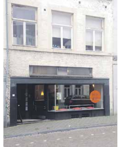
Fresh Cooked, Brusselsestraat 93, www.freshcooked.nl