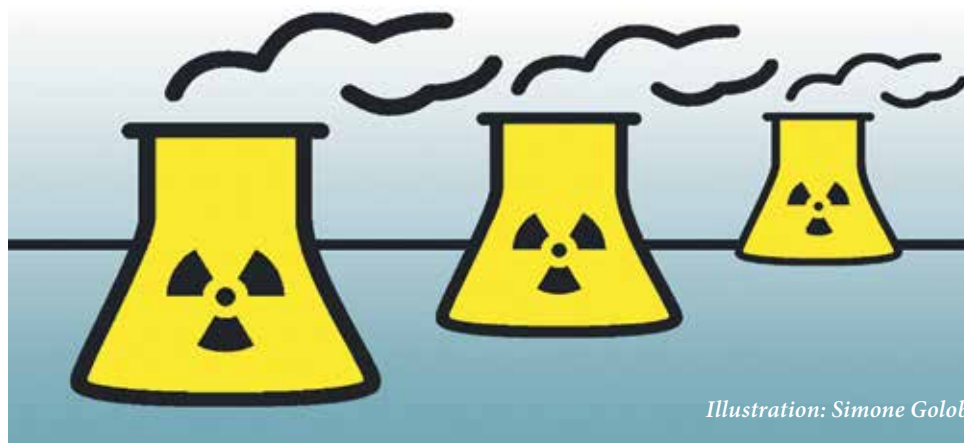
Illustration: Simone Golob

Aachen wants Tihange to be closed as soon as possible; two German law firms are investigating the