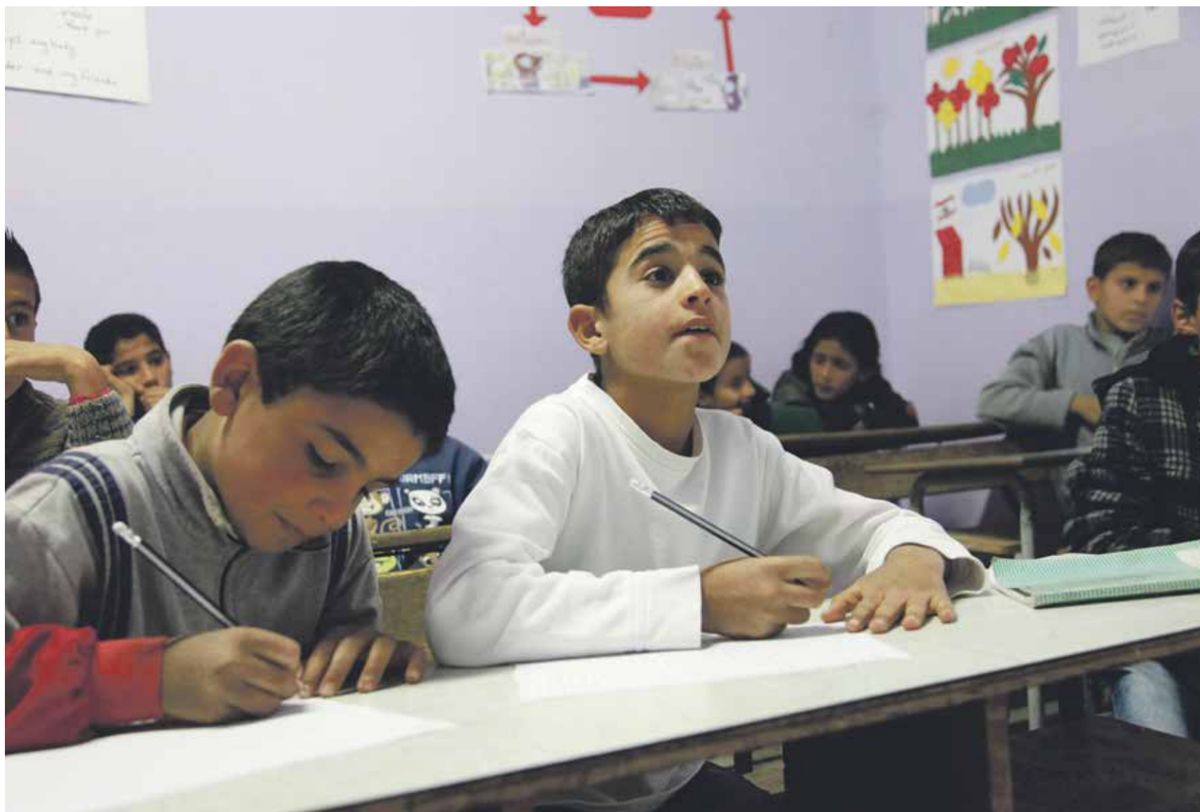
Refugee children go to primary school in Libanon. But what about those who want to pursue further education?

“But for now all the options are driving me crazy”