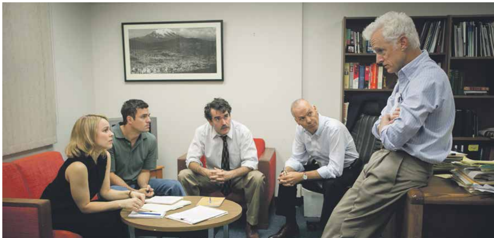
Still uit Spotlight