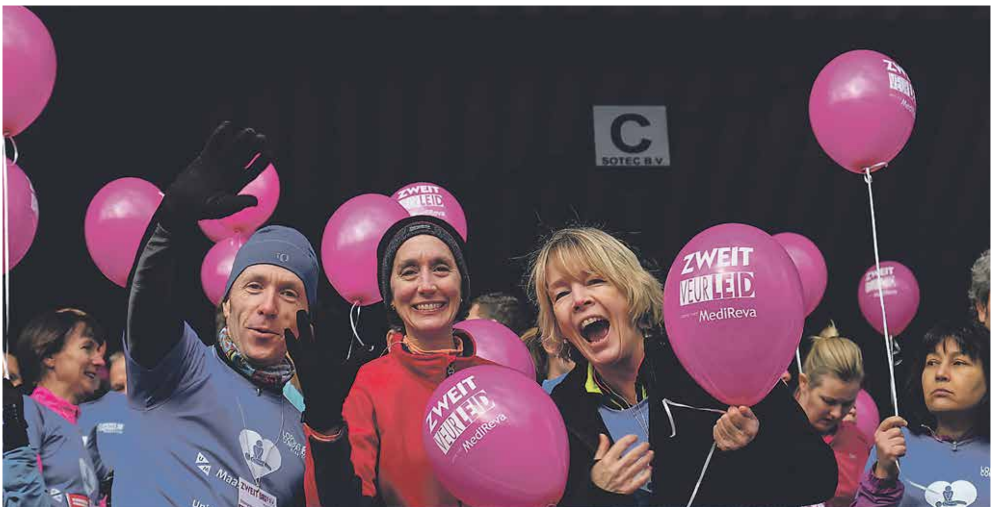
Zweit veur Leid, the annual charity run in Maastricht was held last Sunday 17 January. The Limburg University Fund collected €35.200 to fund resuscitation lessons at secondary schools. 350 of the 2500 participants ran for the Limburg University Fund. The track of 4, 8 or 12 kilometres went through the brand new A2-tunnels.

Onafhankelijk weekblad van de Universiteit Maastricht | Redactieadres: Postbus 616 6200 MD Maastricht | Jaargang 36 | 21 januari 2016