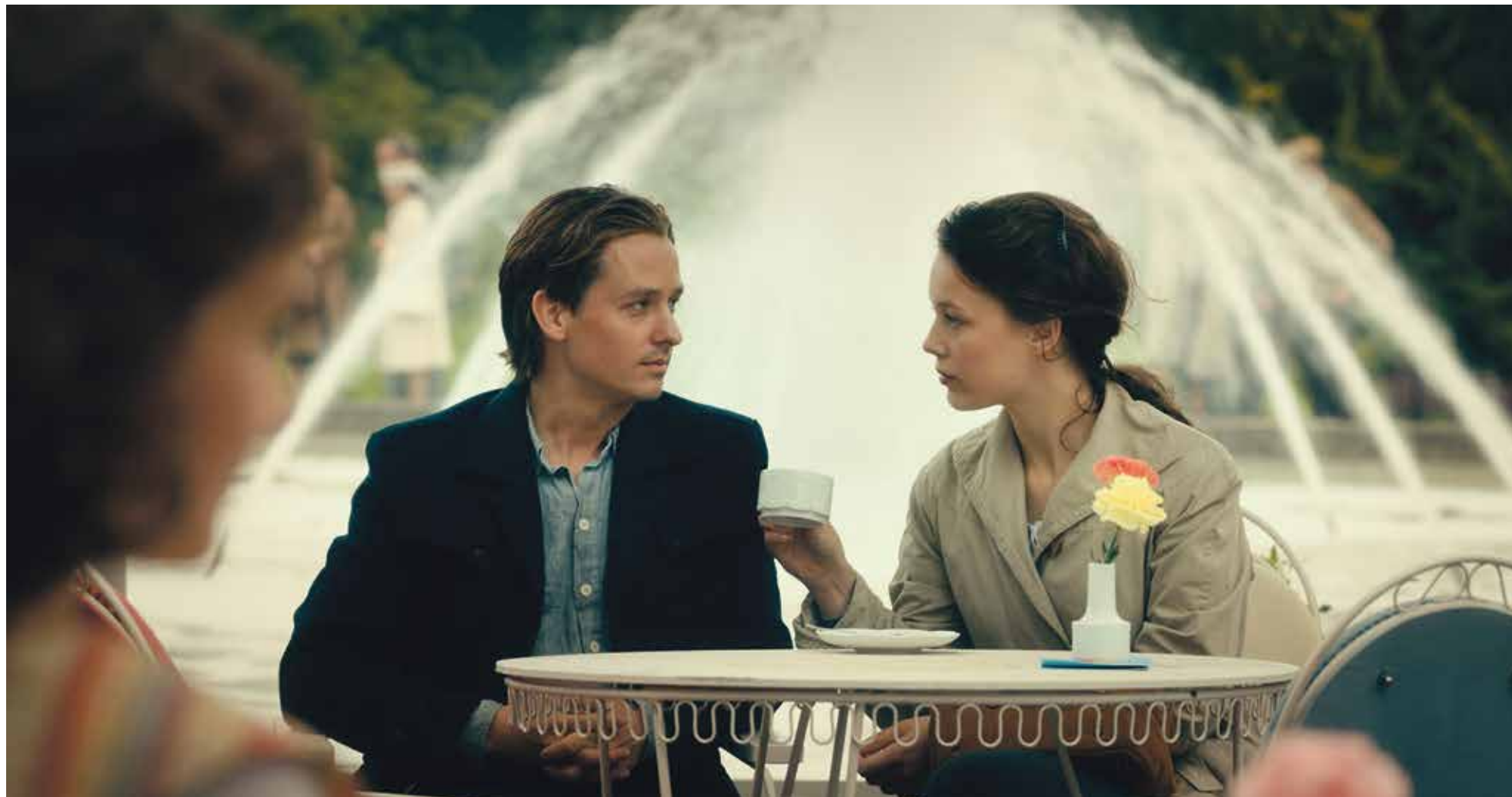
Still uit Werk ohne Autor

Inhoud: Kunstenaar Kurt Barnert (Tom Schilling) probeert zijn eigen stijl te vinden in de schilderkunst. Eerst in het oostelijk deel van Duitsland dat achtereenvolgens het nationaal-socialisme en het communisme over zich heen krijgt, en daarna in het kapitalistische westen. Daarbij wordt Barnert ook nog eens geconfronteerd met een schoonvader - professor Seeband (Sebastian Koch) - die geen schone handen blijkt te hebben.