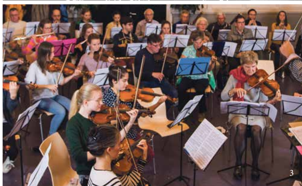
1 Orkest in 1986 Foto: archief Universiteitsorkest 2 1998 Foto: Philip Driessen 3 2018 Foto: archief Universiteitsorkest