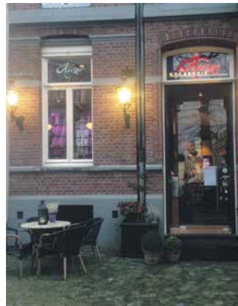
Brasserie Keizer Keizer Karelplein 15, www.brasseriekeizer.nl