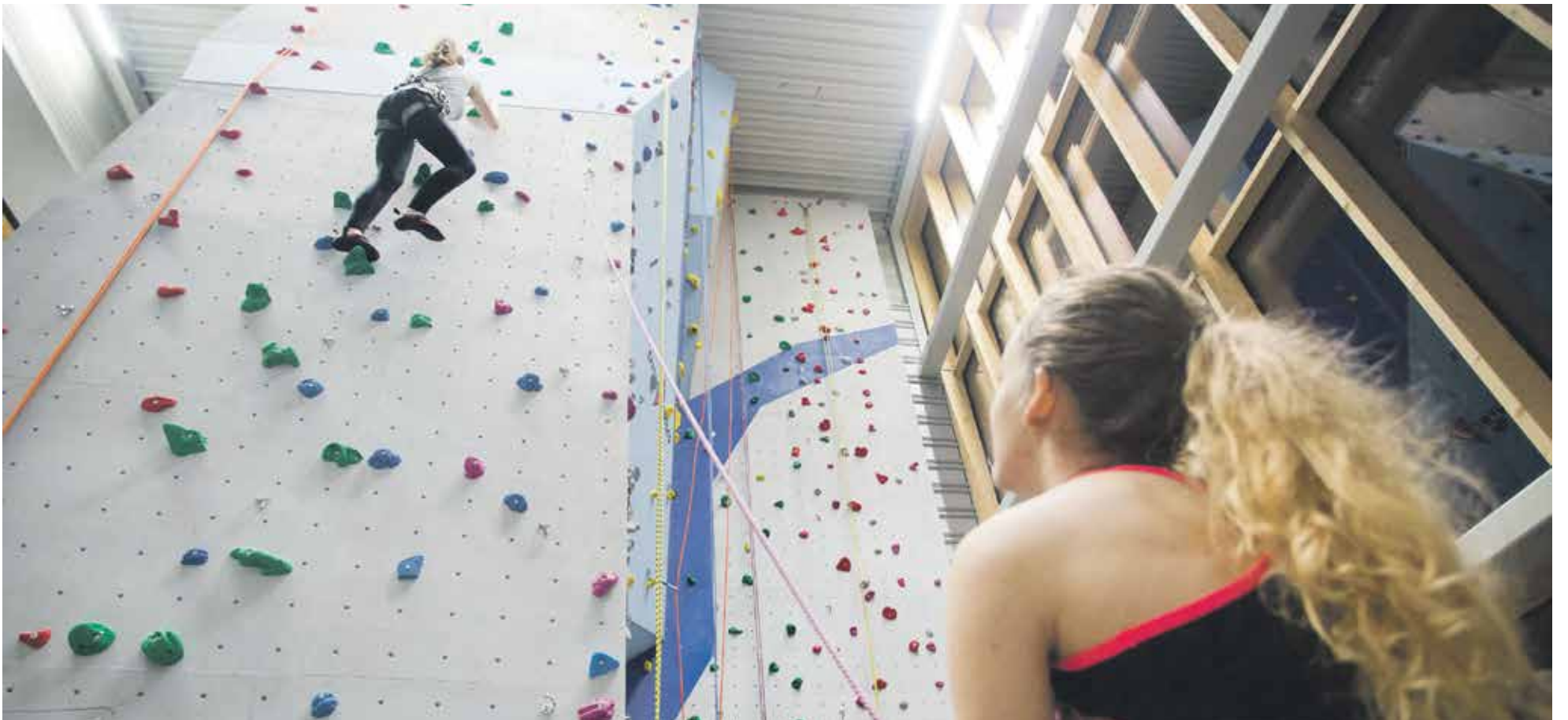
The new university sports hall is finished so far. See photo impression page 8-9

Onafhankelijk weekblad van de Universiteit Maastricht | Redactieadres: Postbus 616 6200 MD Maastricht | Jaargang 36 | 18 februari 2016