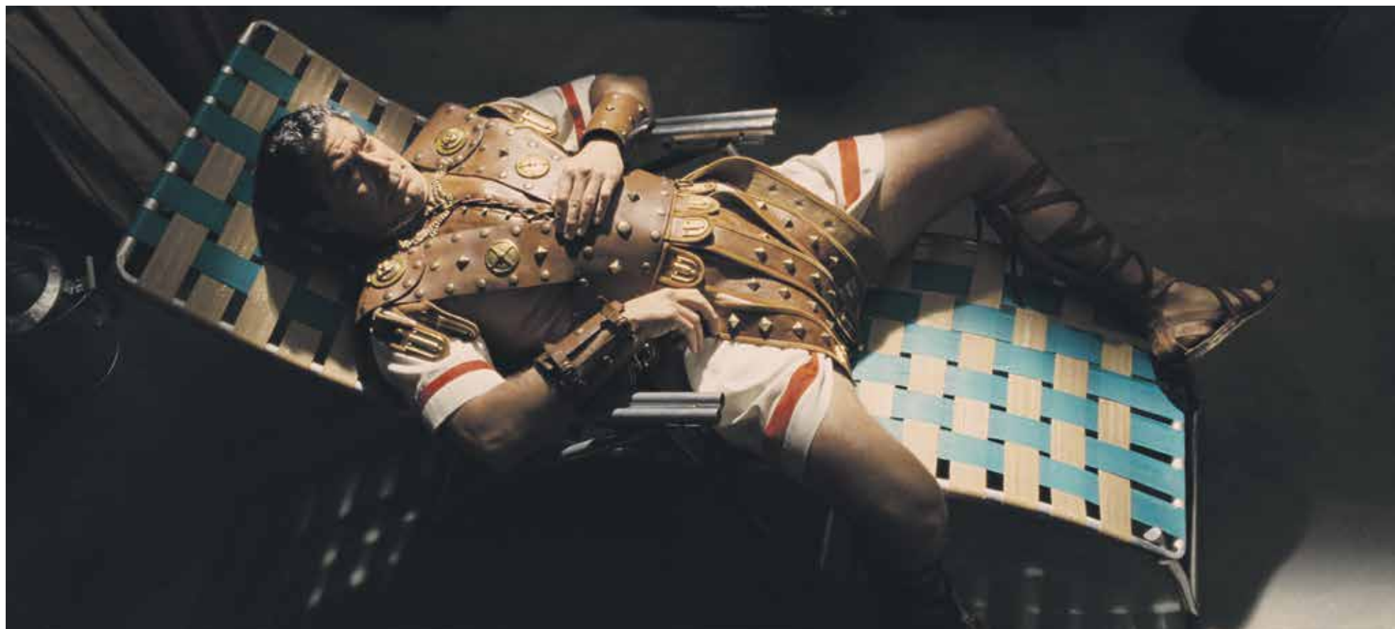
Still uit Hail Caesar!

Het verhaal: Hollywood, begin jaren vijftig. Eddie Mannix (Josh Brolin) werkt als 'fixer' voor Capitol Pictures. Zijn taak: schandaaltjes van door de studio gecontracteerde filmsterren verborgen houden voor de roddelpers. De gewiekste Mannix krijgt het zwaar voor de kiezen als steracteur Baird Whitlock (George Clooney) – die net aan een peperduur Bijbelepos is begonnen – ontvoerd wordt.