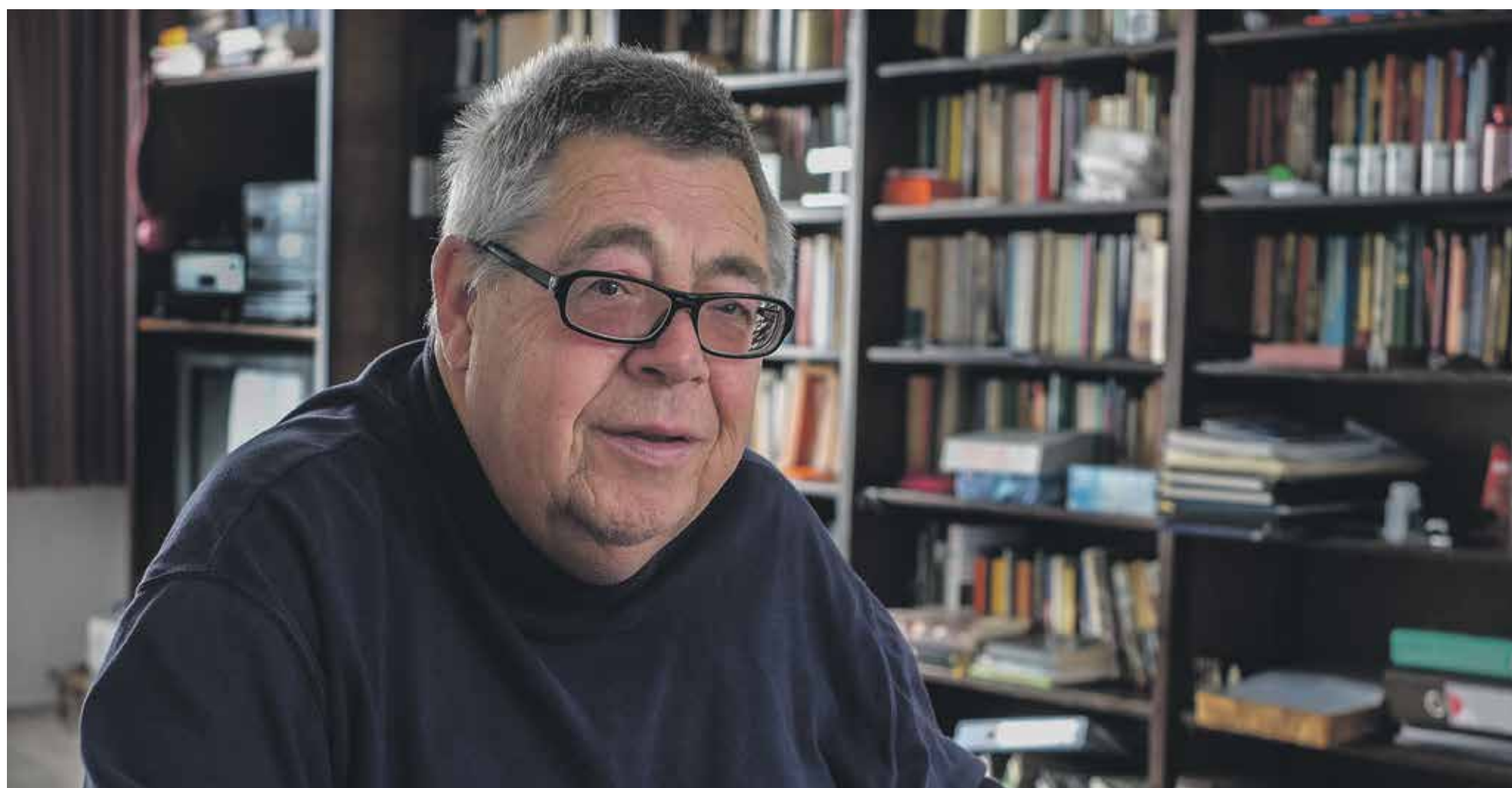
“Ik kom zelden een experiment tegen dat spannend is”