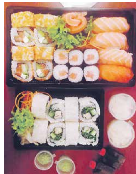
Sushi Centre Hoenderstraat 13A, www.sushicentre.nl