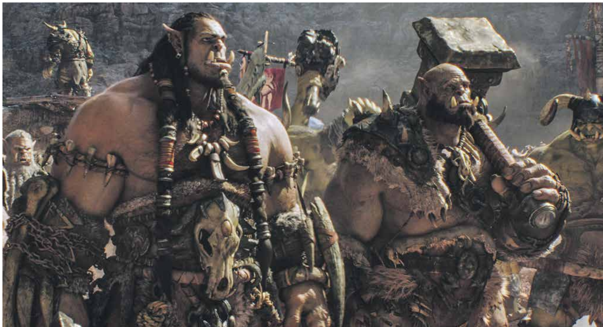
Still uit Warcraft: The Beginning

Rust er een vloek rust op verfilmingen van games? Dat lijkt wel zo: zelden brengt zo'n film - denk maar aan het peperdure Prince of Persia of Need for Speed - genoeg geld in het laatje. Het probleem is wellicht dat regisseurs zowel de gamers tevreden willen houden als het bredere publiek. Dat lijkt nog geen probleem bij de film Warcraft: The Beginning die in het eerste weekend al meer dan dertig miljoen heeft opgeleverd.