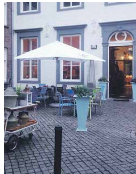
Talentino, Grote Gracht 74, www.talentino-mestreech.nl/