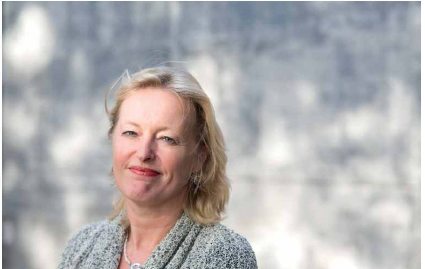
Jet Bussemaker

Haar grootste overwinning heeft minister Bussemaker vlak voor de zomervakantie geboekt: de basisbeurs verdwijnt. Maar ze gaat niet achterover leunen. “Ik verveel me geen dag hier. Geen minuut.”