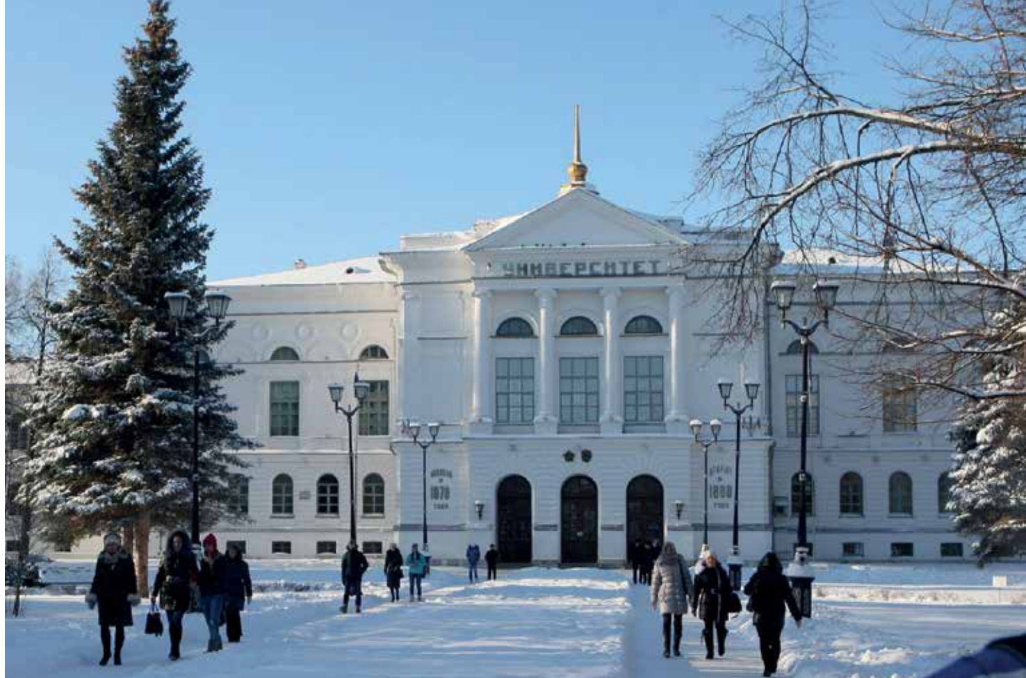
Universiteit van Tomsk