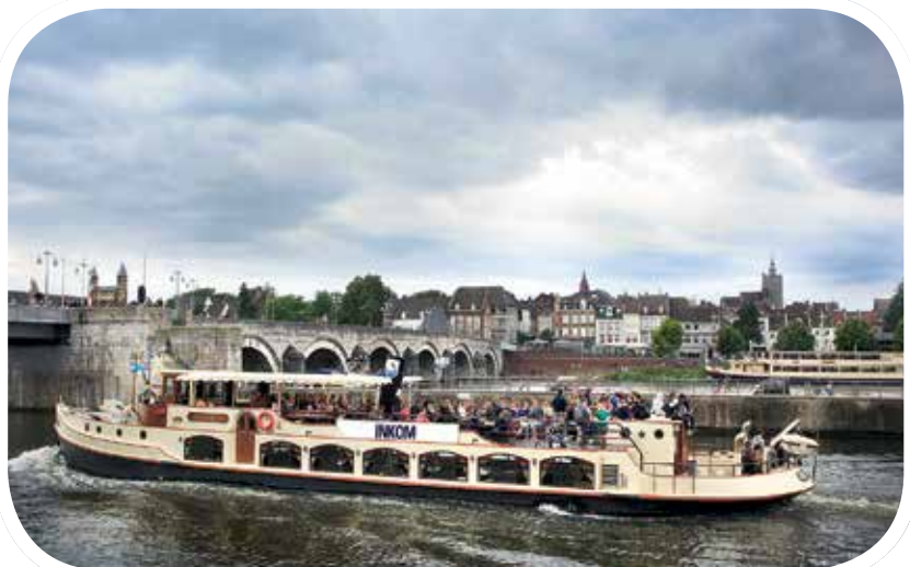
More than 2600 freshmen joined the Inkom 2014 last week. There was sun, a bit of rain, there was fun, music, beer and a lot to do about students under 18. More about the Inkom on page 3, 5, 8, 9