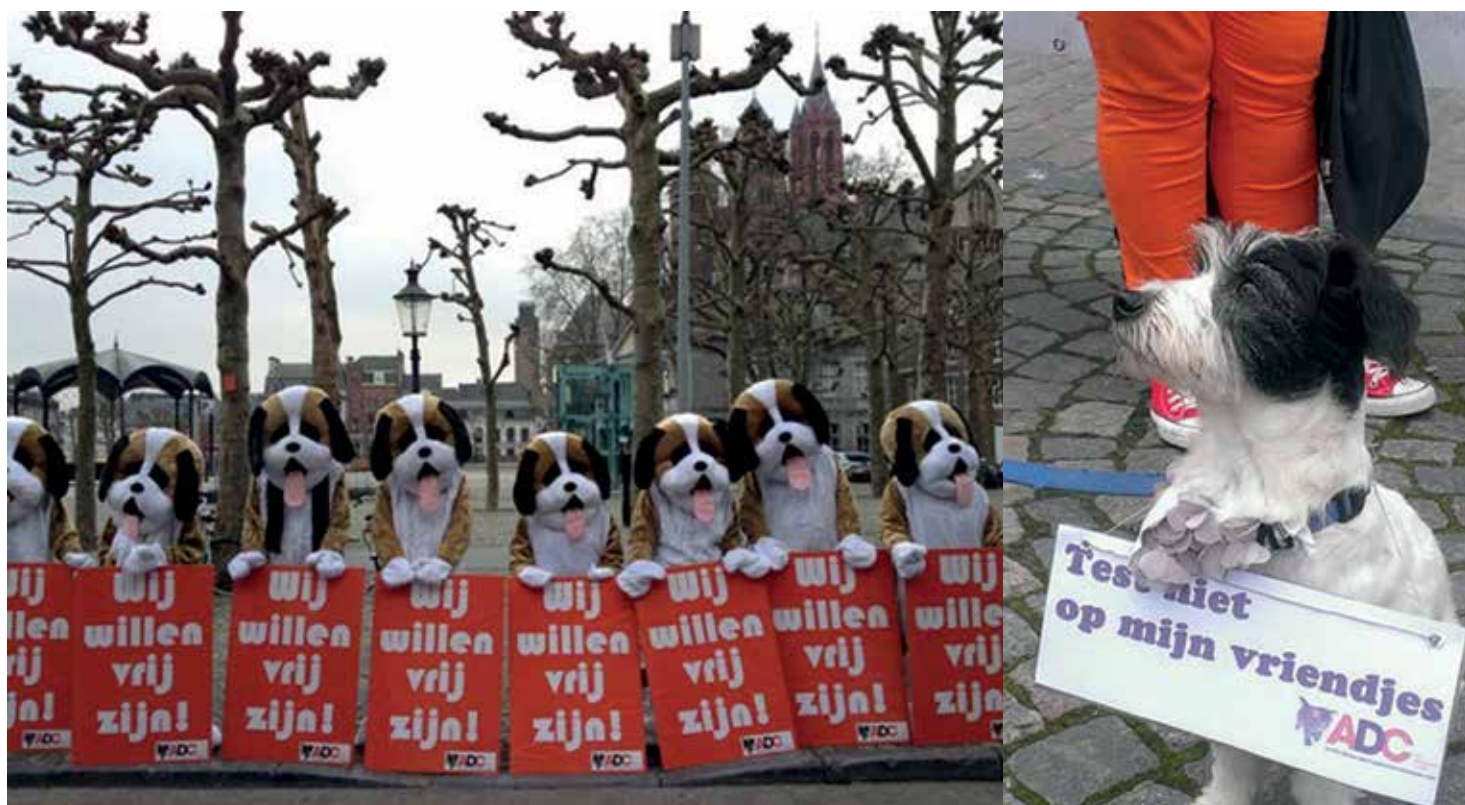
ADC protesteert tijdens de Diesviering 2013 op het Vrijthof