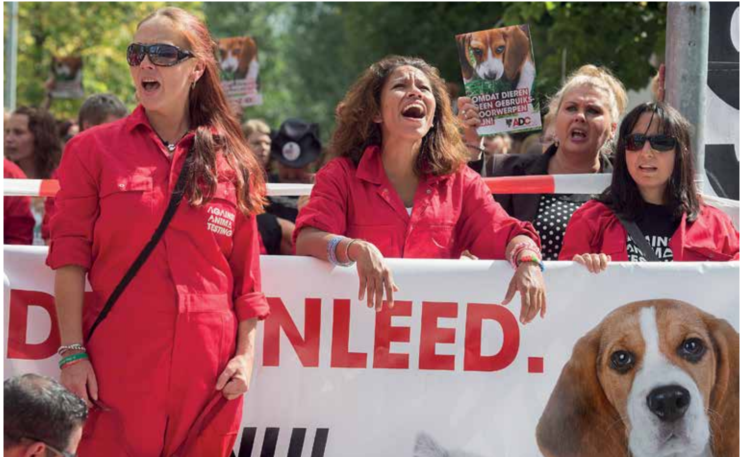
Activisten protesteerden maandag in Randwyck tegen dierproeven