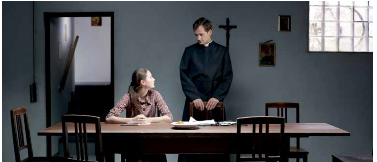
Still uit Kreuzweg