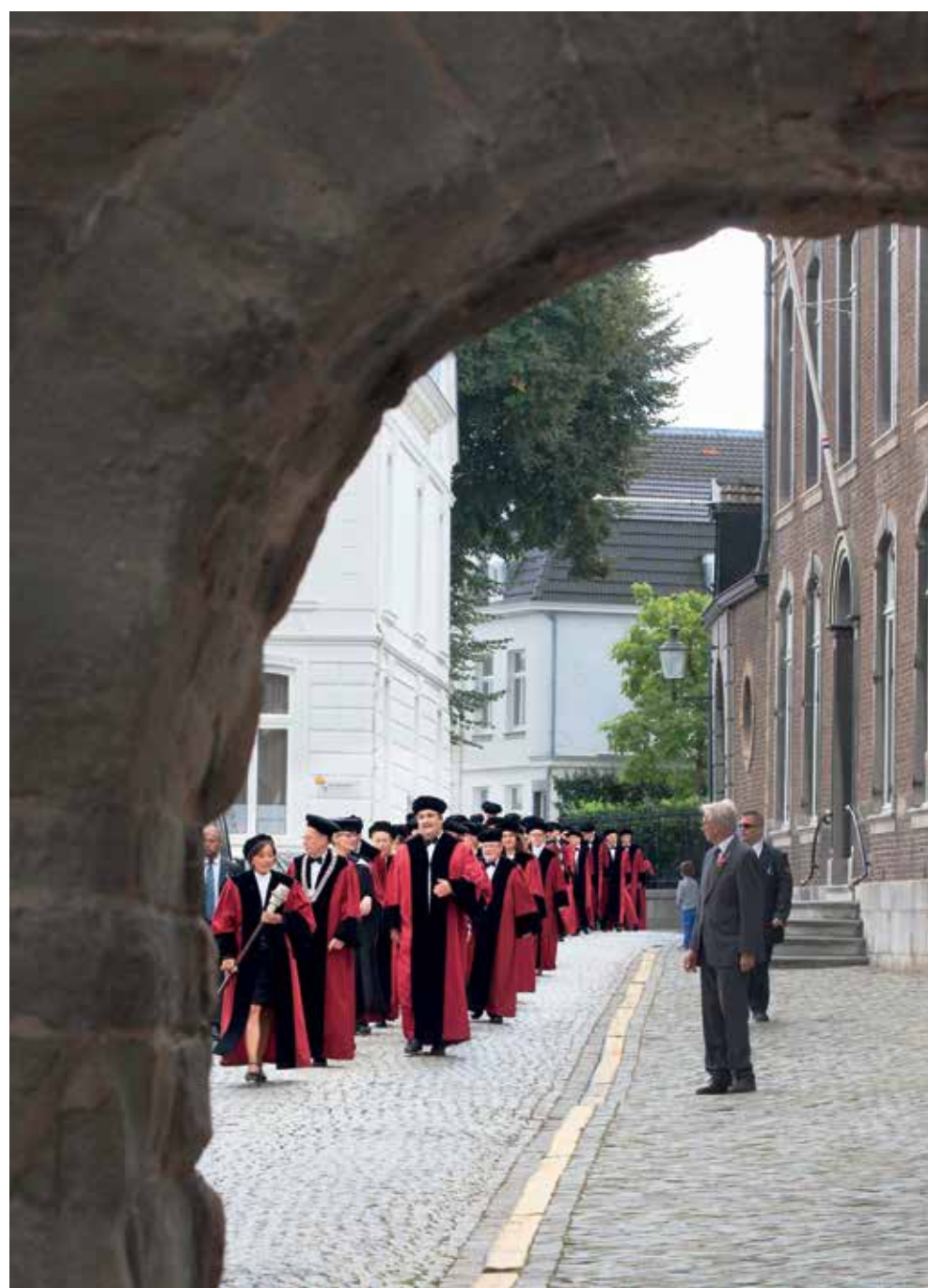
The traditional cortege walks to the Theater aan het Vrijthof, where the opening ceremony of the academic year was held last Monday. Read more about the Opening Academic Year on page 5 (in English) and pages 8-9 (in Dutch)