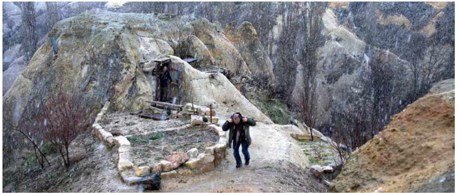
Still uit Winter Sleep

Die filmtitel is uitstekend gekozen, want: