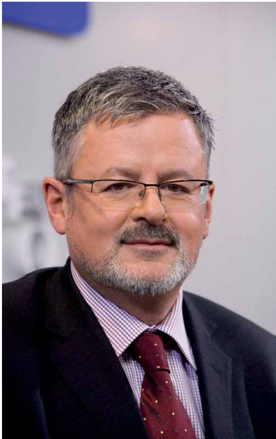
Chris Clark