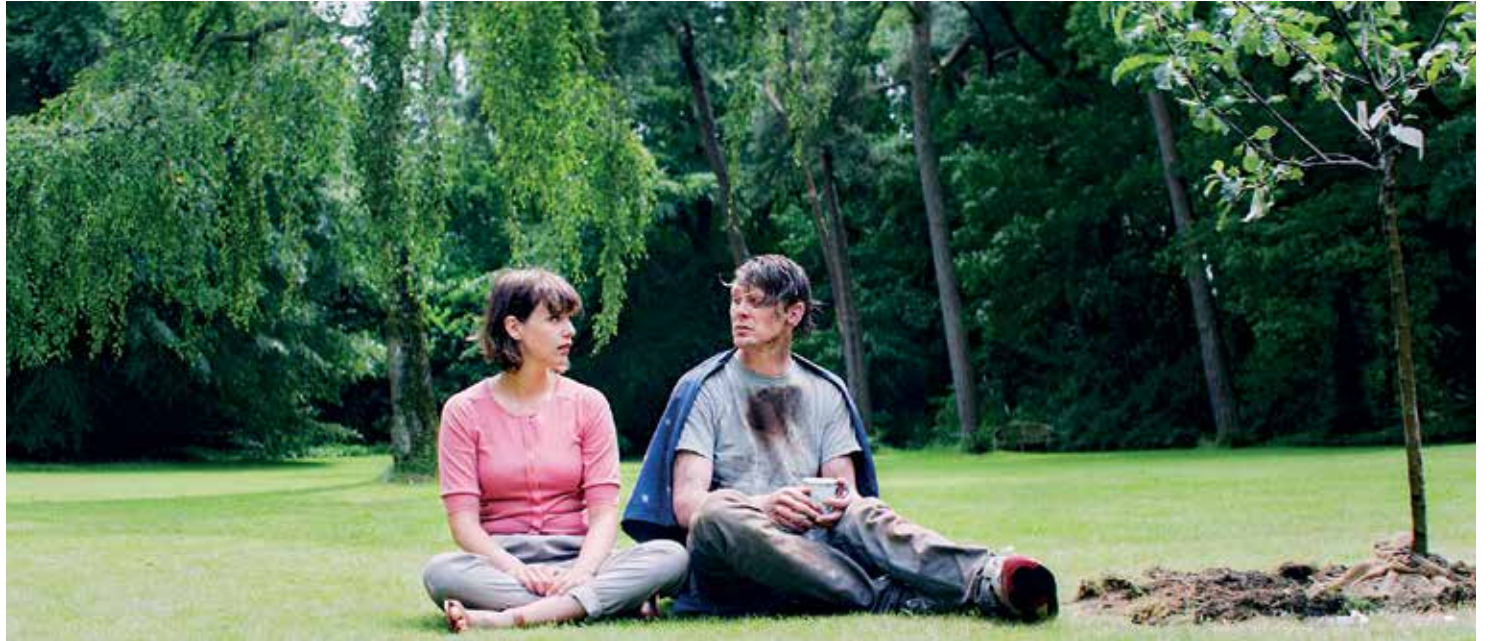
Still uit Aanmodderfakker