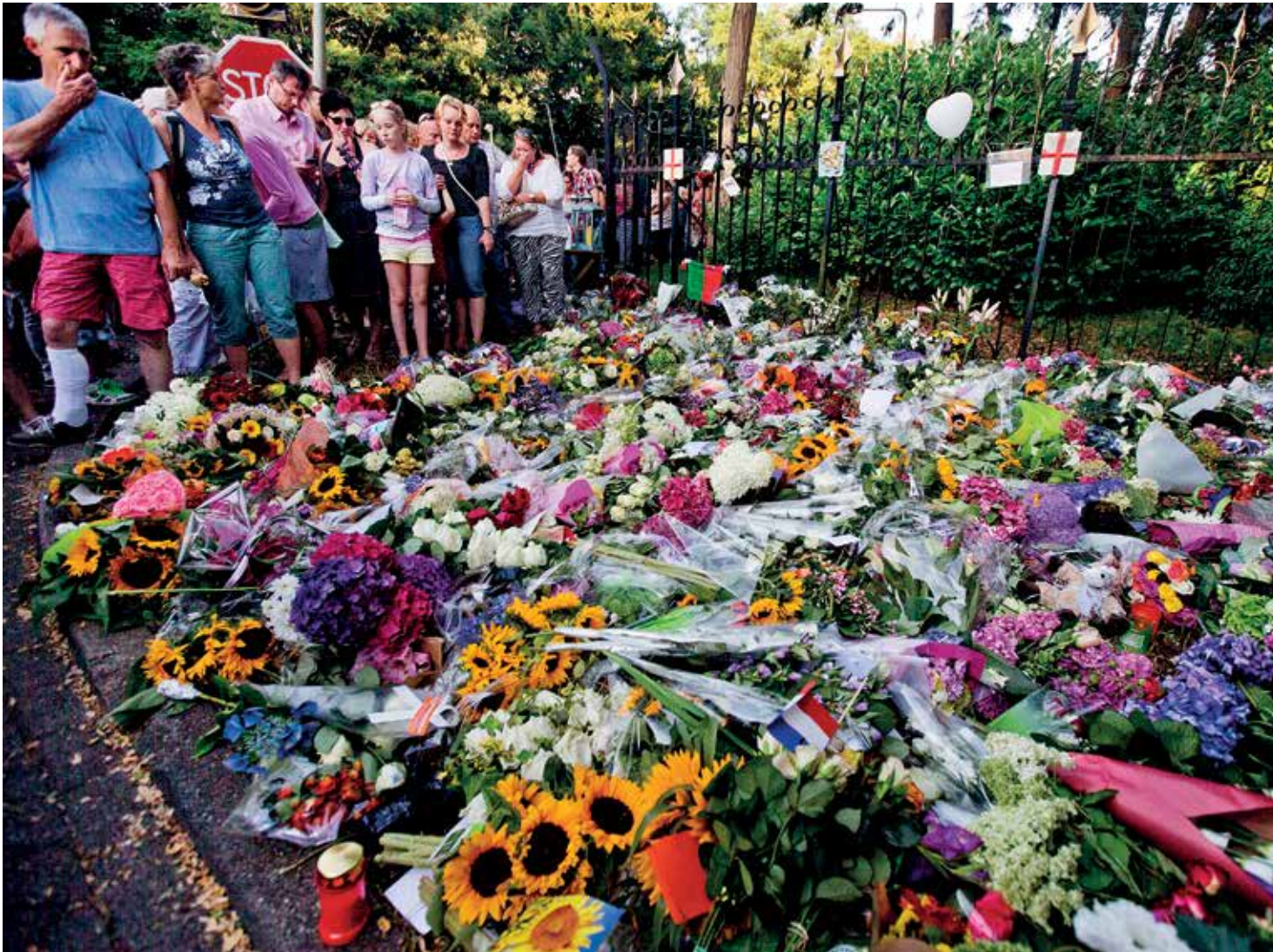
Bloemen voor de MH17-slachtoffers op het terrein van de Korporaal van Oudheusdenkazerne

Volgende week worden de slachtoffers herdacht van de vliegramp MH17. Maastrichtse forensisch radiologen hebben afgelopen zomer geholpen met de identificatie. Eerder al onderzochten ze het lichaam van Els Borst en reconstrueerden ze de overval op de Deurnse juwelierszaak. De ster van het Maastrichtse forensisch radiologisch team, uniek in Nederland, is rijzende.