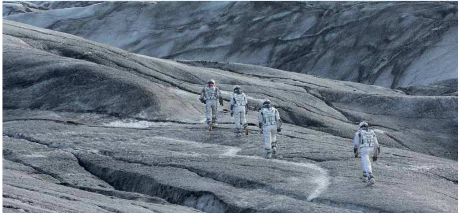
Still uit Interstellar

beste natuurkundigen van NASA bij het naderen van een zwart gat elkaar op een flipover nog eens gaan uitleggen wat een wormgat is? Vanuit die optiek gezien is het nog een geluk dat componist Hans Zimmer een deel van dat metafysisch Enkhuizer Almanak-gebeuzel wegdrukt onder een Teutoonse vol-op-het-orgel-soundtrack. - De castingkeuzes zijn vrijwel over de gehele linie rampzalig. Dat in het reptielenbrein van