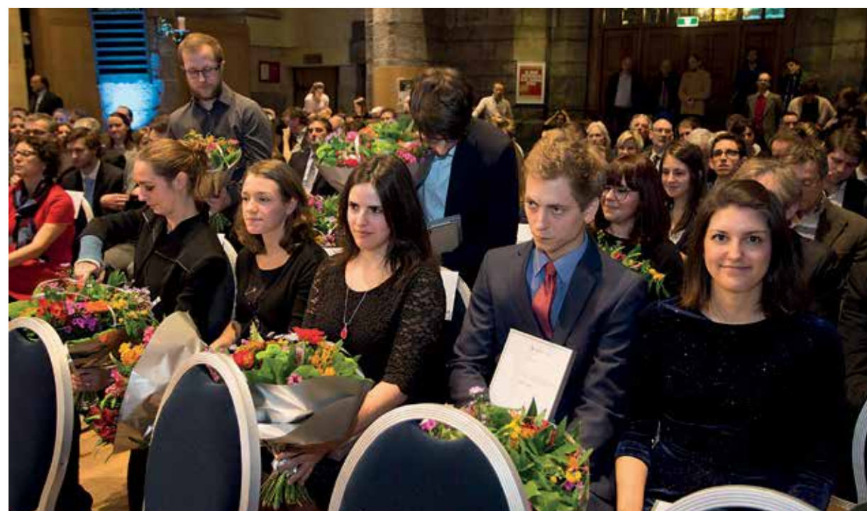
In addition to the student prizes for the best Master's theses of 2014, this year also saw the introduction of the Bachelor's Prize, which was presented to seventeen bachelor's students. The nine Master's Prize winners (pictured above) received their award during the Dies Celebrations in the Sint Janskerk. The seventeen Bachelor's Prize winners received their award during the morning programme at their own faculty