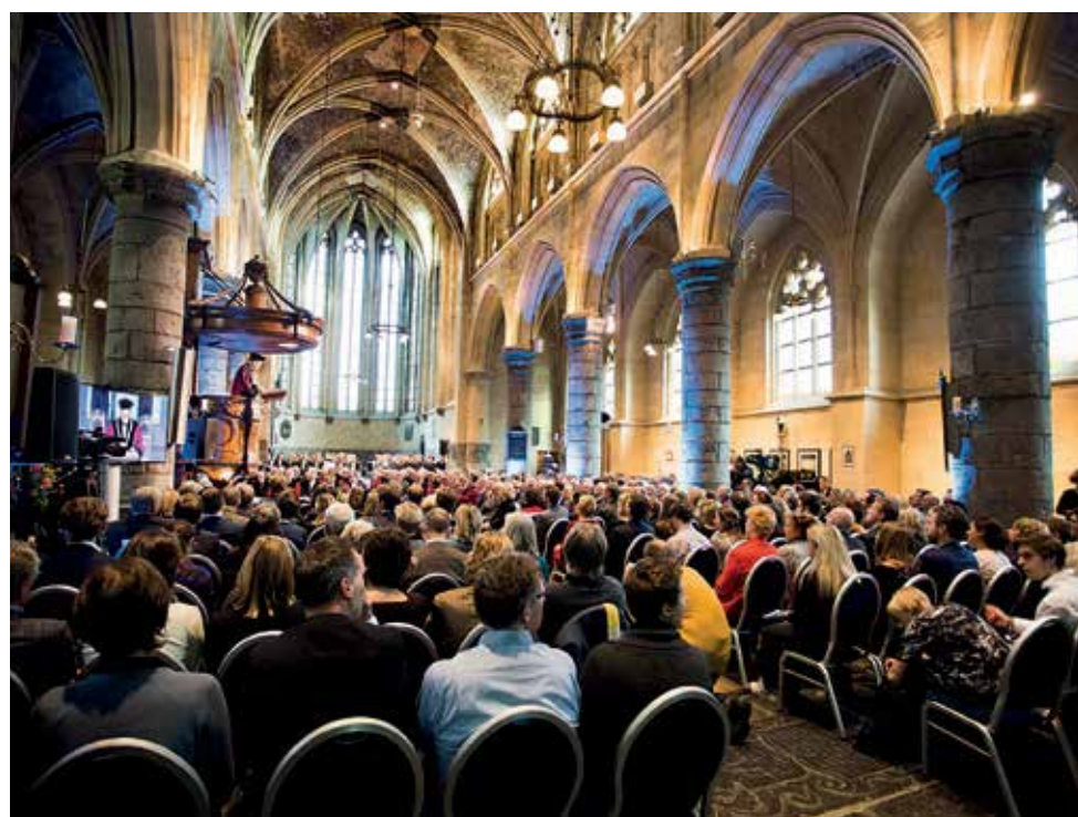
De St. Janskerk was goed gevuld afgelopen vrijdag

ling. Wat talent precies is, daar haalde hij zulke ongelijksoortige grootheden als griezelauteur Stephen King, Einstein en Goethe voor uit de kast. Geluk en hard werken blijken ingrediënten te zijn, net als karakter en het grijpen van kansen. Iedereen heeft wel een talent, maar