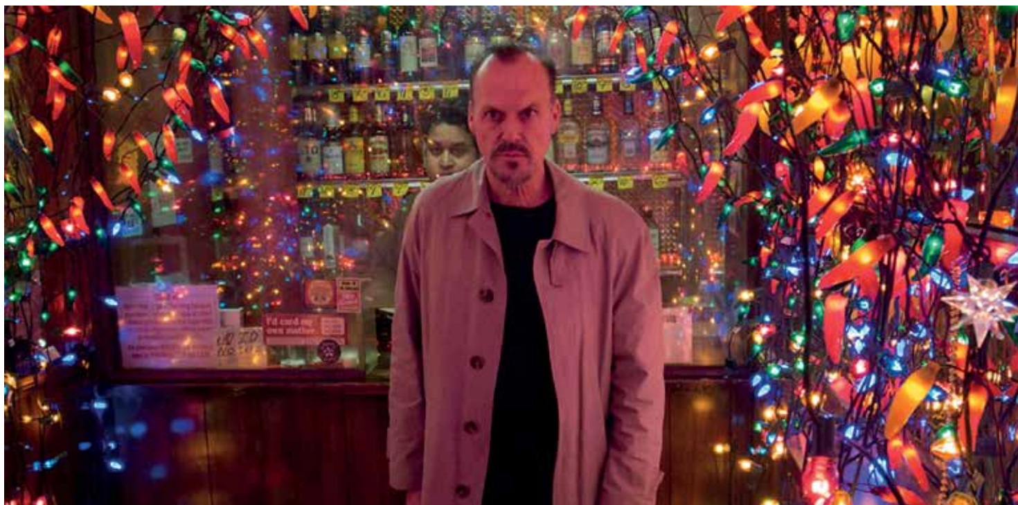
Still uit Birdman

uitgaan. Een man die de strijd met de vergeetelheid wil aangaan, maar net als Icarus zijn vleugels dreigt te verbranden.