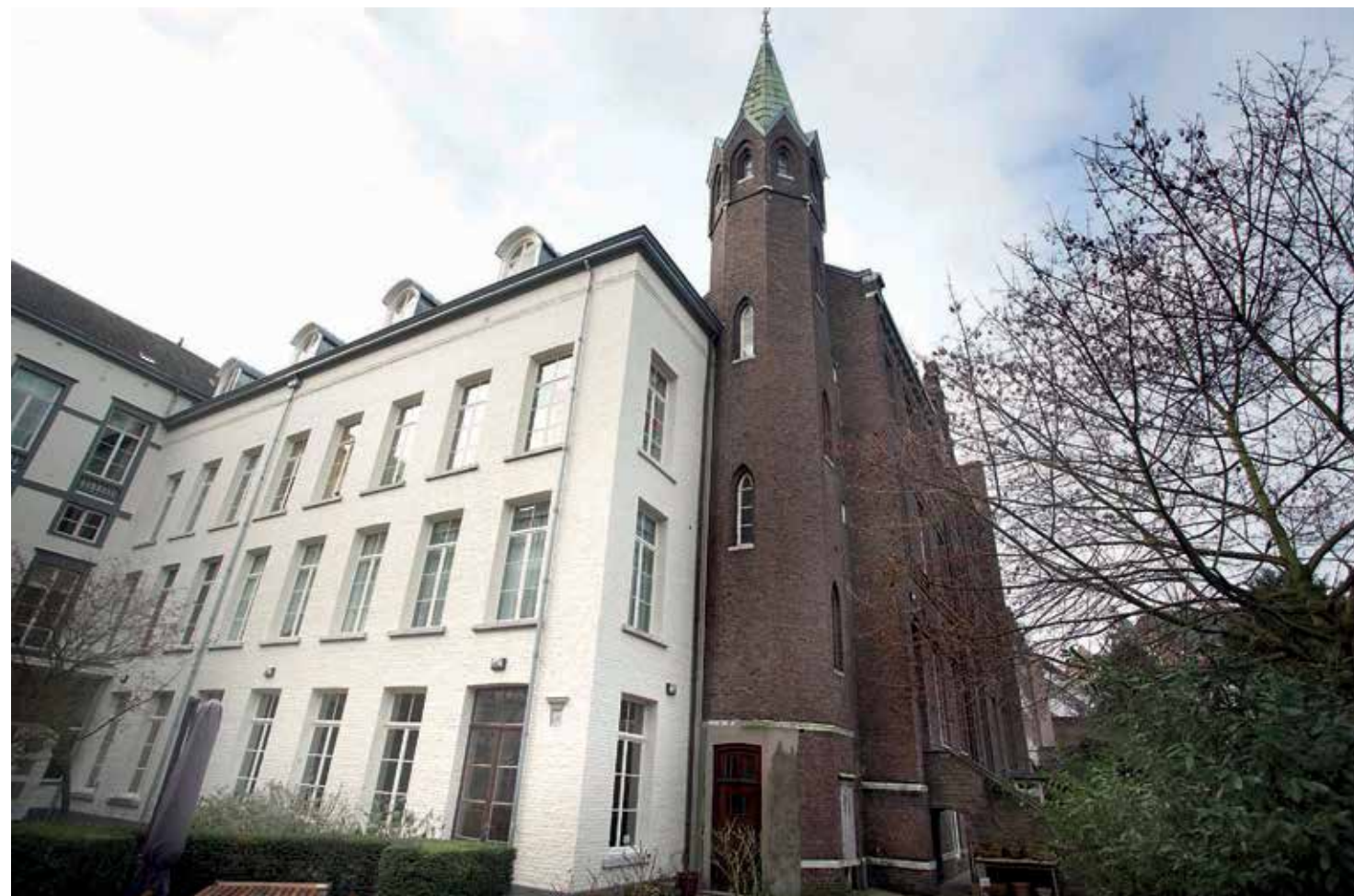
The University Chaplaincy will be using the spaces on the ground floor

The name also refers to the stage in life in which students find themselves. “With their youth behind them and their future career ahead of them. We hope to be able to help them with the questions that arise from this time of freedom and the choices that they have to make. It is also