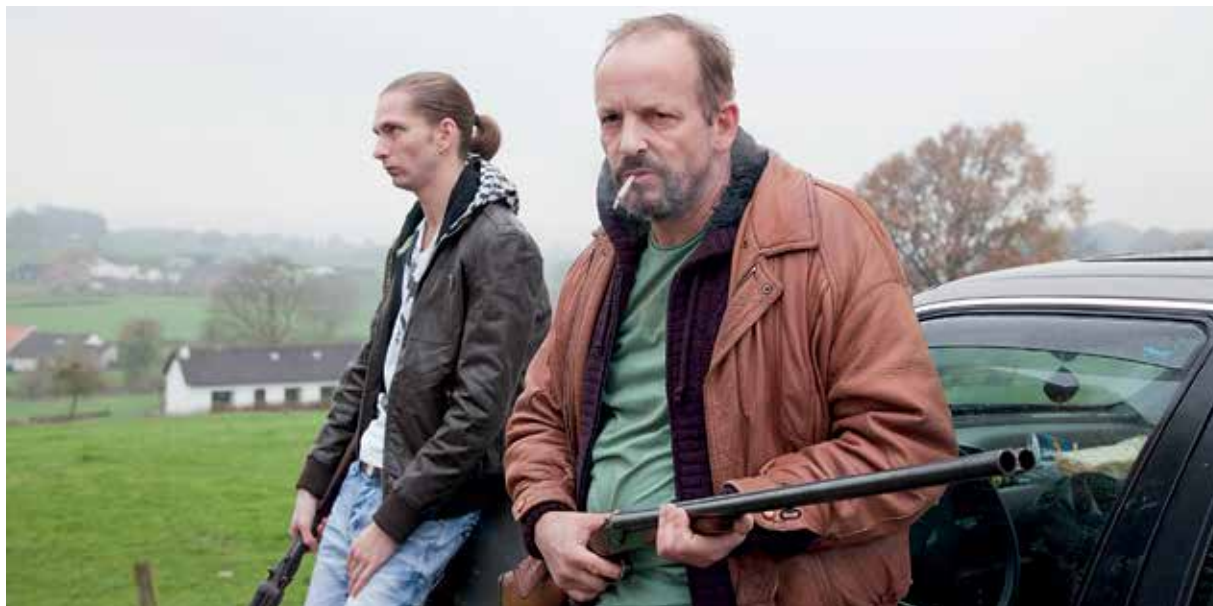
Still uit Gluckauf

de Oostelijke Mijnstreek (in sommige kringen ook wel de Oostelijke Schaamstreek genoemd) en natuurlijk het prachtige Limburgse dialect.