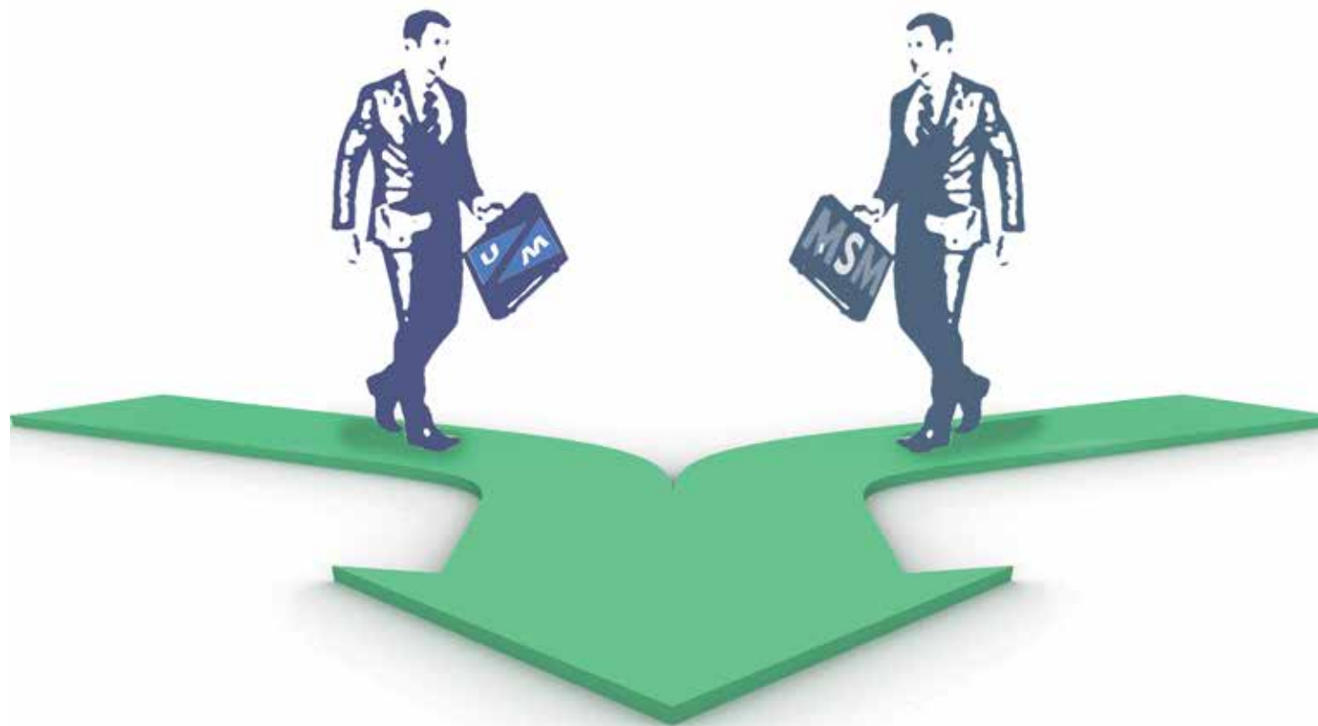
Illustratie: Simone Golob

“De Universiteit Maastricht (UM) en de Maastricht School of Management (MSM) zijn voornemens hun krachten te bundelen”, heette het in een persbericht. En ook: “De besturen van beide instellingen streven er naar nog dit jaar tot formalisering van de samenwerking te komen.” Dat persbericht dateert van 21 mei 2013. Intussen zijn ruim anderhalf jaar voorbij, en de onderhandelingen zijn nog steeds niet rond. De huidige decaan van de SBE verwacht nu “dat we er in juni van dit jaar uit zijn. Dan gaat het door. Of niet.”