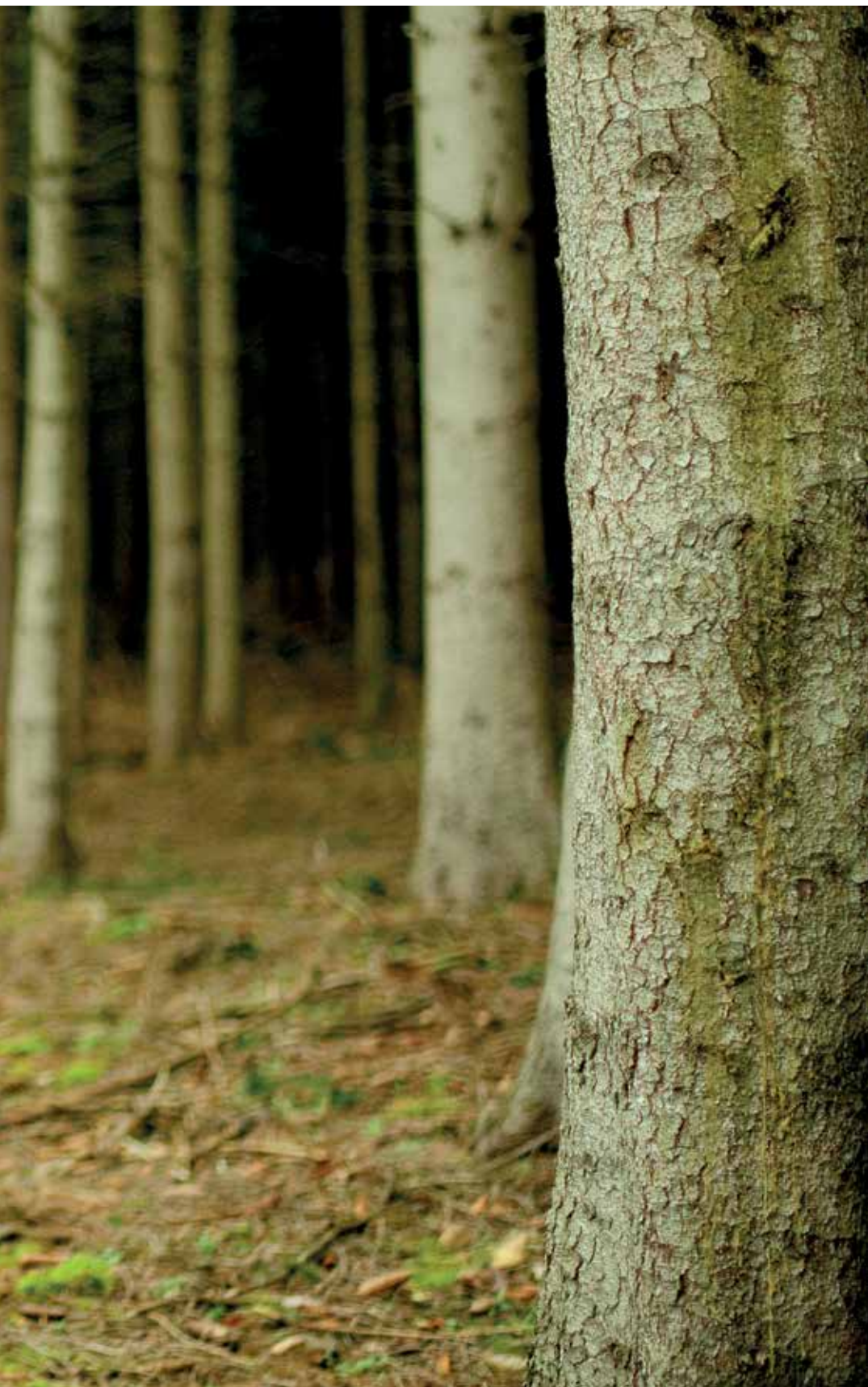
Still uit Gluckauf