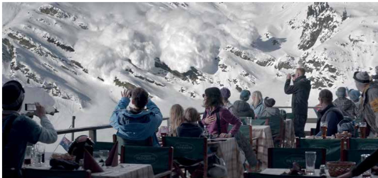
Still uit Turist

nog in een diepe crisis verzeild raken als het wifi-netwerk niet beschikbaar is of de batterijen van de elektrische tandenborstel niet zijn opgeladen.