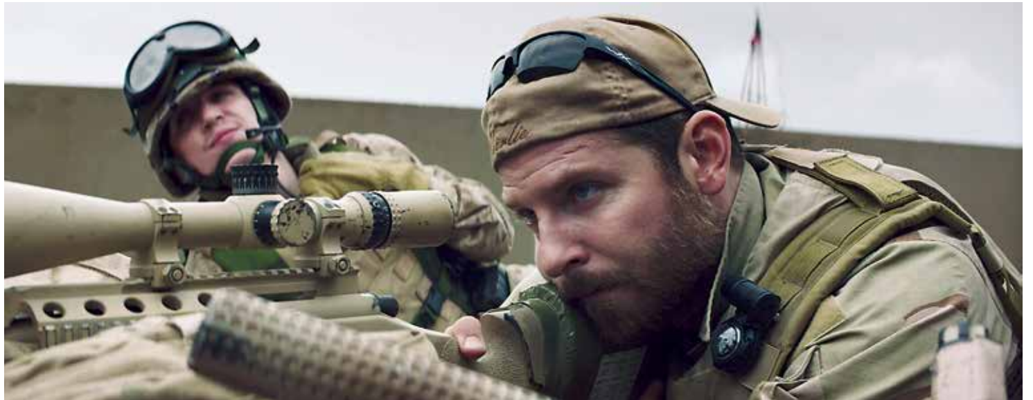
Still uit American Sniper