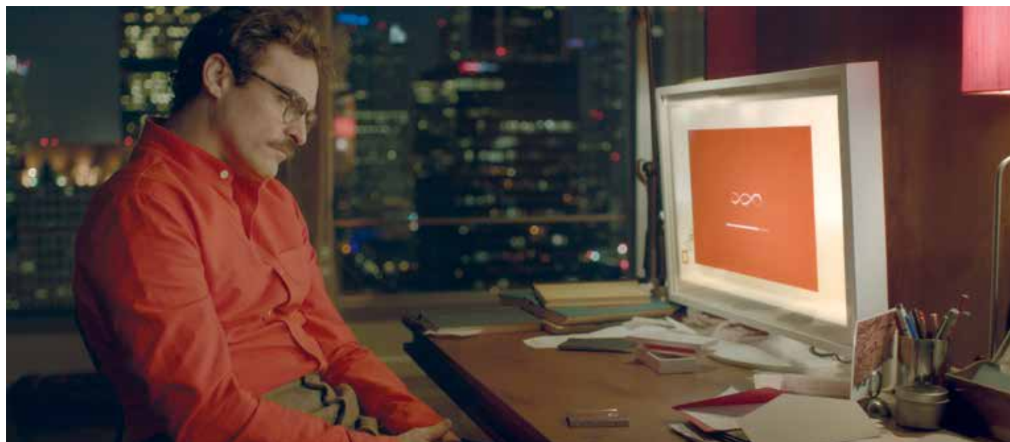
Still uit Her

film buiten beeld, maar werd desondanks tijdens het filmfestival in Rome gelauwerd als beste actrice. Terecht, want het hese stemgeluid van Johansson is dermate verleidelijk dat ik na het zien van Her gelijk naar mijn UM-kantoor ben gesnel om lepeltje lepeltje te gaan liggen met Athena Desktop.