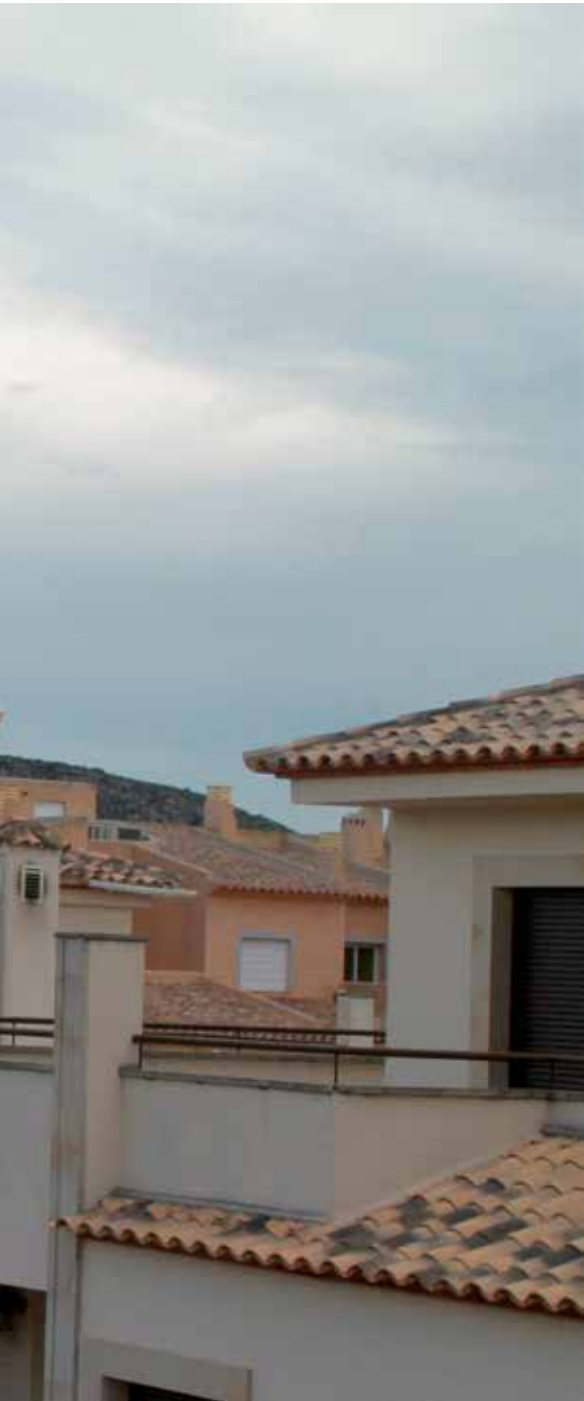
Wouter Buikhuisen in Spanje

gische afwijkingen van individuen was eind jaren zeventig taboe. Wetenschappers, columnisten en door politici. In maart zou hij een onderzoek, maar de Leidse criminoloog zegde af vanwege de woonplaats Moraira in Spanje.