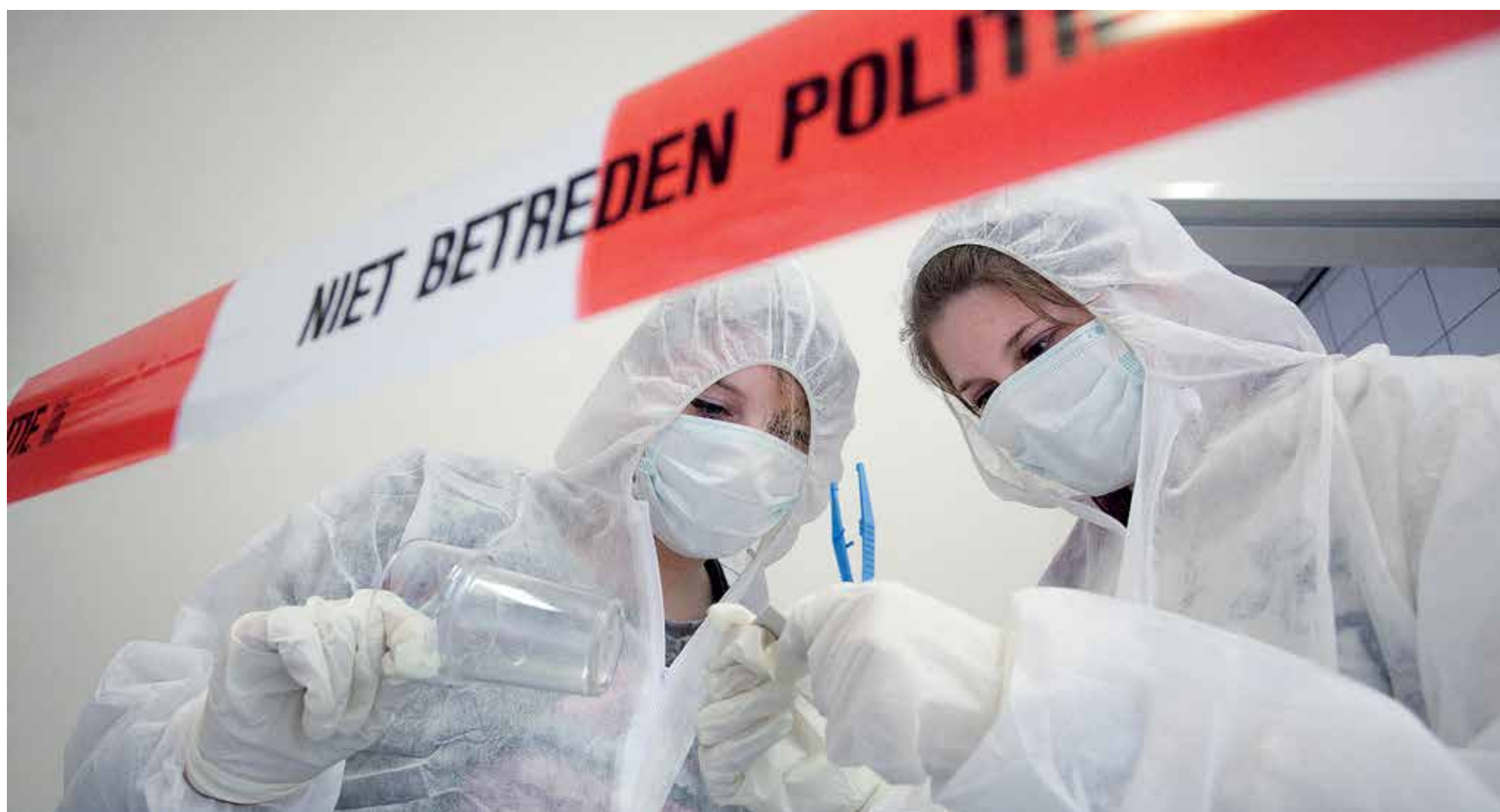
Vingerafdrukken? Haren? Bloedsporen? Masterstudenten forensica mochten afgelopen dinsdag aan de slag op een 'plaats delict'. Zie pagina 7.

Onafhankelijk weekblad van de Universiteit Maastricht | Redactieadres: Postbus 616 6200 MD Maastricht | Jaargang 34 | 27 februari 2014